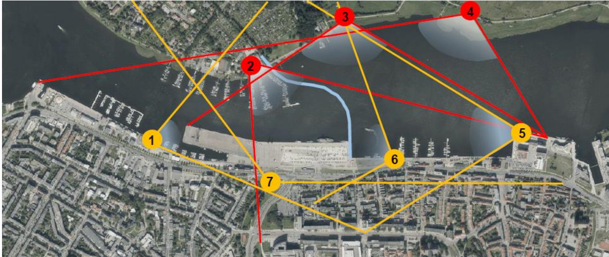
Abbildung 5: Standpunkte für die Visualisierung des Stadtbildes

Zur Beschreibung des Bestands sind an 7 Standorten Aufnahmen erstellt worden (vgl. Abbildung 5) und in der Stadtbildanalyse (vgl. Unterlage 19.3.6) näher erläutert.