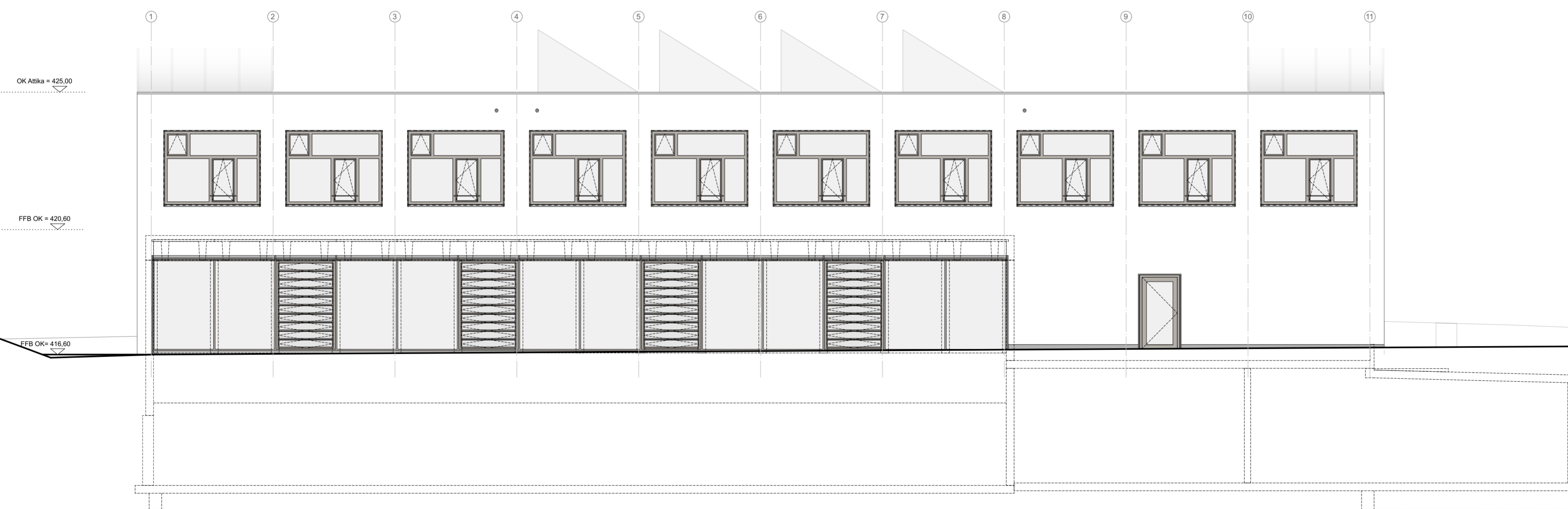
Ansicht West M 1:100