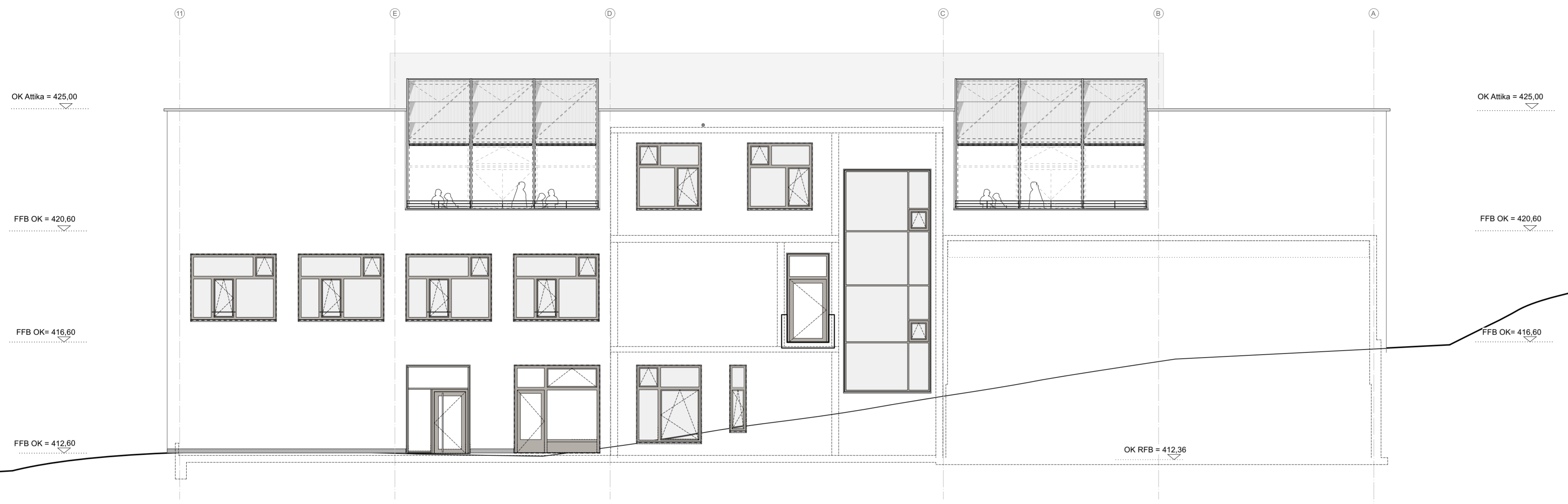
Ansicht Nord M 1:100