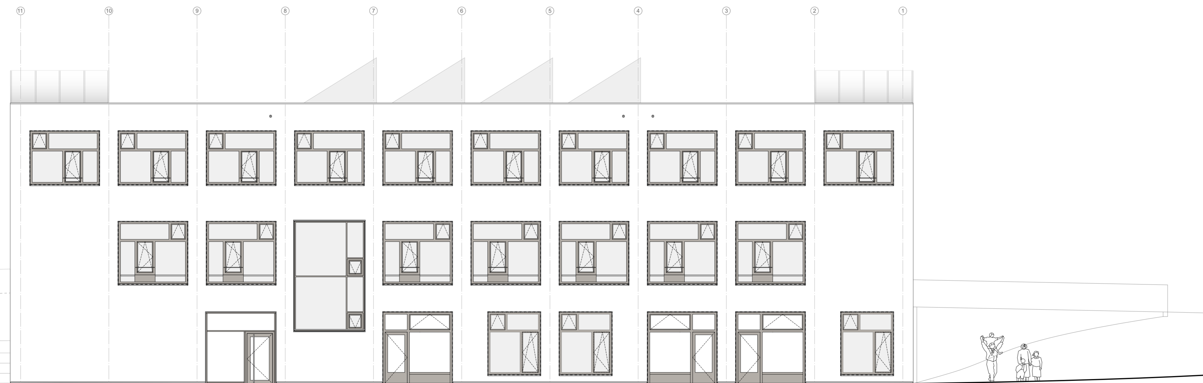
Ansicht Ost M 1:100