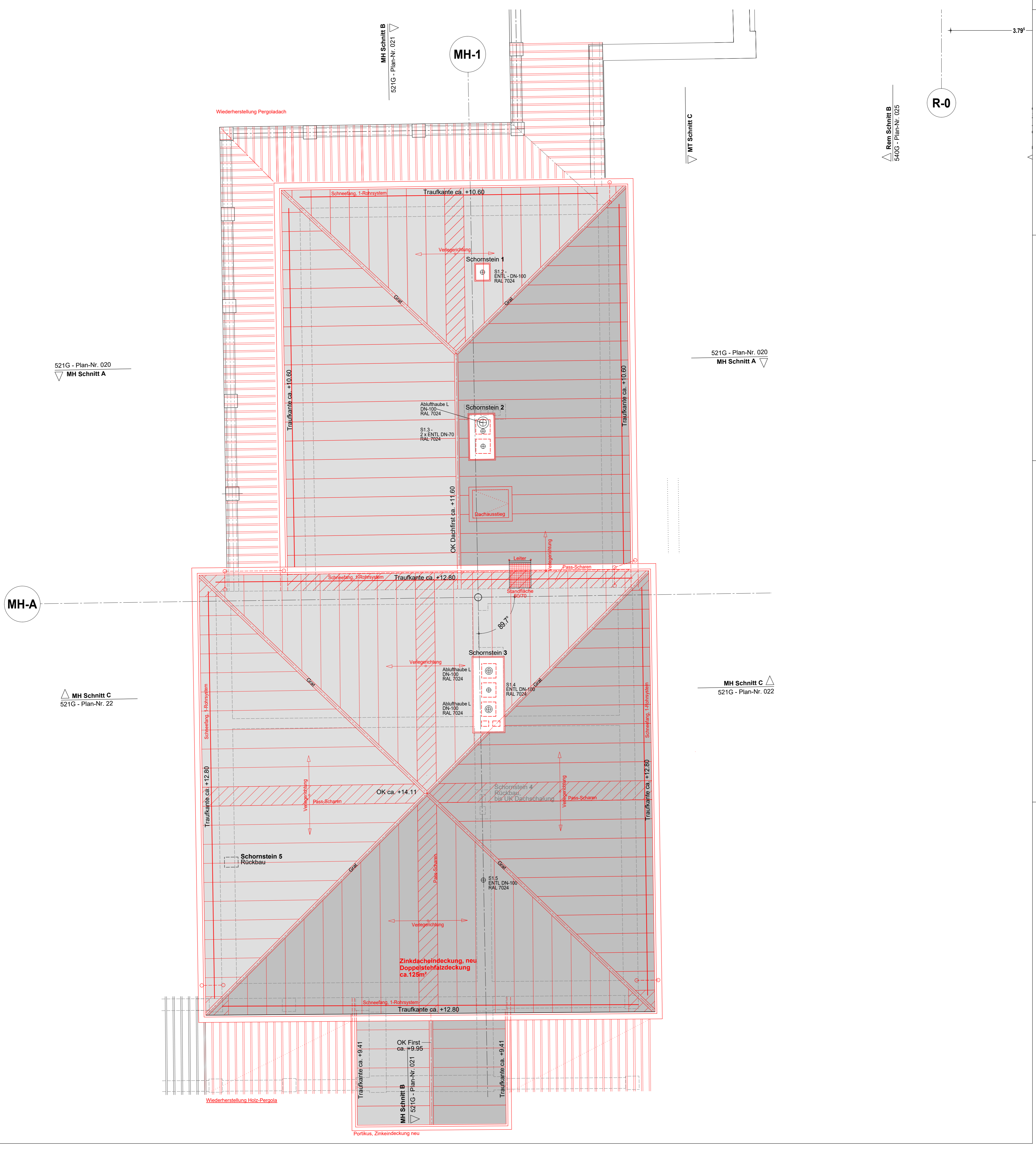
521G - Plan-Nr. 020 MH Schnitt A