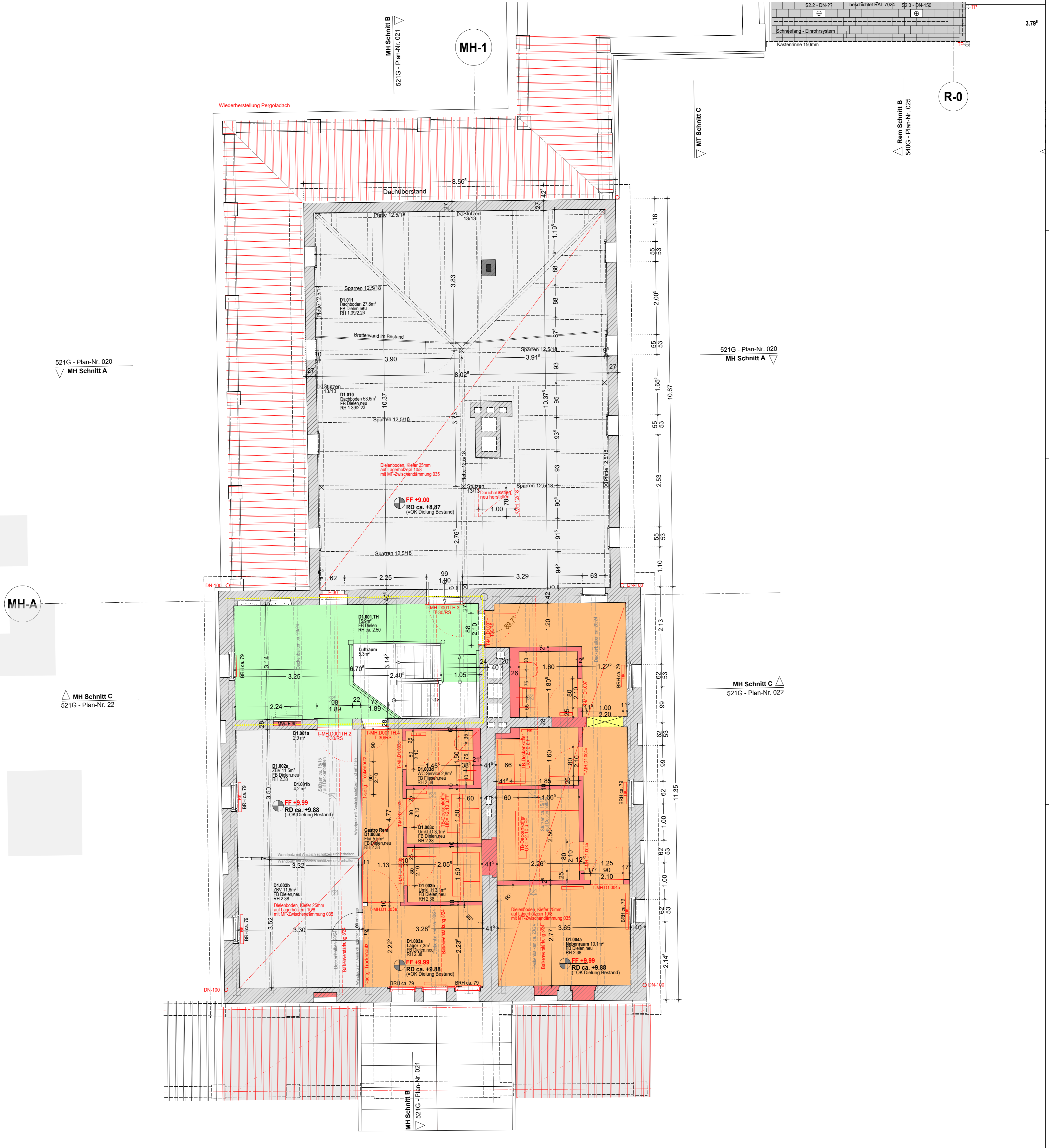
521G - Plan-Nr. 020 MH Schnitt A