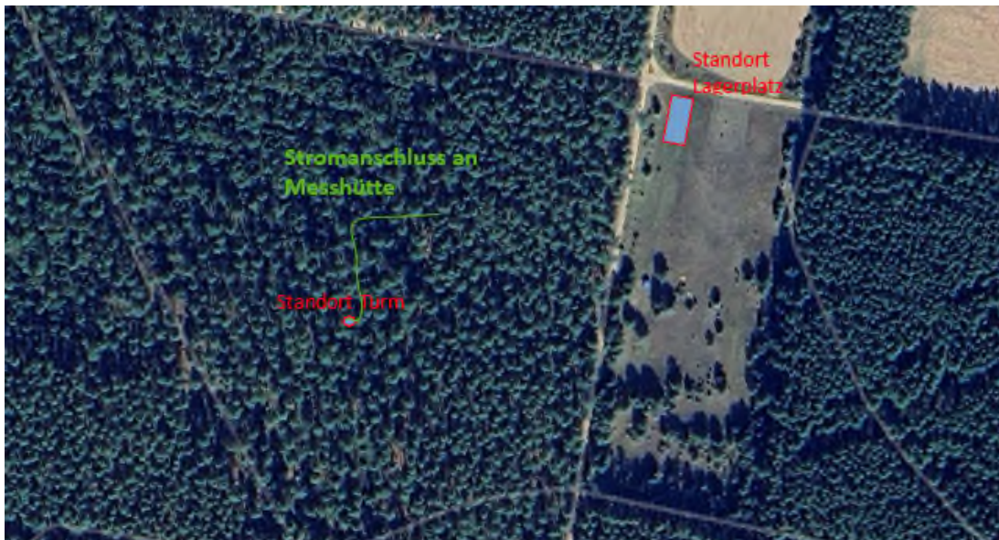
Abbildung 7: GoogleEarth-Skizze zur ungefähren Leitungsführung

Vom Fuß des Turmes muss ein ca. 200 m langes Leerrohr mit Erdkabel (ca. 200 m) für die Spannungsversorgung sowie zwei Netzwerkkabel (ca. 200 m) zur Messhütte auf die Versuchsfläche verlegt werden (s. Abbildung 7). Die Leitungen müssen gegen äußere Einflüsse geschützt und für den dauerhaften Betrieb geeignet sein. Im Leerrohr sind weitere Führungsseile mit zu ziehen, um eine Nachrüstung weiterer Leitungen zu ermöglichen.