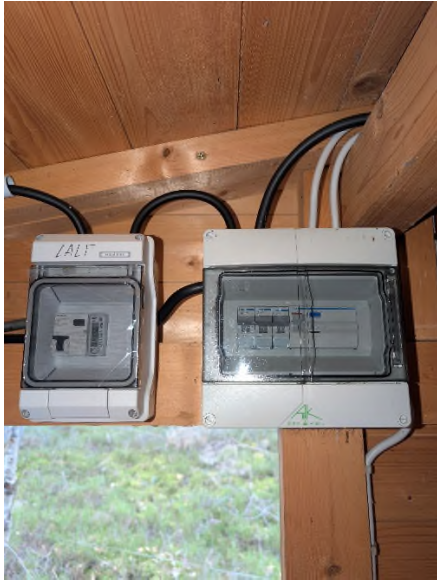
Abbildung 8: Hauptanschluss in der Messhütte auf der Versuchsfläche

Die Spannungsversorgung der Sensoren oben am Mast, erfolgt durch das 24 VDC-Netzteil, welches eine 230 VAC (L, N, PE) Zuleitung (ca. 50 m) vom Eddy-Container benötigt und zu installieren ist (s. Abbildung 5).