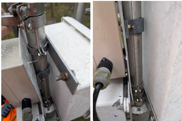
Abbildung 1: Ansicht der vorhandenen alten Halterungen

Am Turm sind die verschiedenen Messapparaturen mit den vorgesehenen Halterungen (vorhandene alte Sensorhalterungen wie Grundplatten, Schellen, Ausleger usw.) mit neuen Steckverbindungen mit Sicherungen zur leichteren Montage/Demontage ohne Werkzeug anzubringen (s. Abbildung 1) oder neue Halterungen anzupassen. Außerdem sind die Sensoren mit Ausleger (Gasanalysator, 3D-Windforke, Strahlungssensor) beweglich, mit Arretierung am Turm zu befestigen, um diese während einer Wartung einklappen oder einziehen zu können.