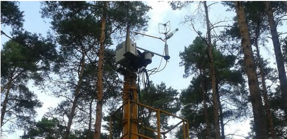
Abbildung 3: Vorhandenes Messsystem auf Stafette

Für die Eddy-Kovarianz Messungen muss ein Gasanalysator mit Messeinheit, eine 3D-Windforke und ein Strahlungssensor installiert werden (Abbildung 3).