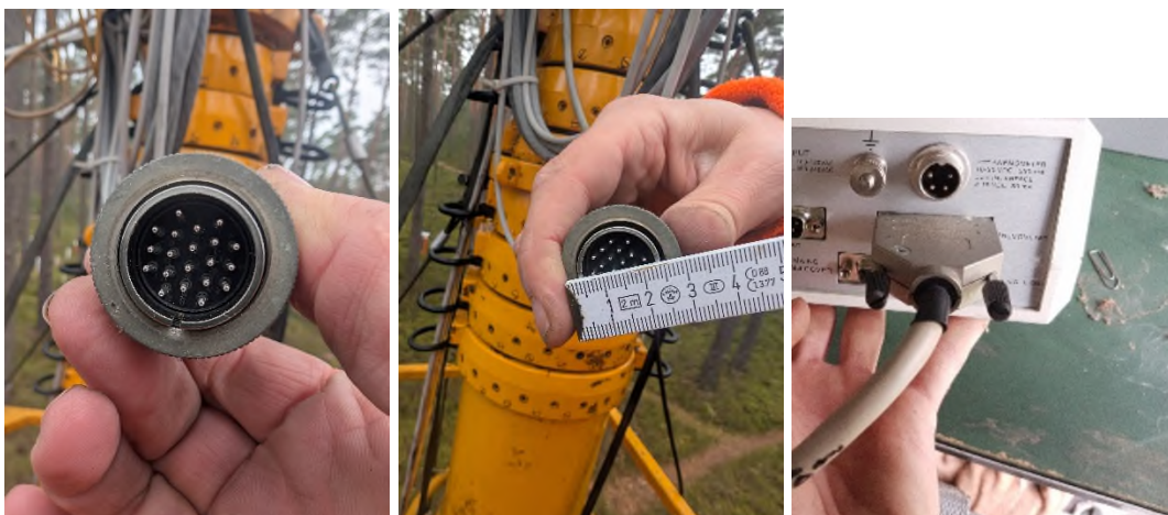
Abbildung 9: Anschlusskabel GILL-Messeinheit zum PC

Die GILL-Messeinheit ist mit einem ca. 50 m Kabel an einen PC mit einer Software zur Verarbeitung der Messwerte angeschlossen, welche ggf. erneuert werden muss (s. Abbildung 9).