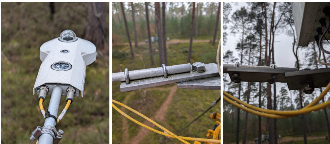
Abbildung 6: CNR4 Strahlungssensor mit Ausleger am Mast