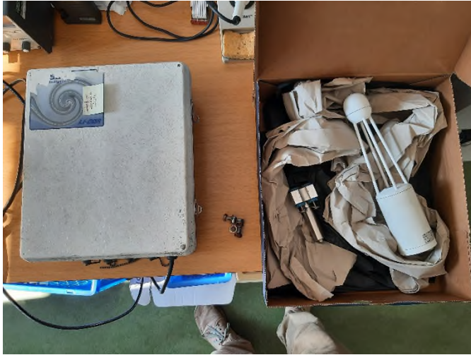
Abbildung 4: Gasanalysator und Messeinheit s. auch: https://www.manualslib.com/manual/1286500/Li-Cor-Li-7500.html