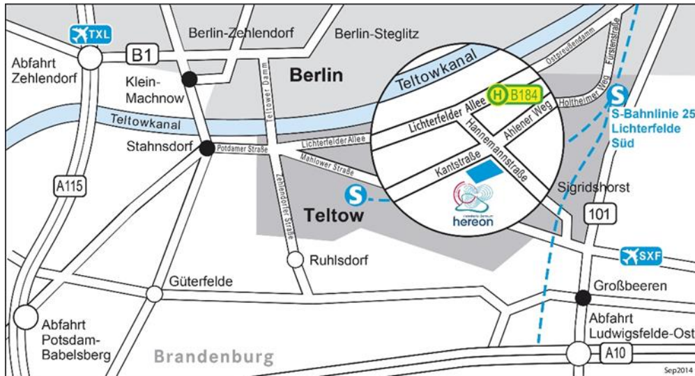
Abbildung 4 Anfahrt Helmholtz-Zentrum hereon GmbH, Standort Teltow