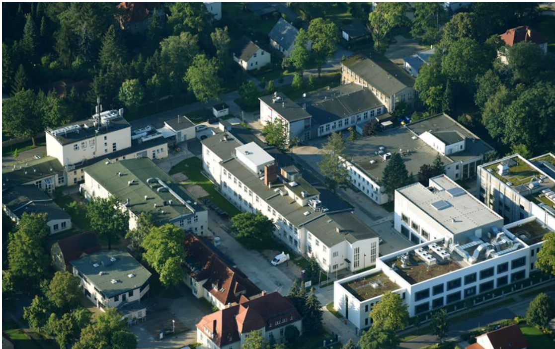
Abbildung 1 Standort Teltow

Weitere Informationen sind der Unternehmenspräsentation im Internet unter www.hereon.de zu entnehmen.