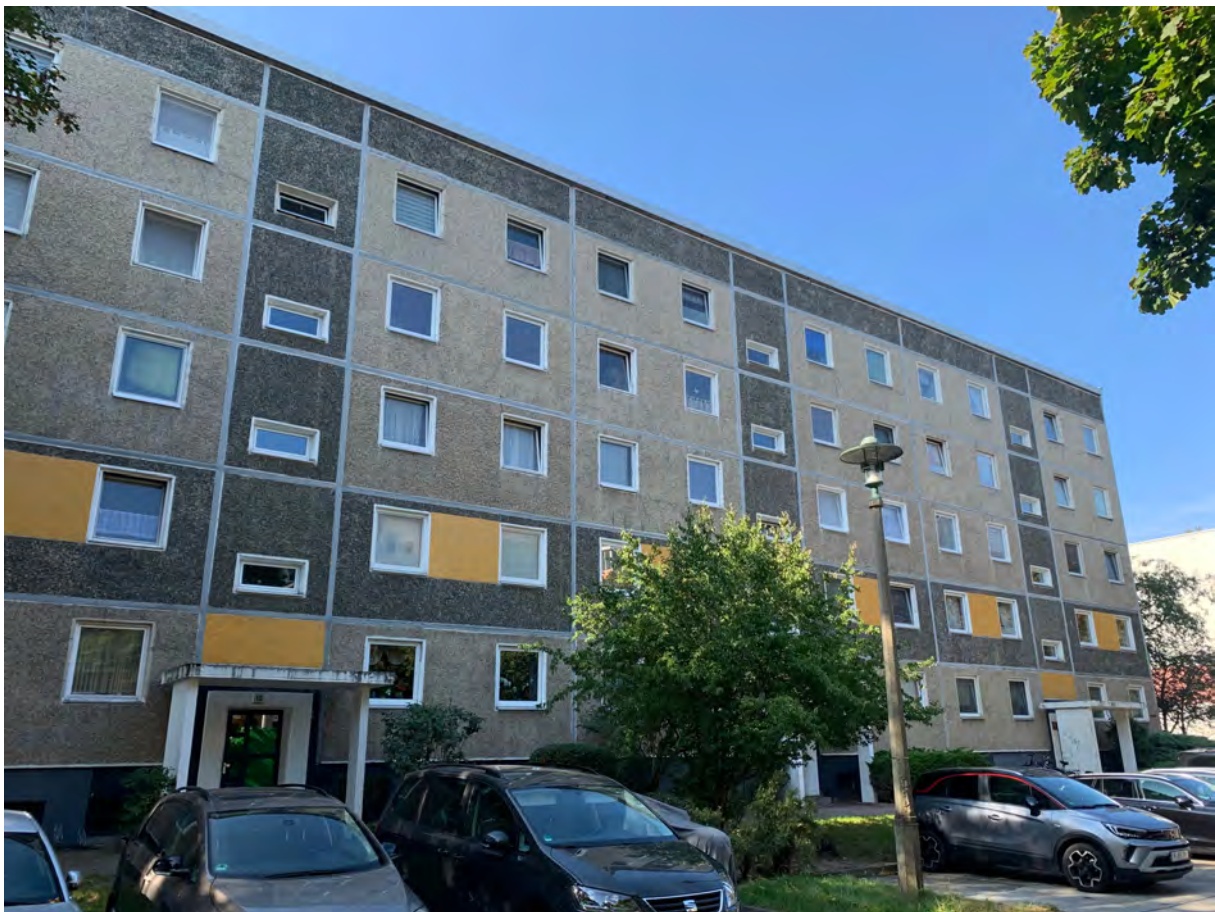
Abbildung 1: Beispielansicht Gebäudekomplex Saarmunder Str. 6-18 mit verschlossenen Fugen