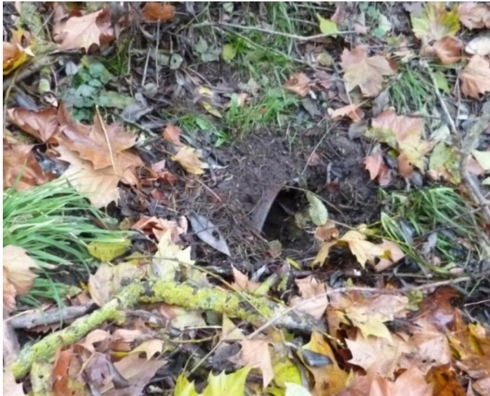
Abbildung 1: Rohrdurchlass Schreyergraben

Der Durchlass erhält beidseitig ein Böschungsstück (1:1,5) mit ein einem Wildschutzgitter. Die Böschungstirnflächen werden mit Kleinsteinpflaster befestigt. Und mit Erosionsschutzmatten gesichert.