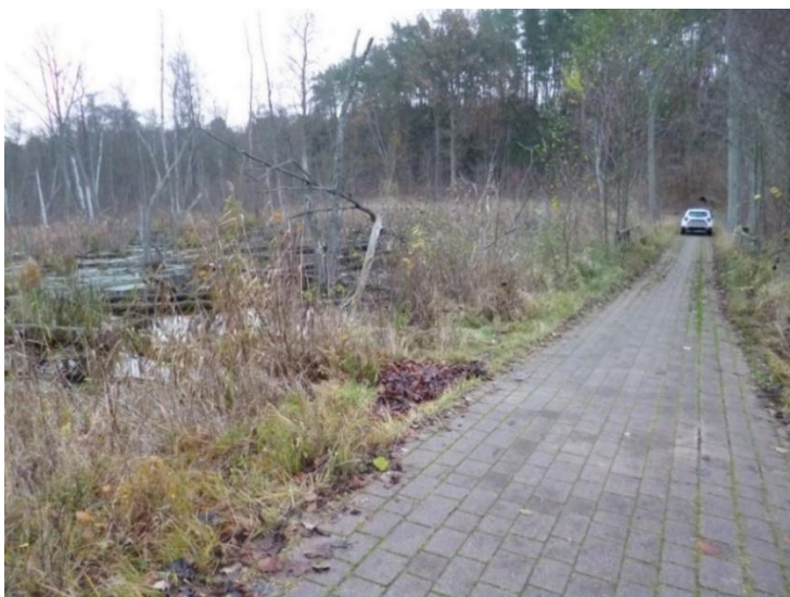
Abbildung 2: Schadstellen Radweg an Durchlass Nr. 5

Durchlass 5 verläuft unterhalb eines Dammes zwischen zwei Gewässern. Der Damm ist ca. 75,00 m lang. Der Radweg und die Bankettbereiche über dem Damm und Durchlass Nr. 5 sind z.T. stark abgesenkt und vom Biber unterhöhlt. (siehe folgende Abb.) Im Randbereich befindet sich Baum- und Strauchbewuchs. Eventuelle Baumfällung in dem Bereich sind mit der ökologischen Bauüberwachung abzuklären.