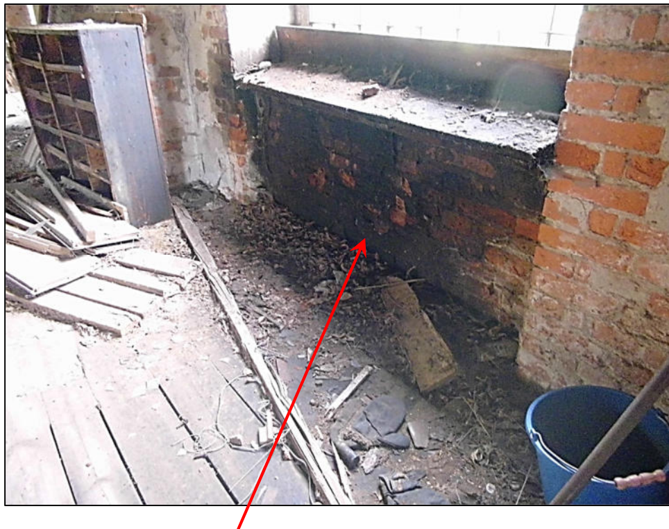
Bild 1: överschmutzter Teilbereich, westliche Innenwand Hauptgebäude; Probe 23059 - 2