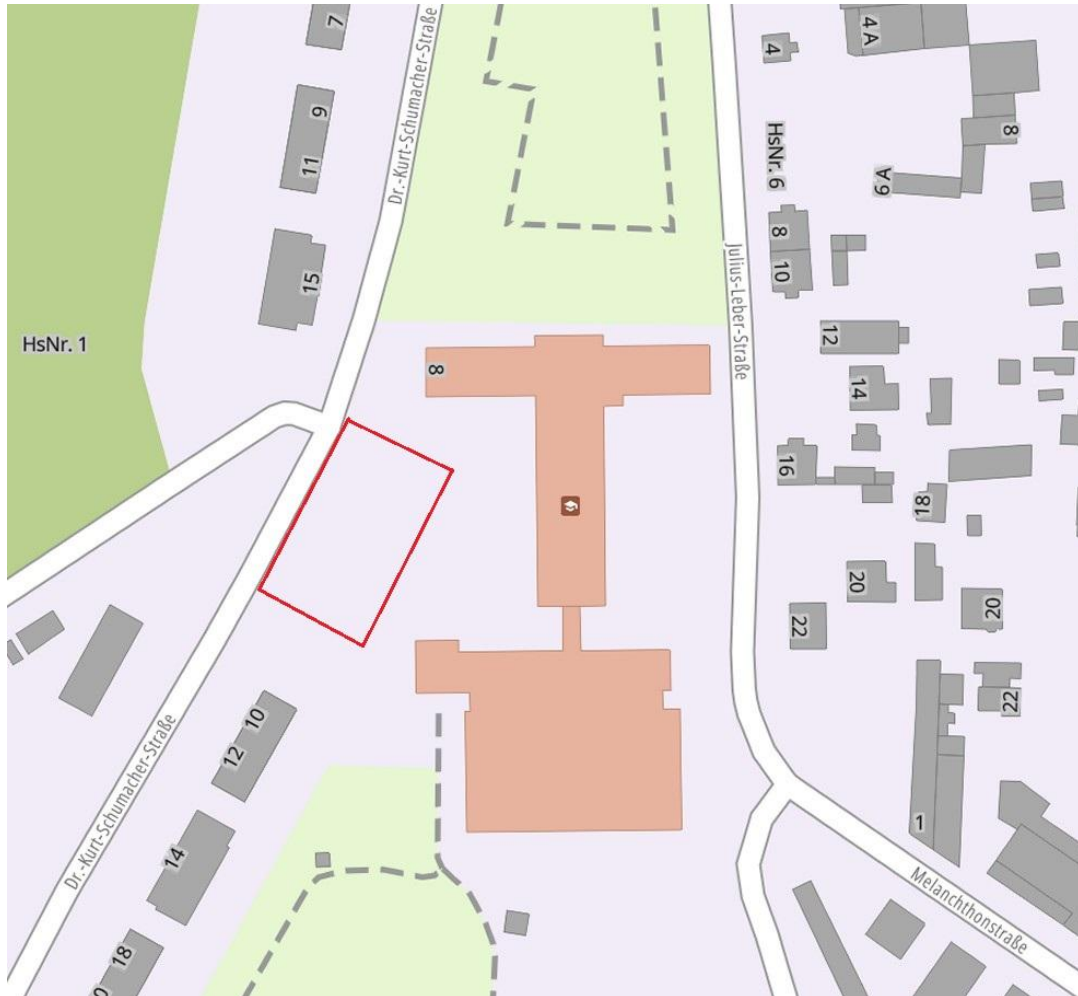
Abbildung 1: Neubau eines Schulgebäudes auf dem Gelände des Louise-Henriette-Gymnasiums, Dr-Kurt-Schumacher-Straße 8, 16515 Oranienburg, rot umrandet, (Quelle: Geoportal Brandenburg)

Auf dem Schulgelände des Louise-Henriette-Gymnasiums an der Dr-Kurt-Schumacher-Straße 8 in 16515 Oranienburg ist der Neubau eines Schulgebäudes als Erweiterungsbau geplant.