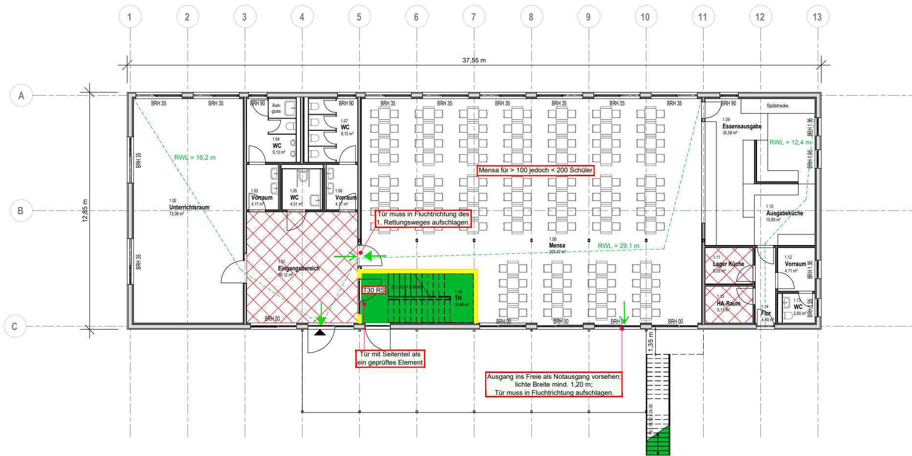
1 GRUNDRISS ERDGESCHOSS 1:200 (A3)