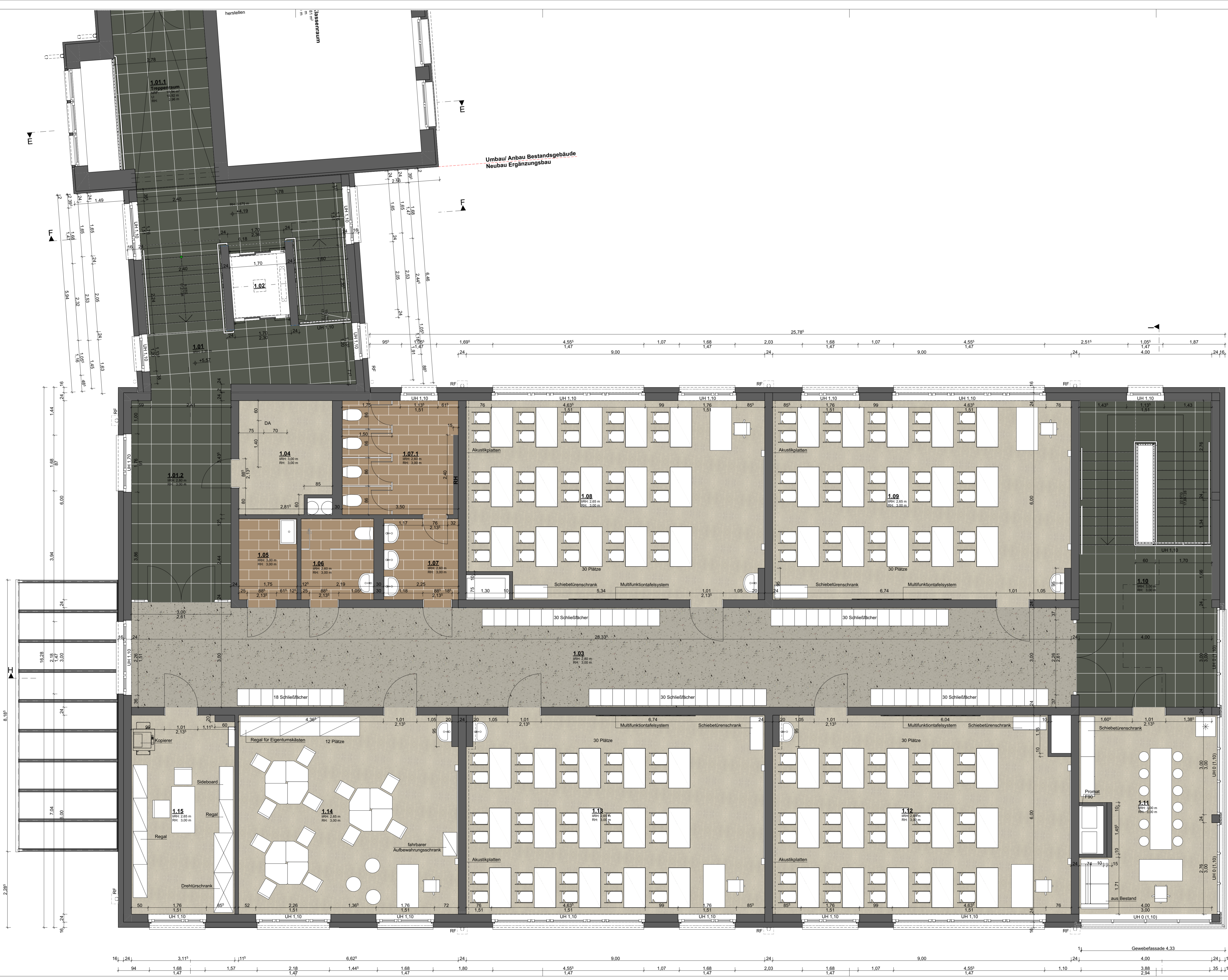
Raumübersicht Obergeschoss Anbau