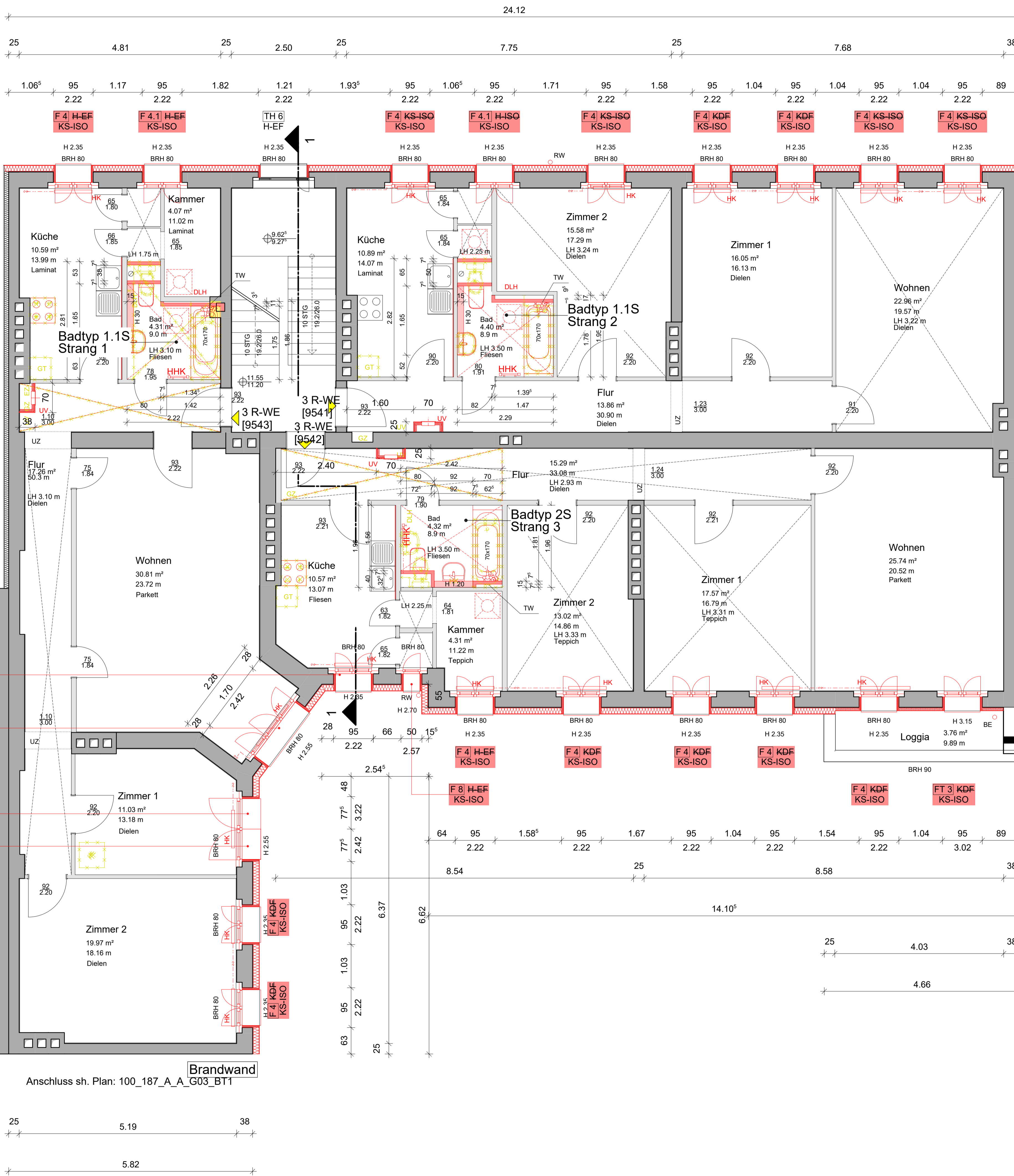
Anschluss sh. Plan: 100_187_A_A_G03_BT1