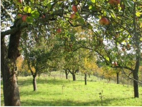
Foto: Streuobstwiese mit alten und regional verbreiteten Sorten (Biodiversität und Ernährung) Bsp. Rieselfelder Münster