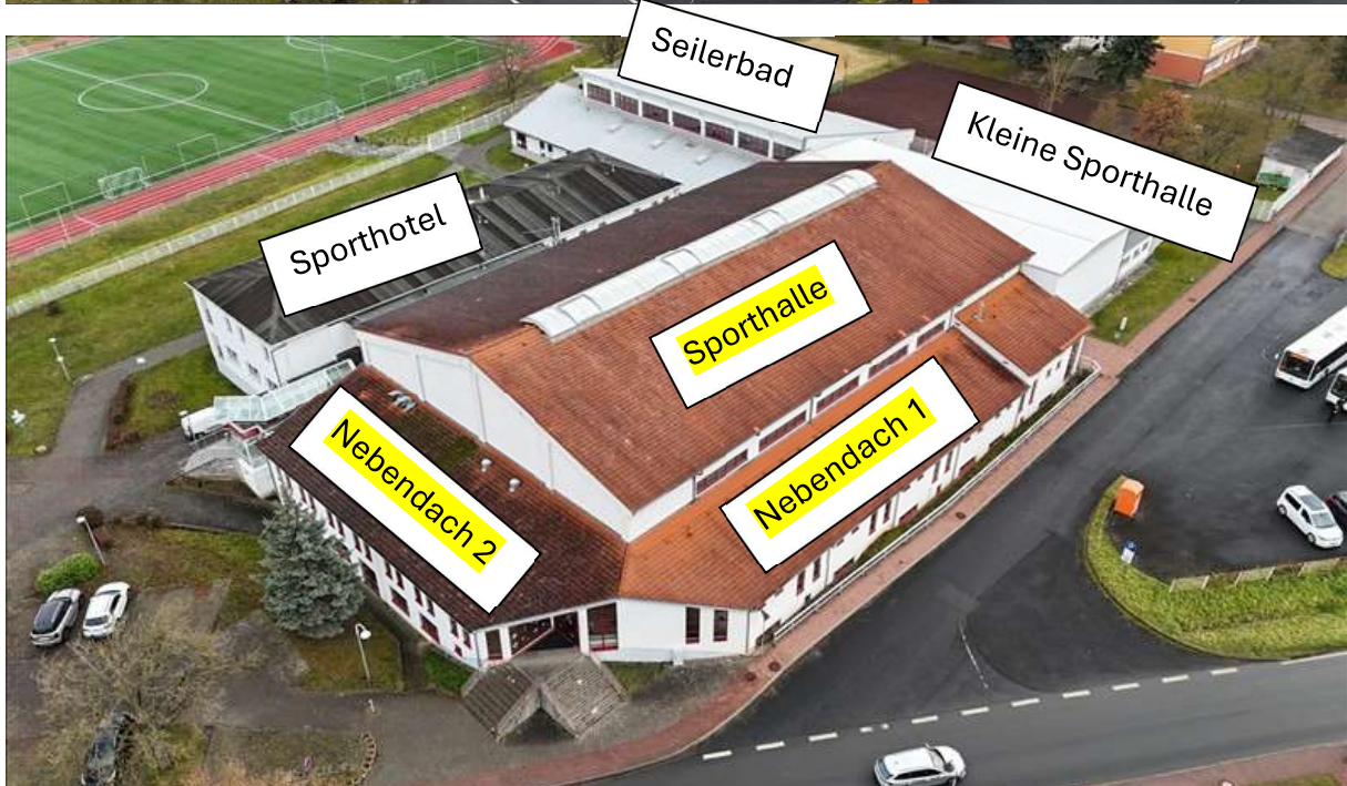
Luftbild Sporthalle mit angrenzendem Sporthotel (dunkles Dach) und kleiner Sporthalle (weißes Dach) sowie Seilerbad (versetztes Pultdach weiß)