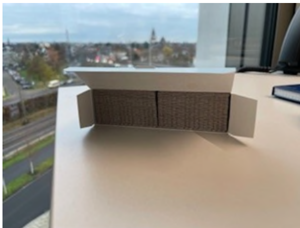
Abbildung 17-18: Kimemo Faltschachtel offen