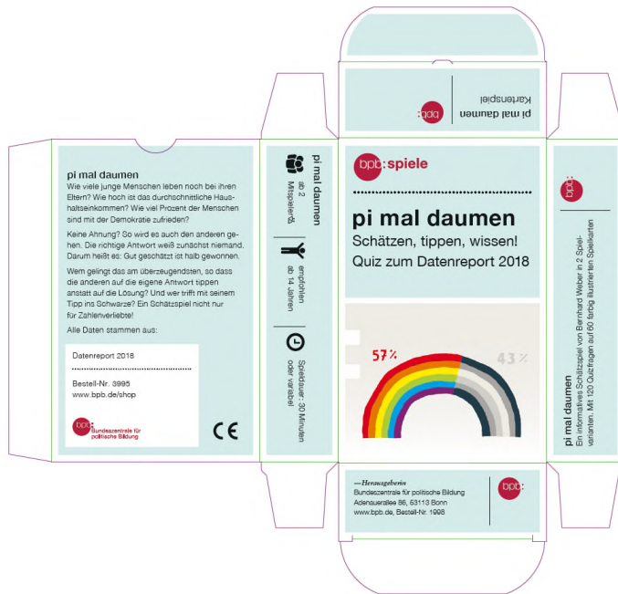
Abbildung 4: Vorlage der Stanzform für die Faltschachtel der bpb:spiele.

Dies ist lediglich eine Vorlage für Aufbau/Konstruktion der Schachtel. Sie ist den Maßen des (verpackten) Kartenblocks des jeweils beauftragtem Kartenspiels anzupassen.