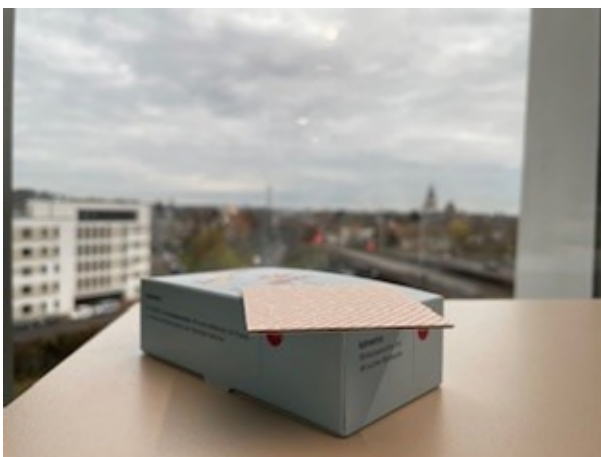
Abbildung 19-20: Kimemo Faltschachtel mit Karte