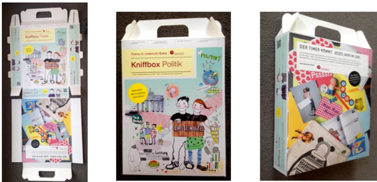
Abbildung 6-8: Kniffbox