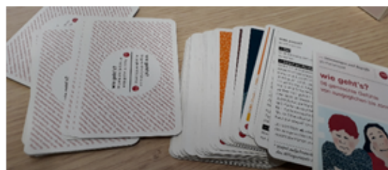
Abbildung 1-3: Kartenspiele - „bpb:spiele“