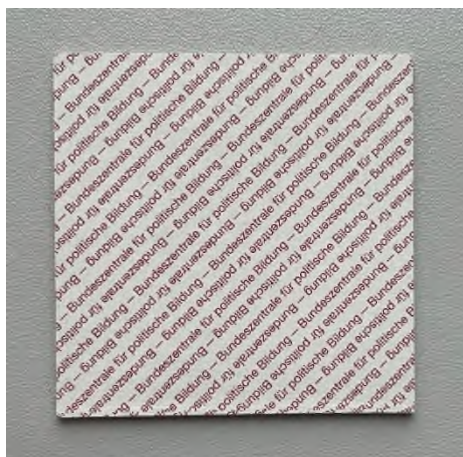
Abbildung 21: Kimemo Karte Rückseite