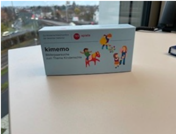
Abbildung 15-16: Kimemo Faltschachtel