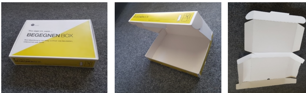
Abbildung 12-14: „Begegnen“-Box