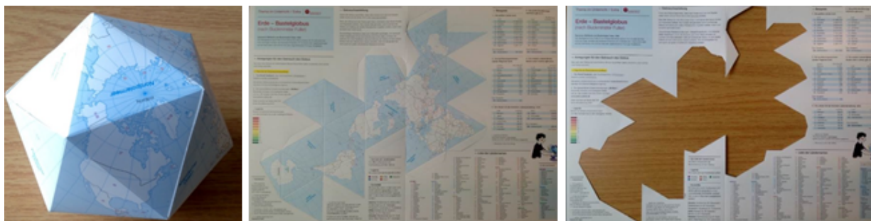
Abbildung 9-11: Bastelglobus