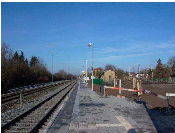
Bahnhofsanlagen in Oberwerrn