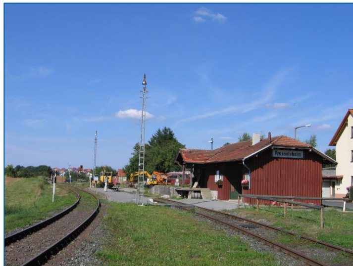
Bahnhofsanlagen in Prosselsheim