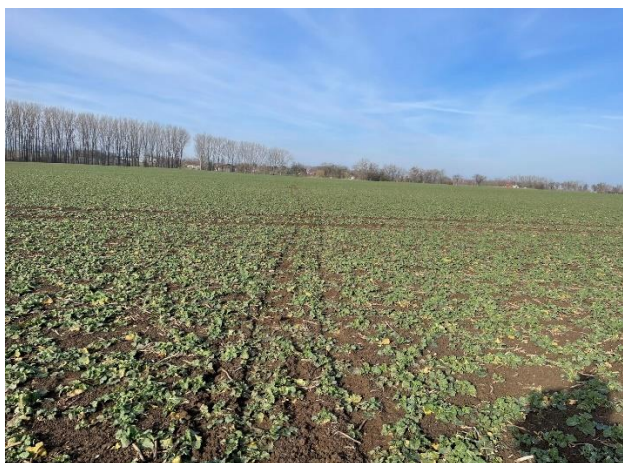
Abb. 4: An der Mühlstätte Blick nach Osten