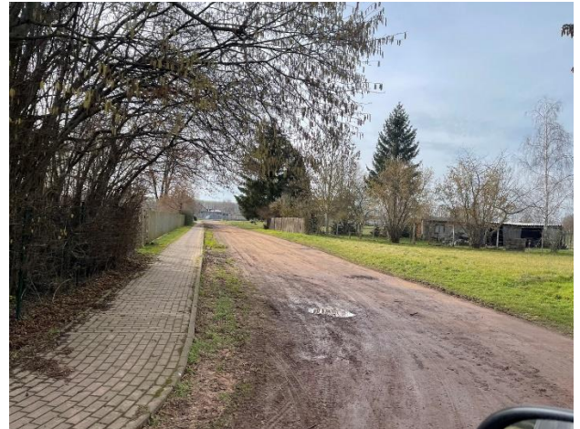
Abb. 6: Fahrweg am Evanders Garten (Blickrichtung West)