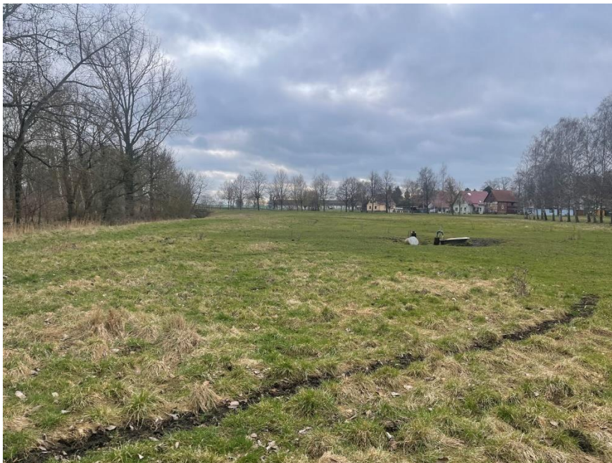
Abb. 9: Als Viehtränke benutzter Quellaustritt zwischen Nesse und parallelem Graben östlich von Friemar

Das Gelände zwischen dem Speicher und der östlichen Ortslage von Friemar ist als Überschwemmungsgebiet ausgewiesen /UP5/.