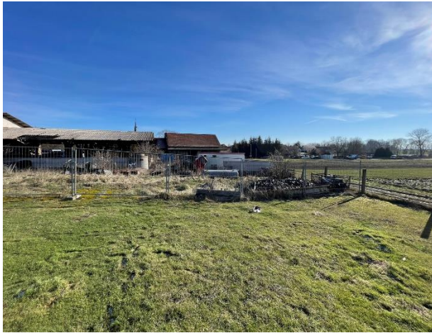
Abb. 5: Standort Pumpwerk (Blickrichtung Osten)