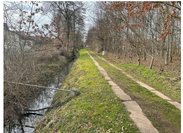
Abb. 8: Fahrweg am Teichgraben (Blickrichtung West)

Der Standort des Pumpwerkes wird derzeit als Wiese genutzt.