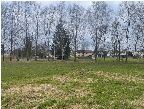
Abb. 1: Blick von Nesseaue nach Friemar (nach Westen)

Das Untersuchungsgebiet liegt im Landkreis Gotha nordöstlich von Gotha. Die Gemeinde Friemar und Pferdingsleben sind Teil der Verwaltungsgemeinschaft Nesseaue.