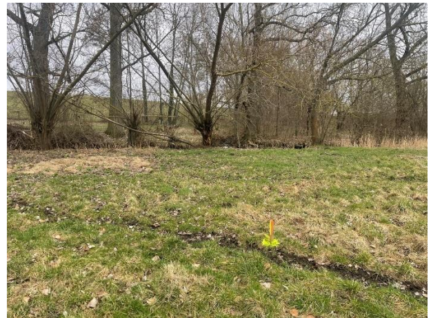
Abb. 2: Blick zur Nesse nach Osten (Querungsbereich)