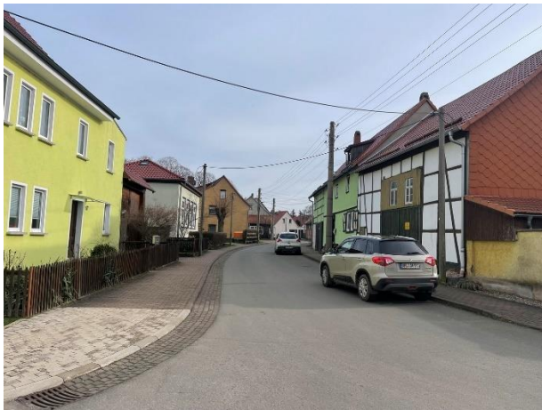
Abb. 7: Pferdingsleben Anger (Blickrichtung Südosten)