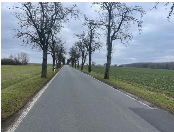
Abb. 3: Blick entlang der K4 nach Osten