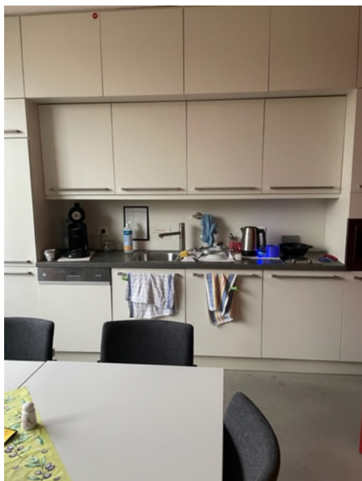
Abbildung 14-Bsp. Küche