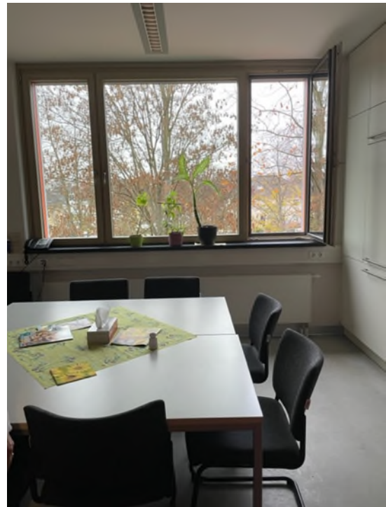
Abbildung 10-Bsp. Besprechungsraum