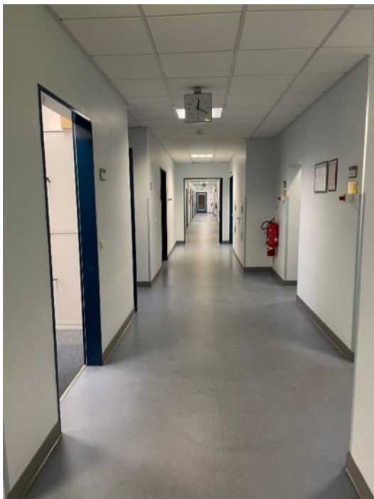
Abbildung 14-Bsp. Flur