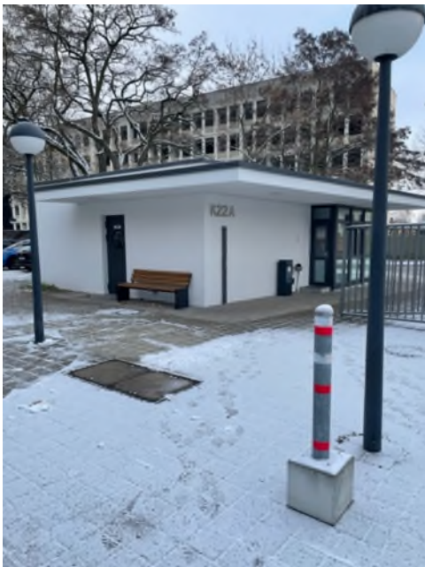
Abbildung 1-Gebäude K22A