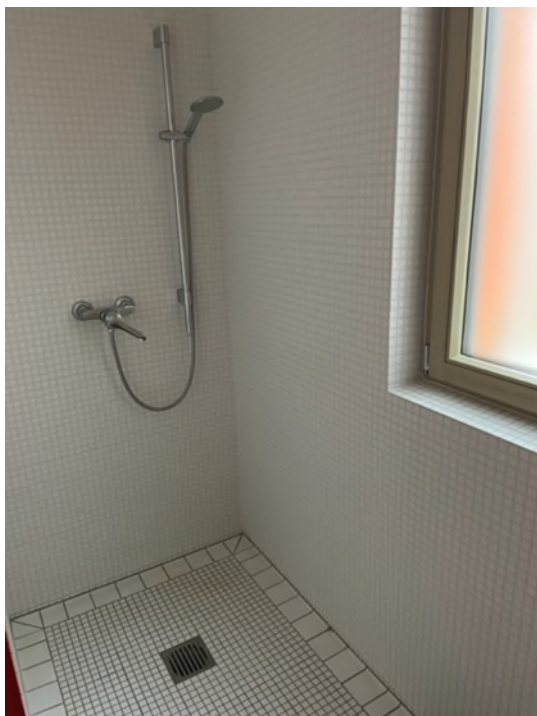
Abbildung 6-Bsp. Dusche