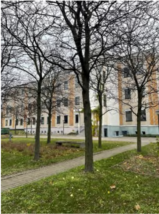
Abbildung 1-Gebäude von außen