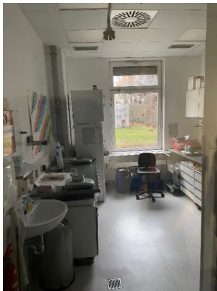
Abbildung 7-Bsp. Labor