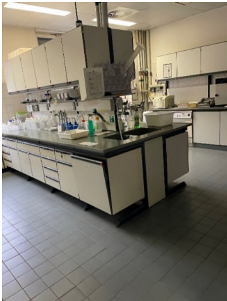
Abbildung 5-Bsp. Labor