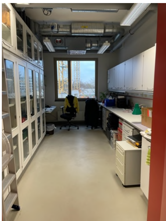
Abbildung 13-Bsp. Labor