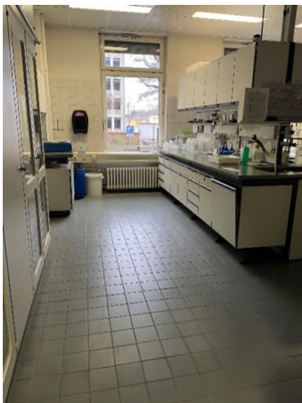
Abbildung 6-Bsp. Labor