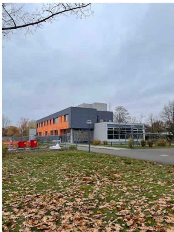
Abbildung 1: Gebäude von außen