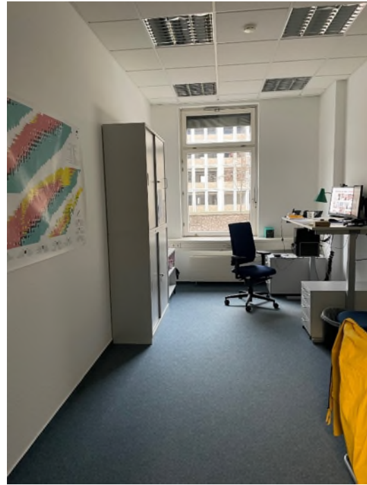
Abbildung 2-Bsp. Büroarbeitsplatz