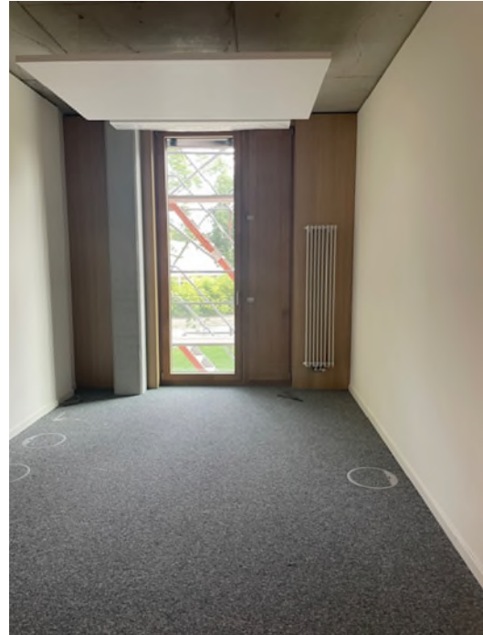
Abbildung 6-Bsp. Büro