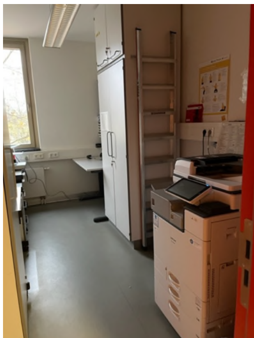
Abbildung 2-Bsp. Kopierraum