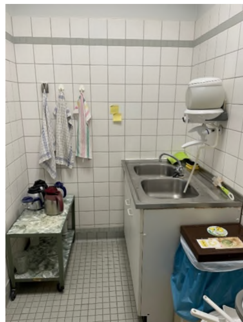
Abbildung 10-Bsp. Waschküche