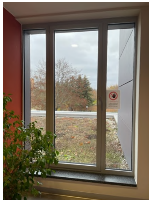
Abbildung 3-Bsp. Flurfenster