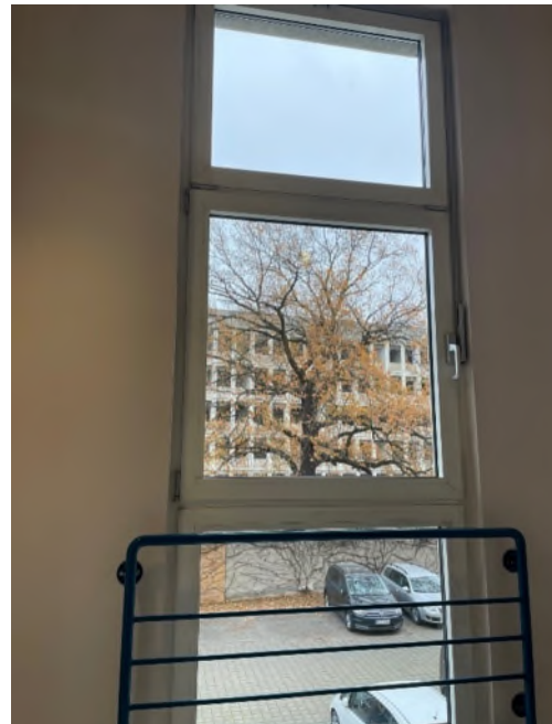
Abbildung 4-Bsp. Flur-Fenster