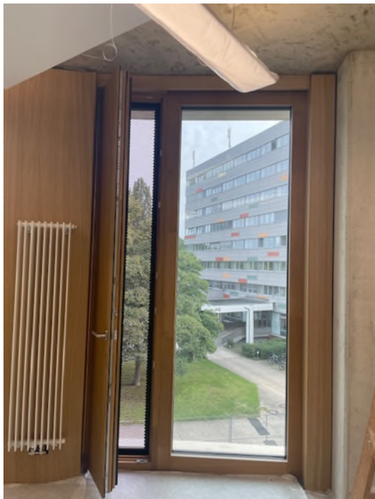
Abbildung 7-Bsp. Büro Fensteransicht mit Nachtöffnung