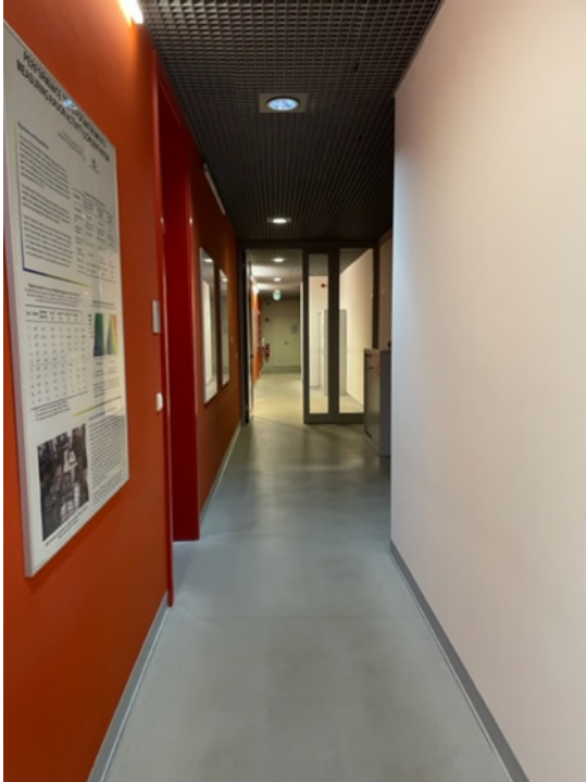
Abbildung 7-Bsp. Flur