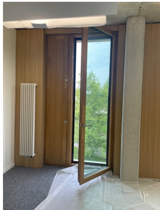
Abbildung 8-Bsp. Büro Fensteransicht mit Nachtöffnung