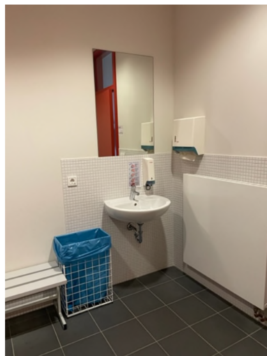
Abbildung 5-Bsp. Waschbecken und Spiegel