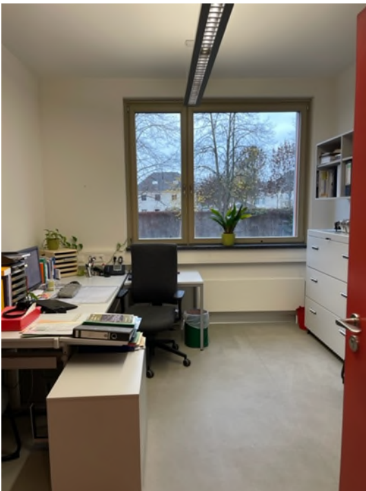
Abbildung 9-Bsp. Büro