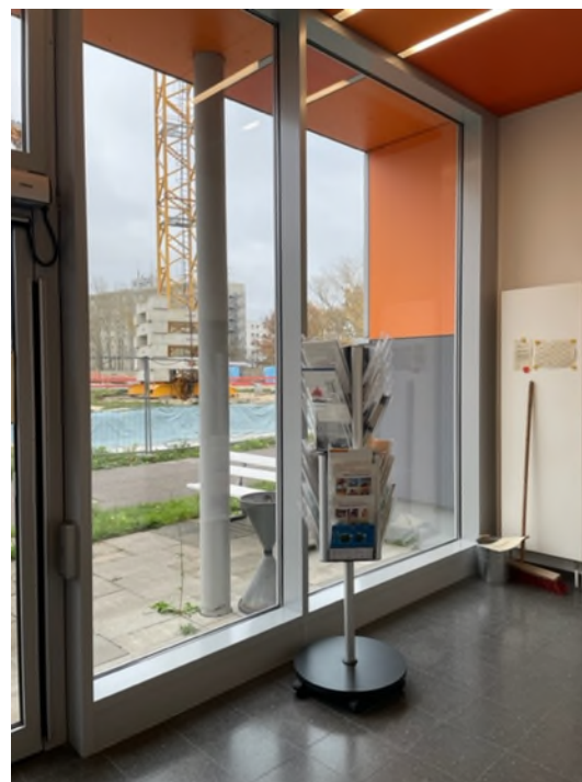
Abbildung 15-Bsp. Foyer