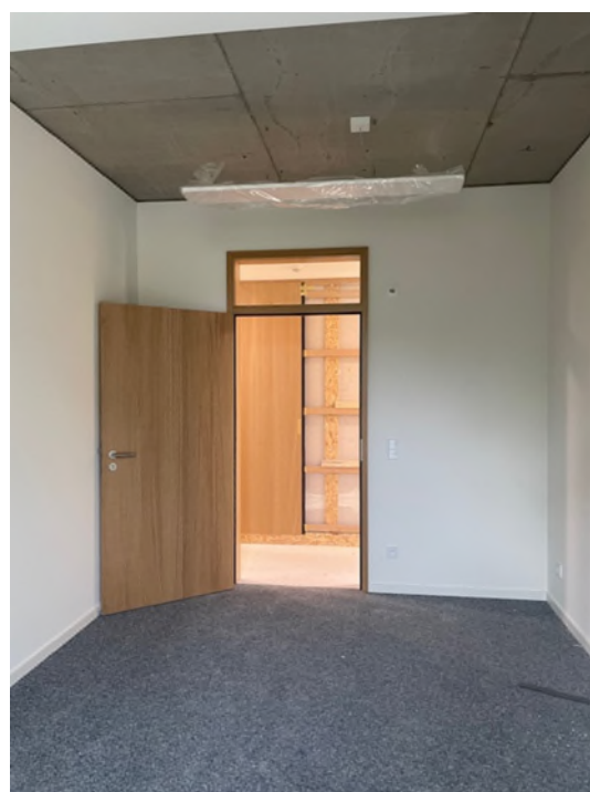
Abbildung 4-Bsp. Büro