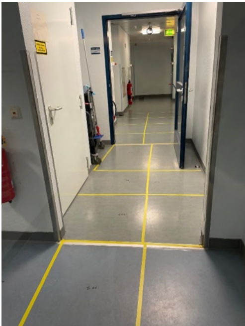
Abbildung 3-Bsp. Laborbereich