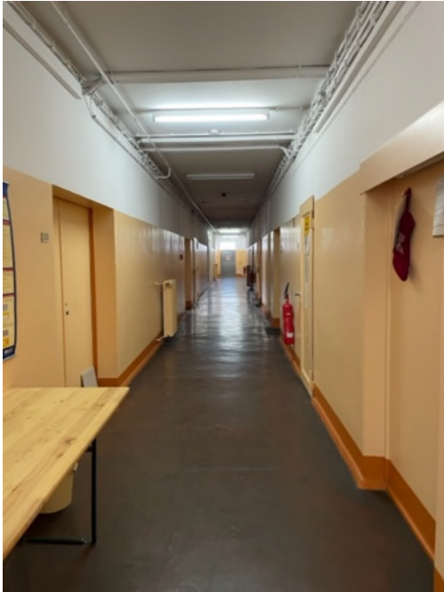
Abbildung 2-Bsp. Flur