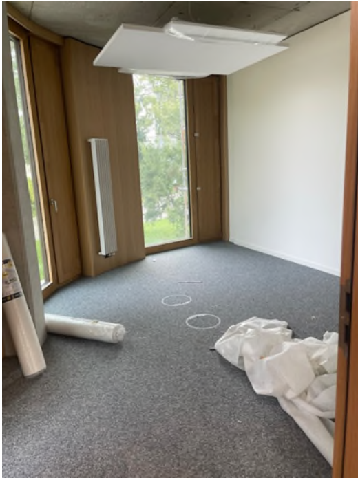
Abbildung 5-Bsp. Büro