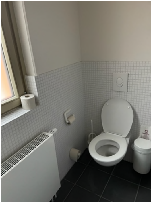
Abbildung 4-Bsp. WC-Damen