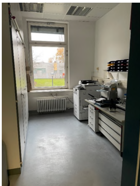
Abbildung 11-Bsp. Kopierraum