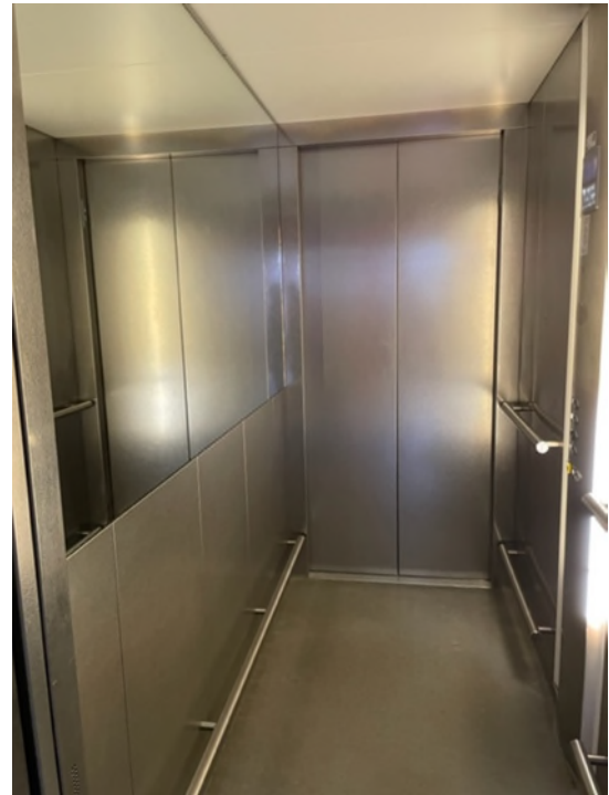
Abbildung 8 Aufzug