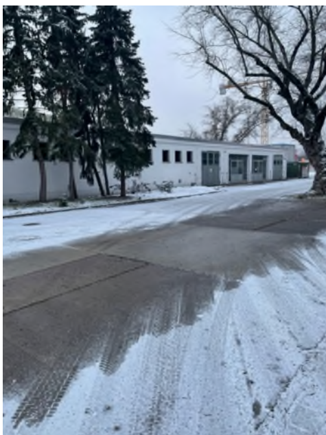
Abbildung 1-Gebäude K17