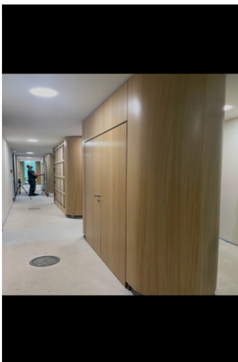
Abbildung 3-Bsp. Flur jetzt mit Teppich (siehe Büro Teppich)