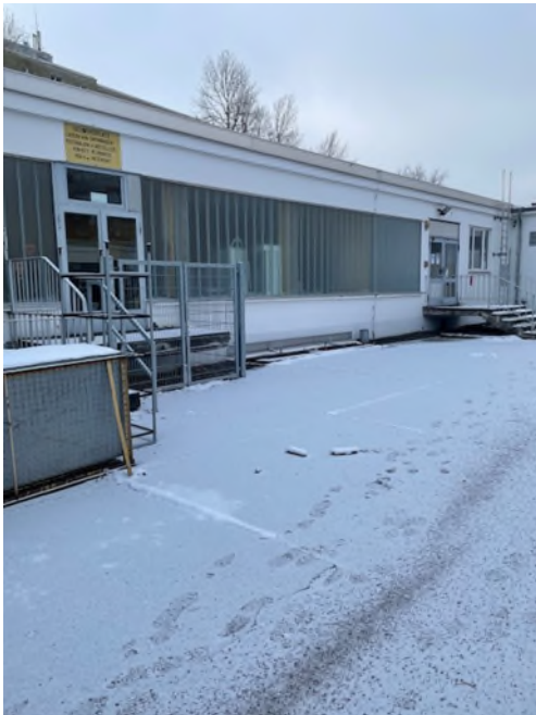
Abbildung 1-Gebäude K18