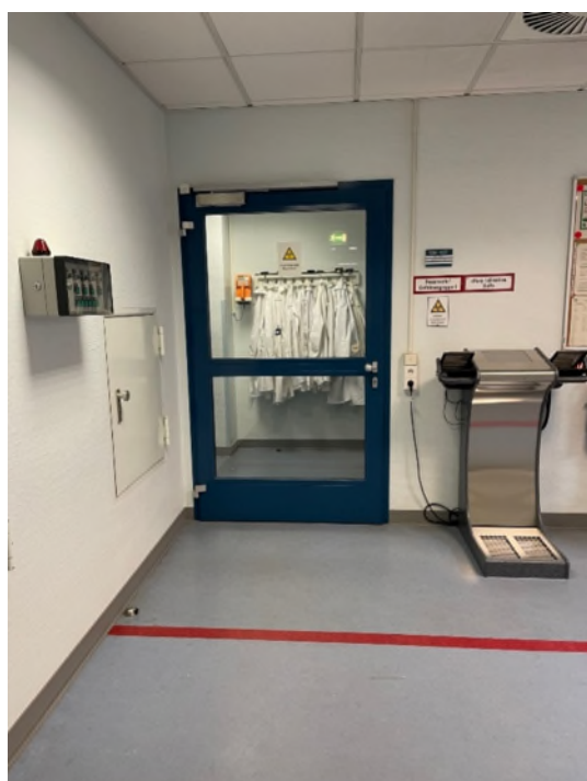
Abbildung 12-Bsp. Flur