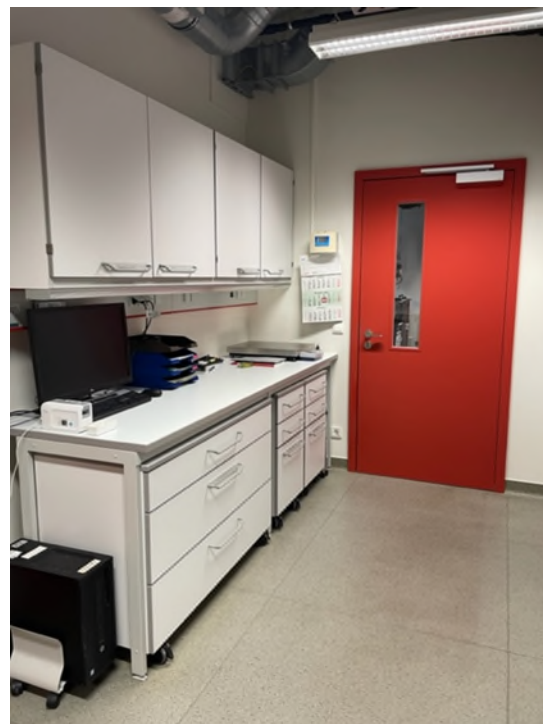
Abbildung 12-Bsp. Labor