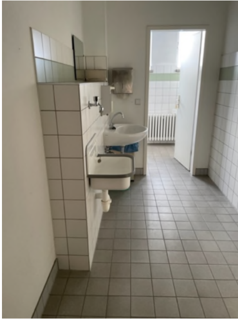
Abbildung 5-Bsp. WC-Vorraum