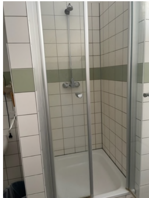
Abbildung 6-Bsp. Dusche