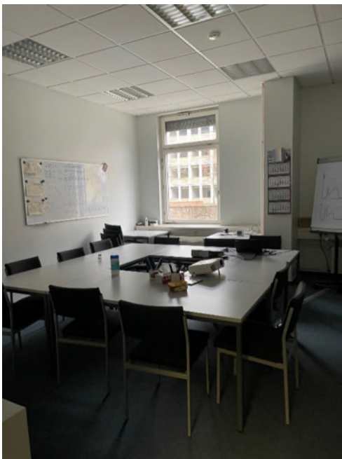
Abbildung 9-Bsp. Besprechungsraum