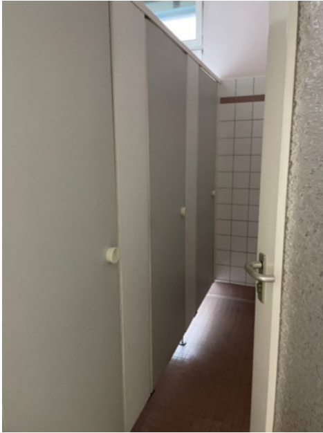
Abbildung 8-Bsp. WC-Raum