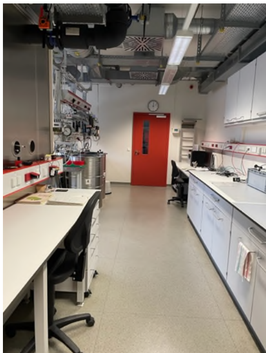
Abbildung 11-Bsp. Labor