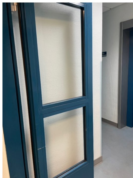
Abbildung 13-Bsp. Flur-Tür