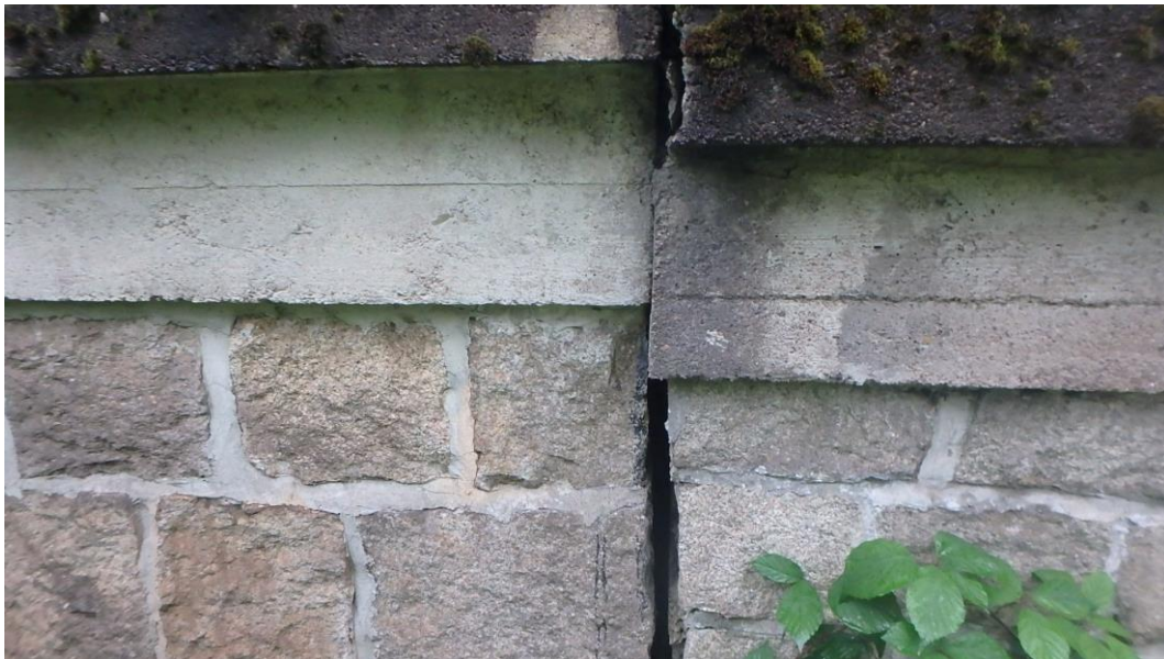
Fuge zwischen Überbau und Flügel (unterstrom rechts)