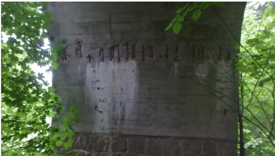
Pfeiler 2 mit freiliegender Bewehrung und Aussinterungen (oberstrom links)