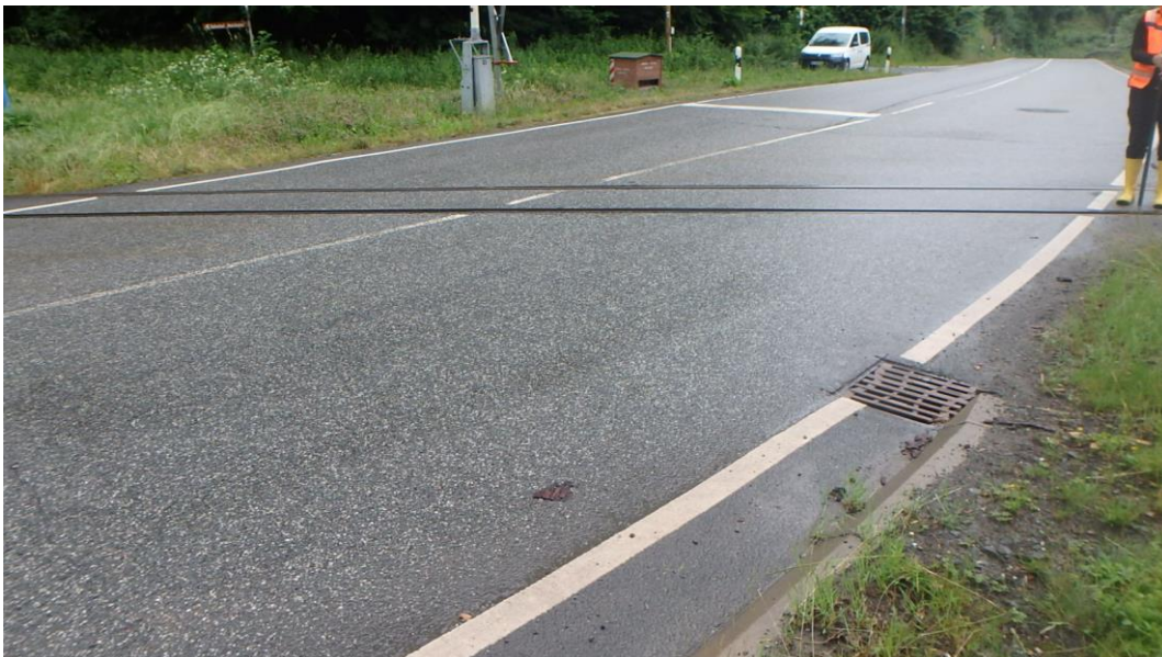
Kreuzung B4 (nördlich vom Bauwerk)