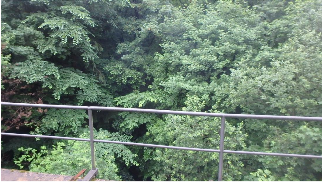
Blick in Richtung oberstrom