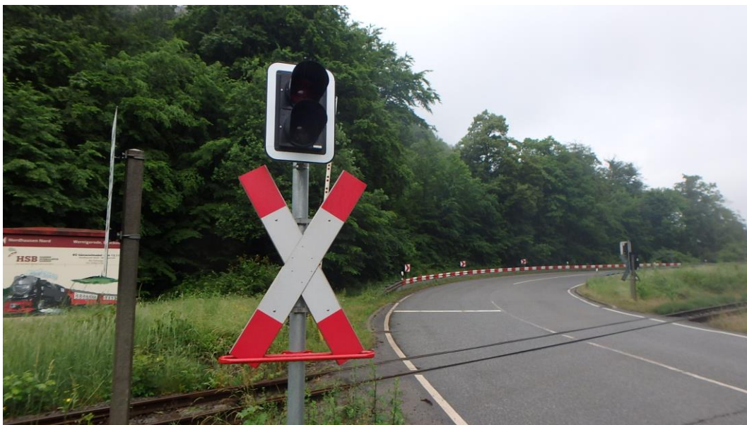
Kreuzung B4 (nördlich vom Bauwerk)