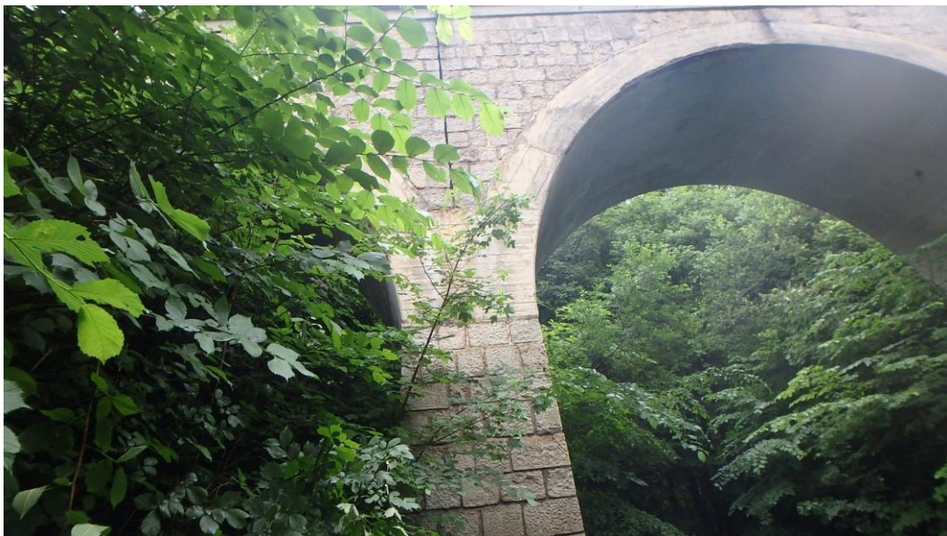
Seitenansicht Bogen 1 und 2 (unterstrom links)