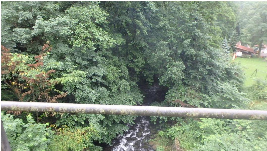
Blick in Richtung unterstrom