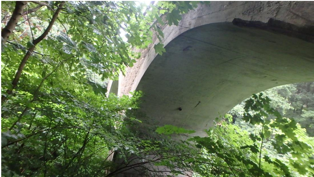
Seitenansicht Bogen 1 (oberstrom rechts)