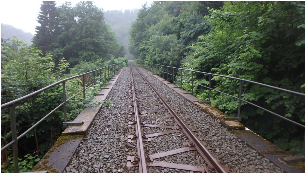
Blick über das Bauwerk in Richtung Nordhausen