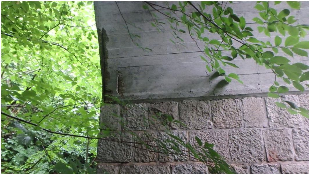
Stirnseite Pfeiler 1 (oberstrom rechts)