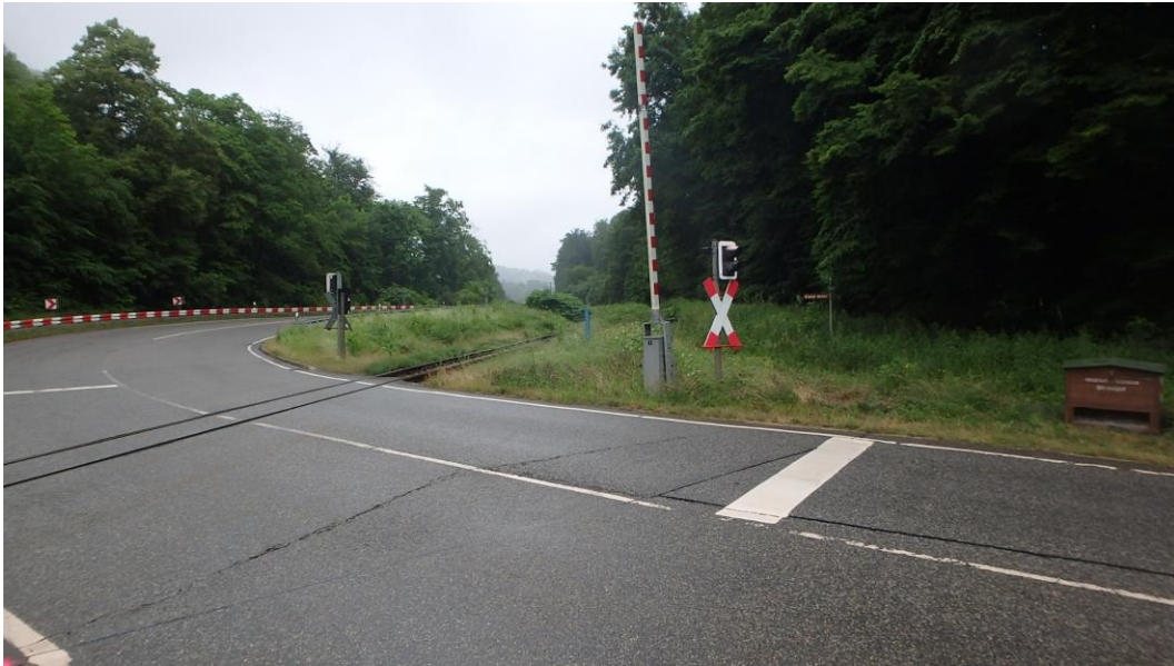
Kreuzung B4 (nördlich vom Bauwerk)