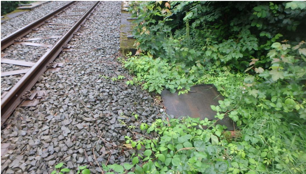
Schacht vor dem Bauwerk