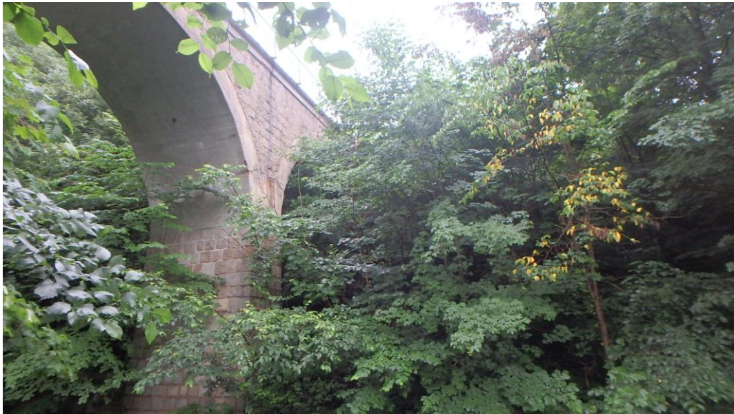
Seitenansicht Bogen 2 und 3 (unterstrom rechts)