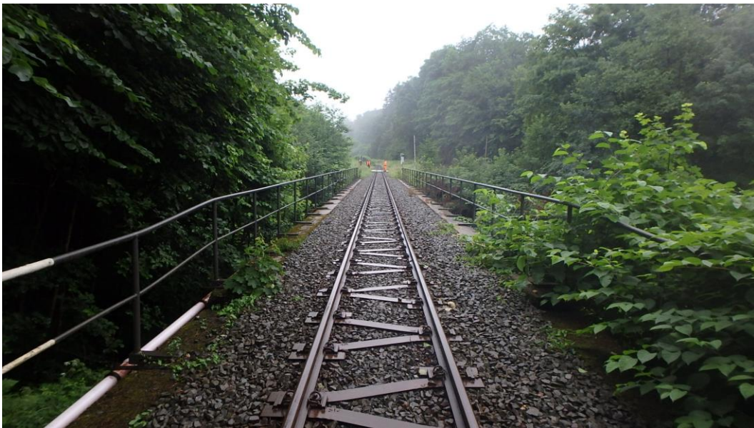
Blick über das Bauwerk in Richtung Wernigerode