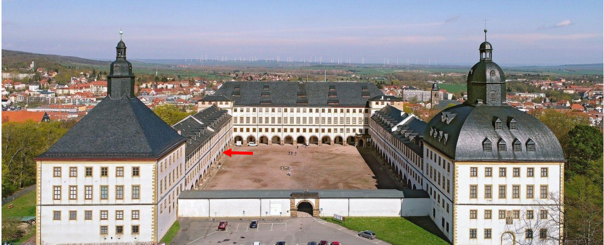
Abbildung 1. Luftbild. Westflügel links.