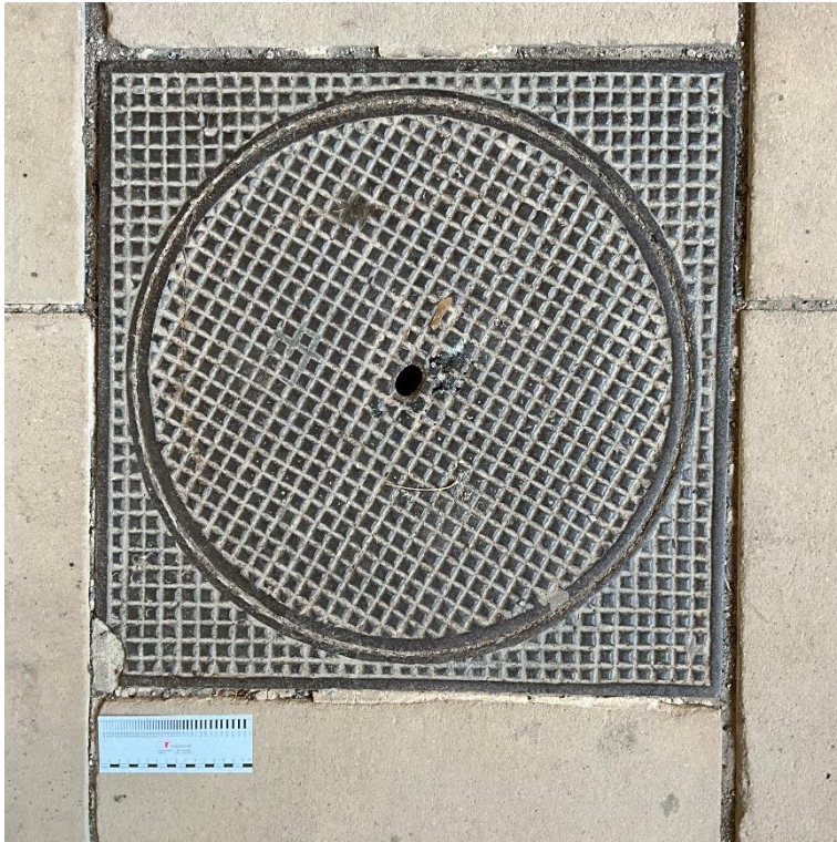
Abbildung 14: Schachtdeckel exemplarisch. Im Plattenbelag eingelassene Schachtdeckel und Wasserablaufgitter sind zu erhalten und zu schützen.