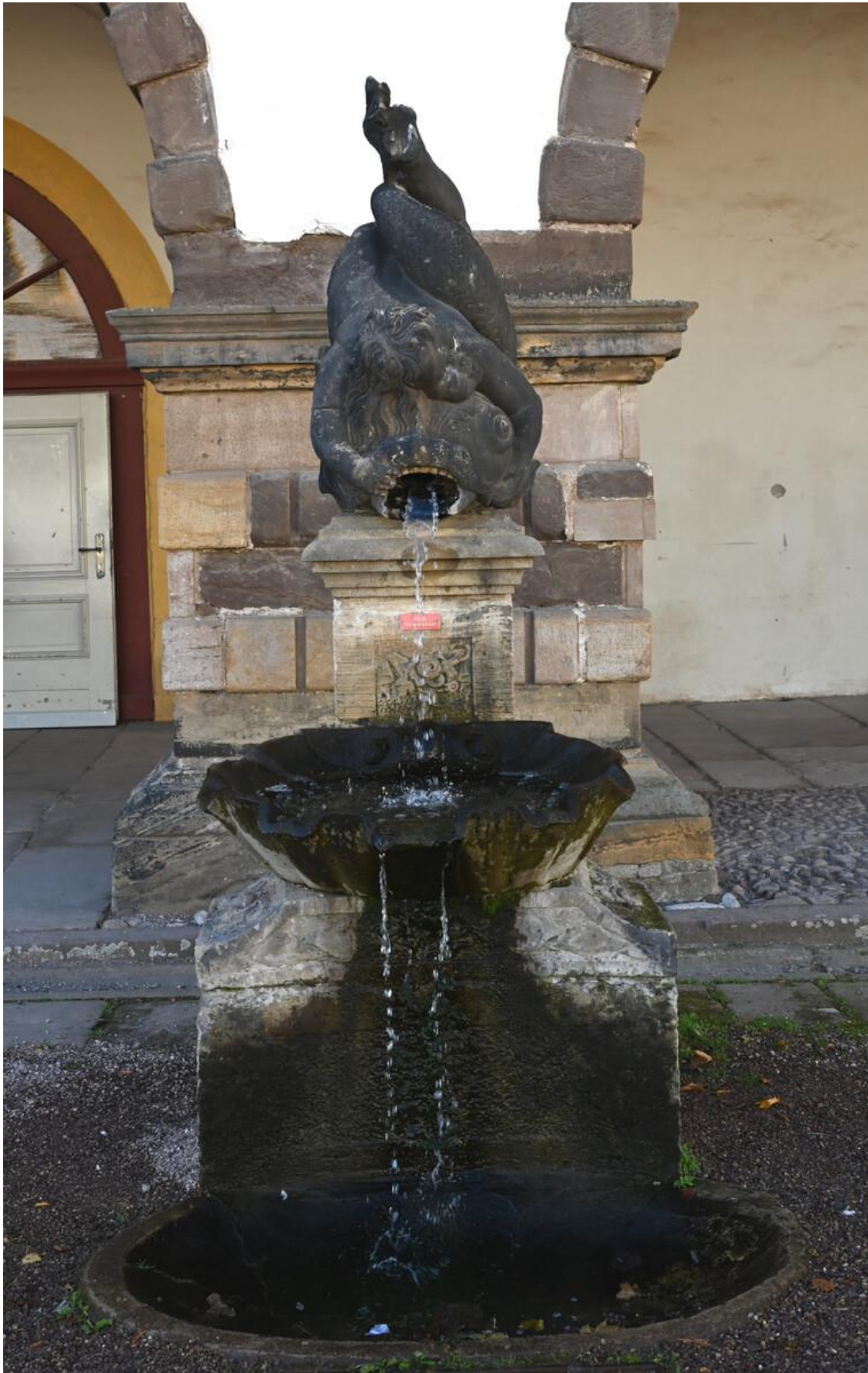
Abbildung 20: Brunnen Westflügel.