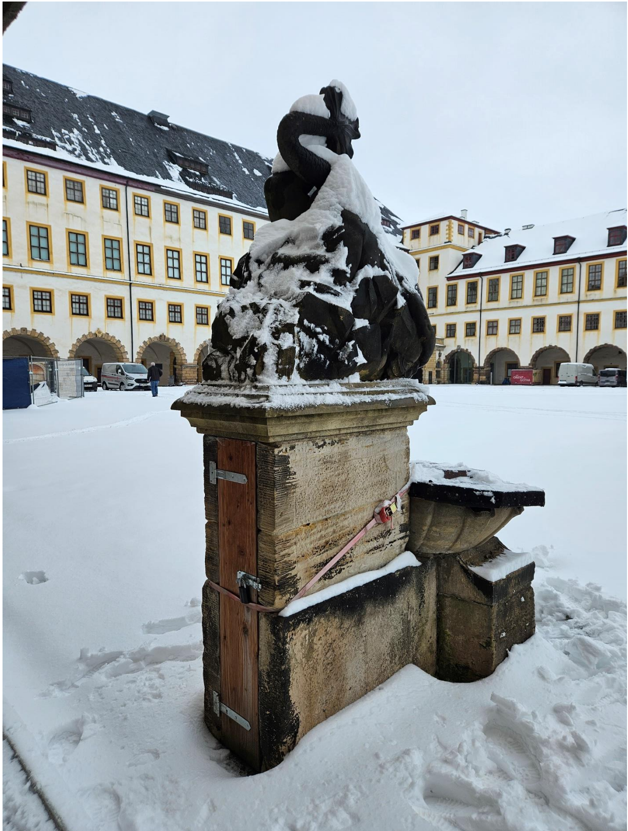
Abbildung 22: Rückseite mit Pumpenraum.