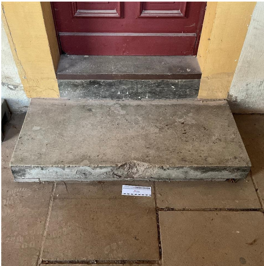
Abbildung 17: Trittstufe aus Beton, die Stufe ist rückzubauen und beim Wiedereinbau des Bodens durch eine passende Stufe aus Sandstein zu ersetzen.