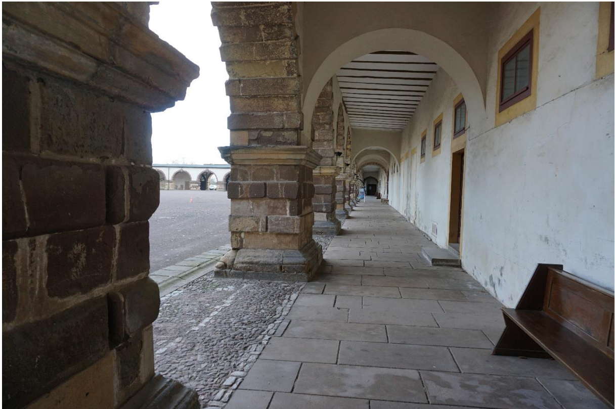
Abbildung 5: Detailaufnahme zum Arkadengang, Blickrichtung Süden.