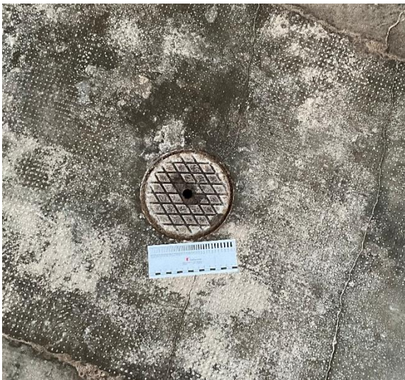
Abbildung 11: exemplarische Aufnahme, Schachtdeckel im Bereich des Estrichbelags sind zu erhalten und zu schützen.