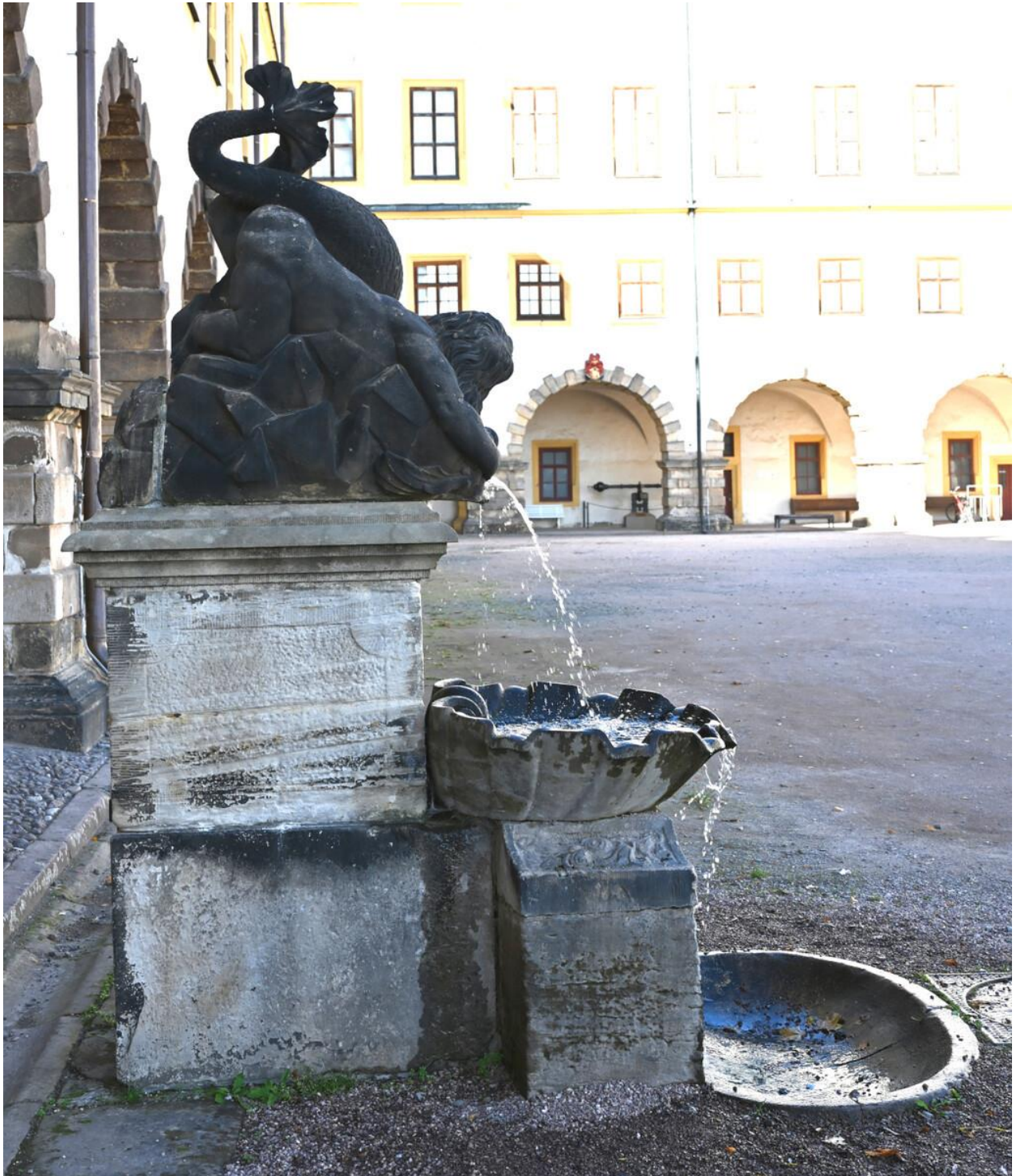
Abbildung 21: Brunnen Westflügel.