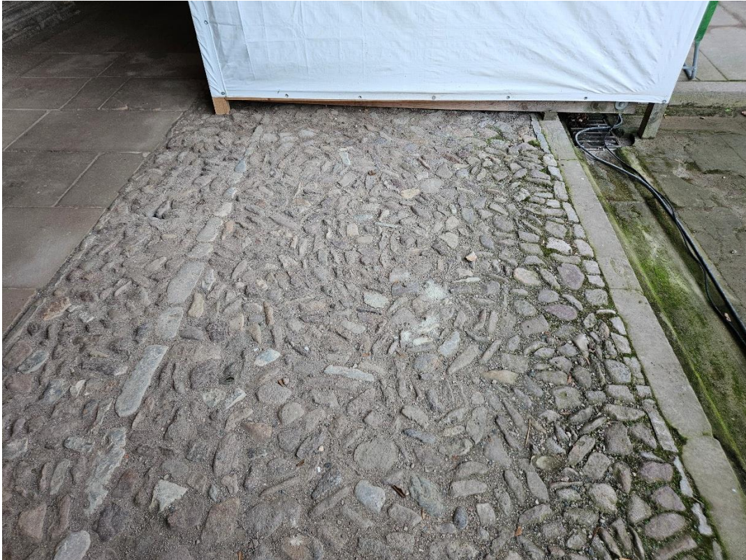
Abbildung 11: Übersichtsaufnahme zum Kieselpflaster zwischen den Pfeilern.