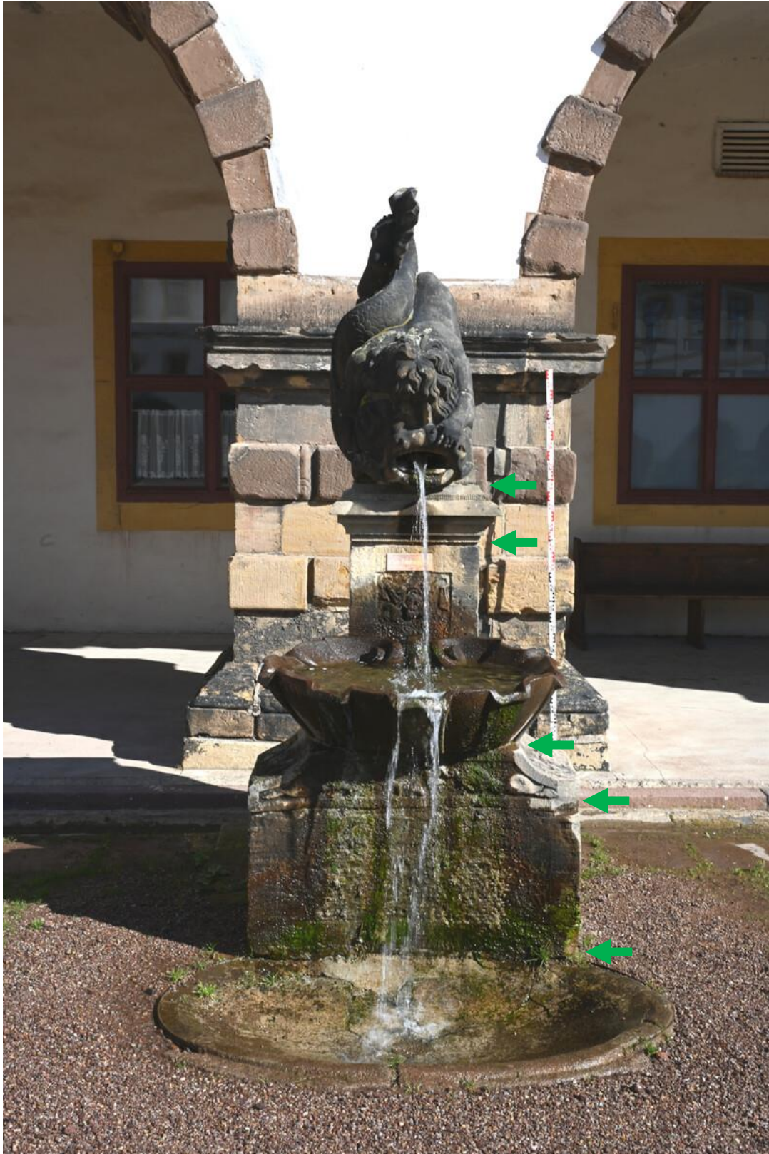
Abbildung 18: Brunnen Ostflügel mit Pfeilmarkierung Fugen. Becken gebrochen.