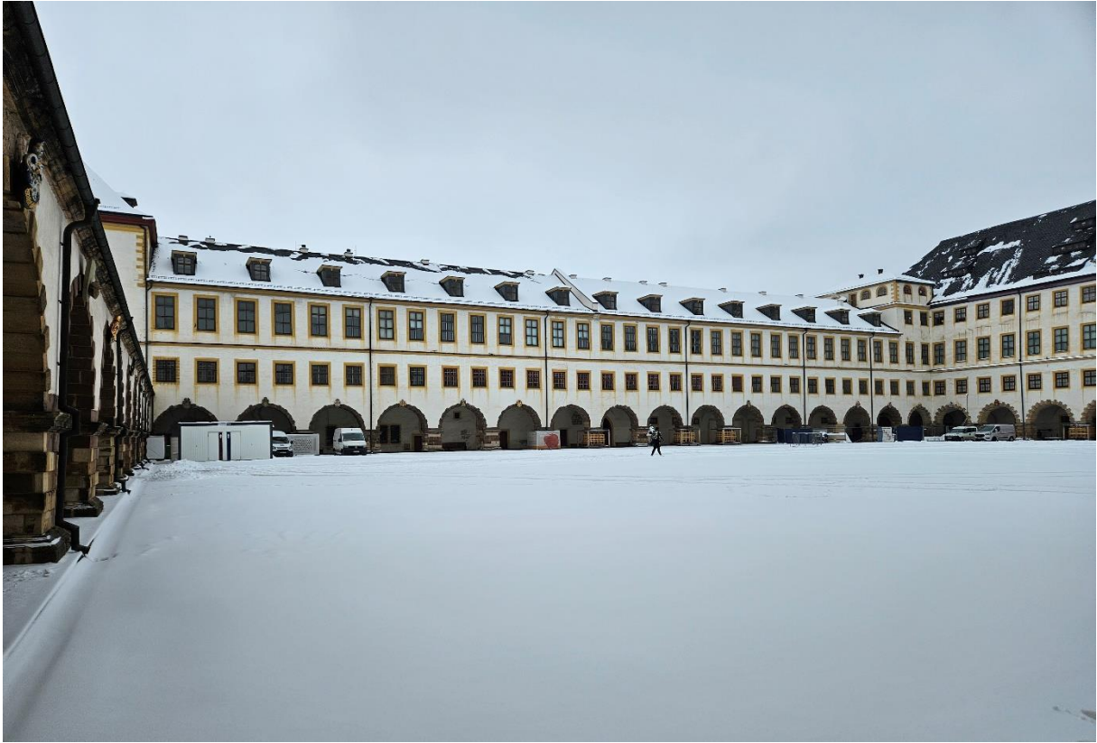
Abbildung 3: Blick auf Westflügel mit Arkaden.