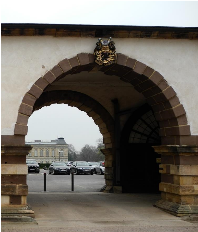
Abbildung 2: Detailaufnahme zur Hofdurchfahrt.