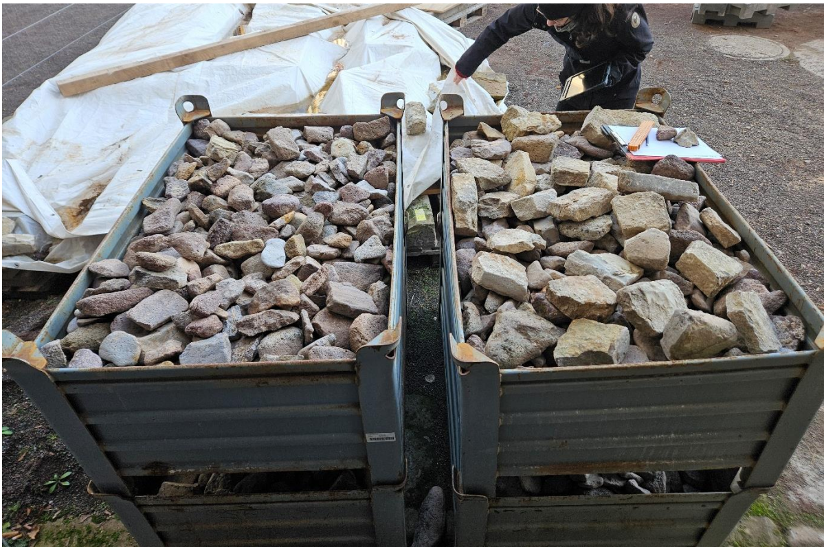
Abbildung 8: Pflaster, in Stapelboxen gelagert.