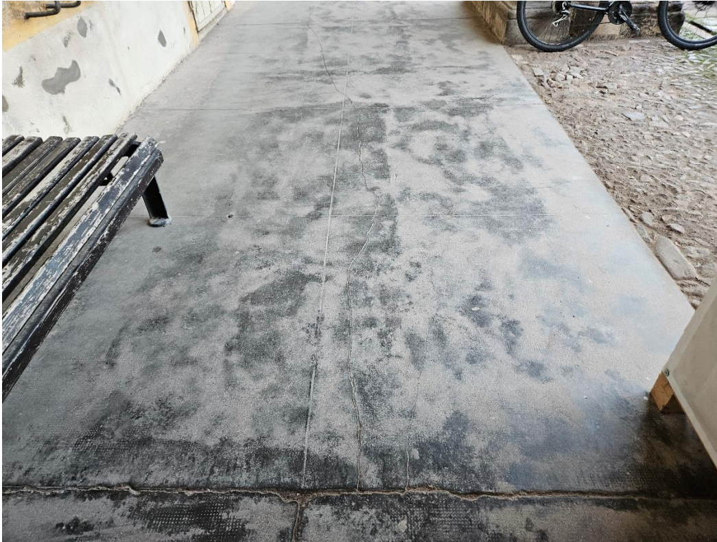
Abbildung 10: Rückzubauender und zu entsorgender Betonestrich.