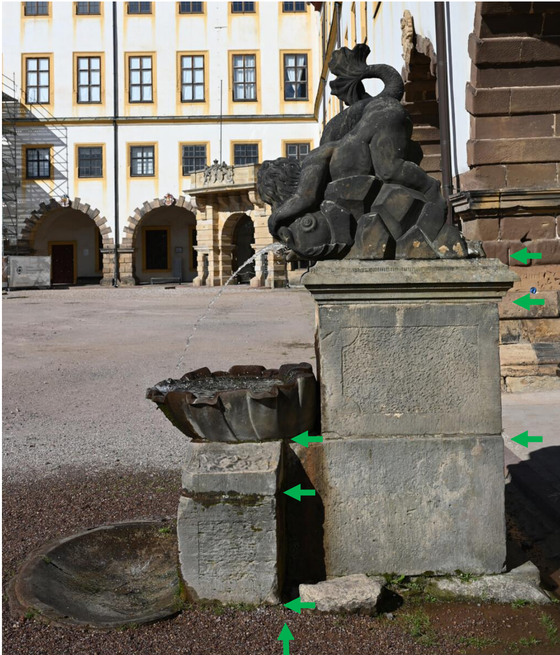
Abbildung 19: Brunnen Ostflügel mit Pfeilmarkierung Fugen.