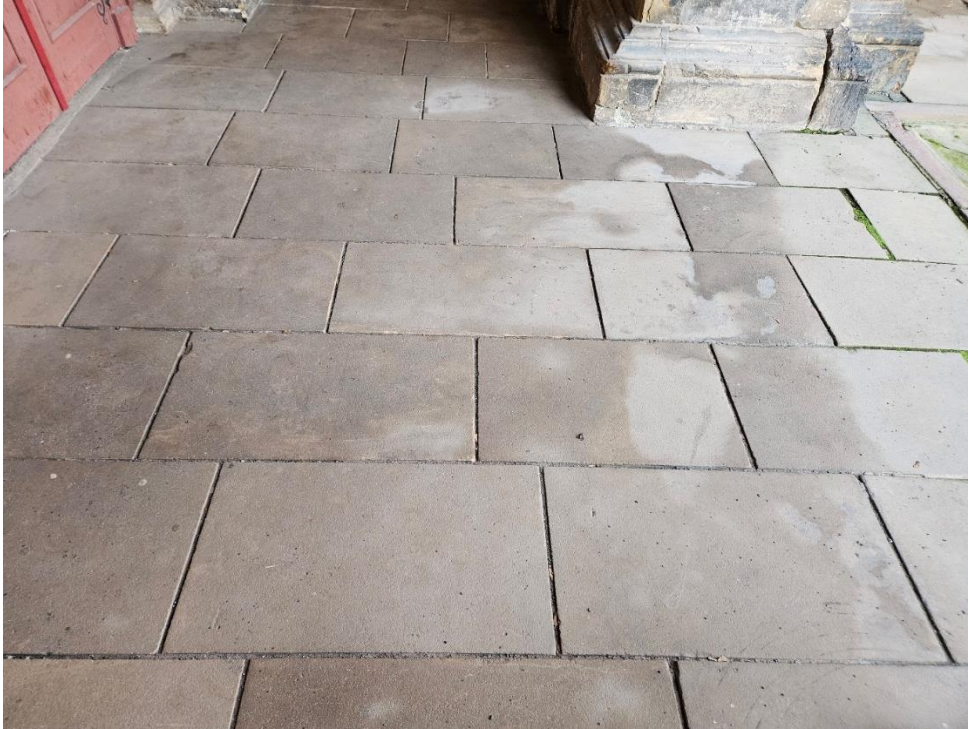
Abbildung 9: Detailaufnahme zu den neueren Sandsteinplatten.