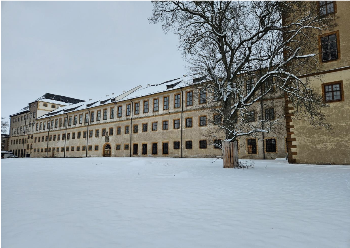
Abbildung 4: BE-Fläche im Westgarten.