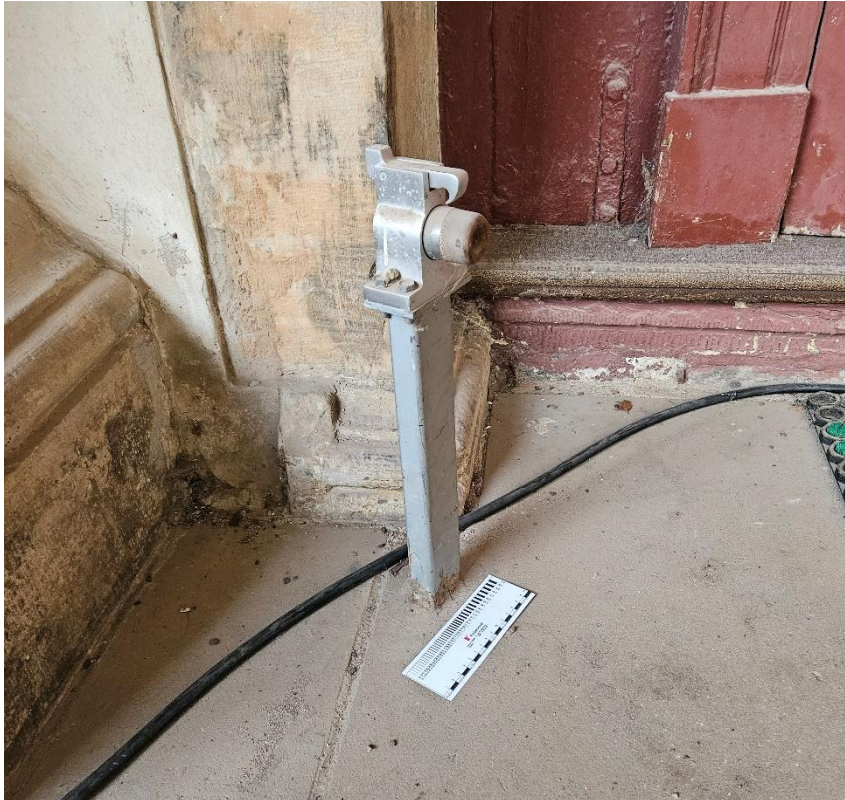
Abbildung 16: linker Türstopper exemplarisch, die beiden Metallelemente sind rückzubauen und vor dem Wiedereinbau malermäßig zu überarbeiten.