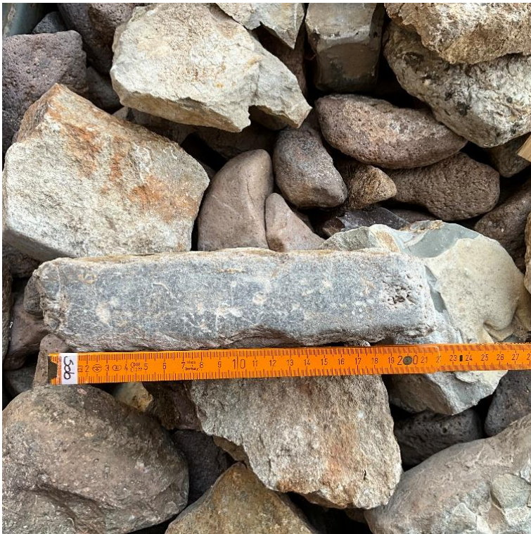
Abbildung 12: Detailaufnahme zu den weißen länglichen Randsteinen der Felder mit Kieselpflaster.