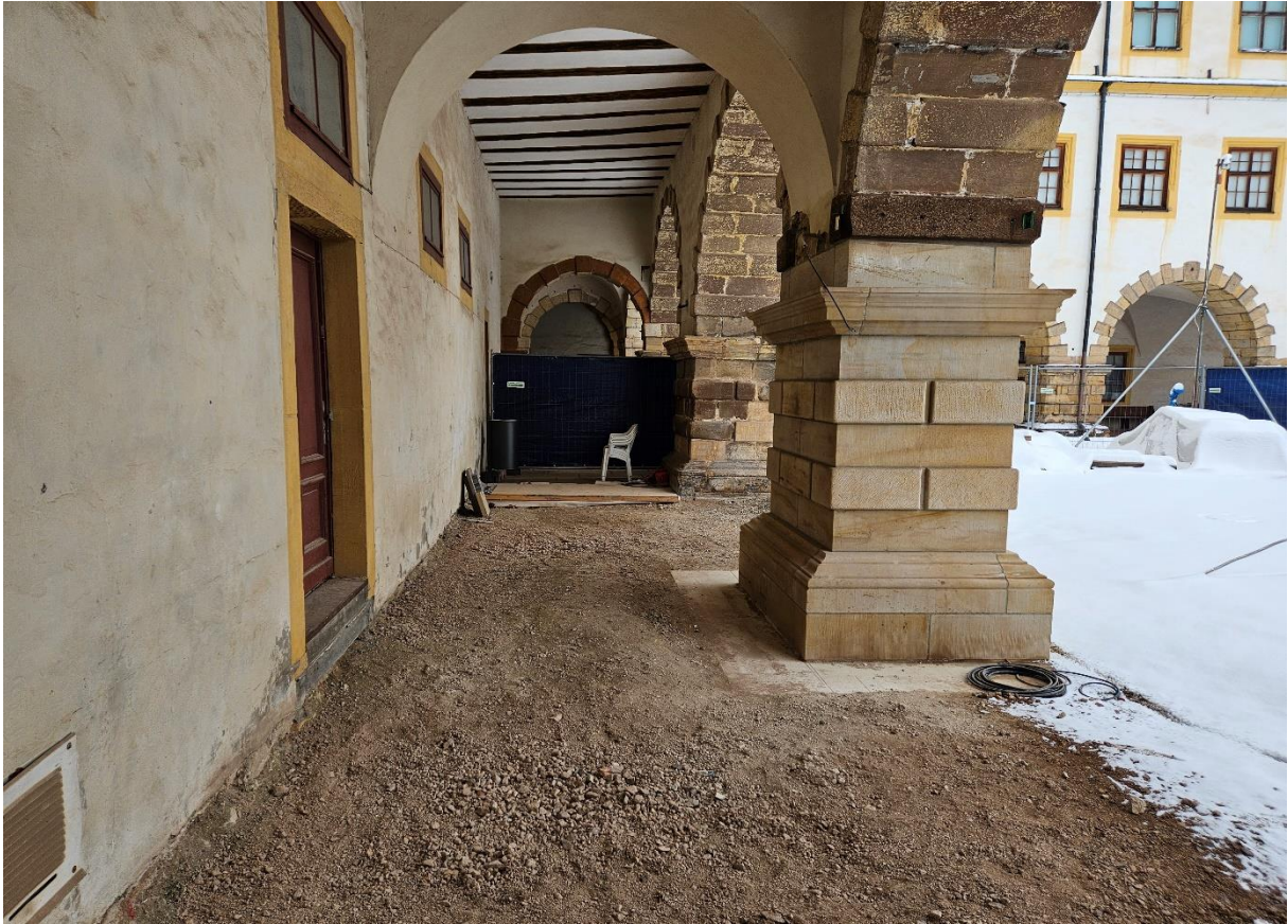
Abbildung 7: W14 nach statischer Instandsetzung und ausgebautem Boden.