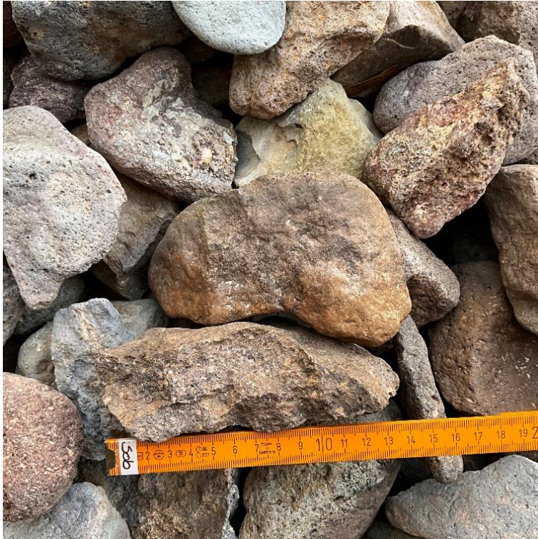
Abbildung 13: Detailaufnahme zu den roten Füllsteinen des Kieselpflasters.