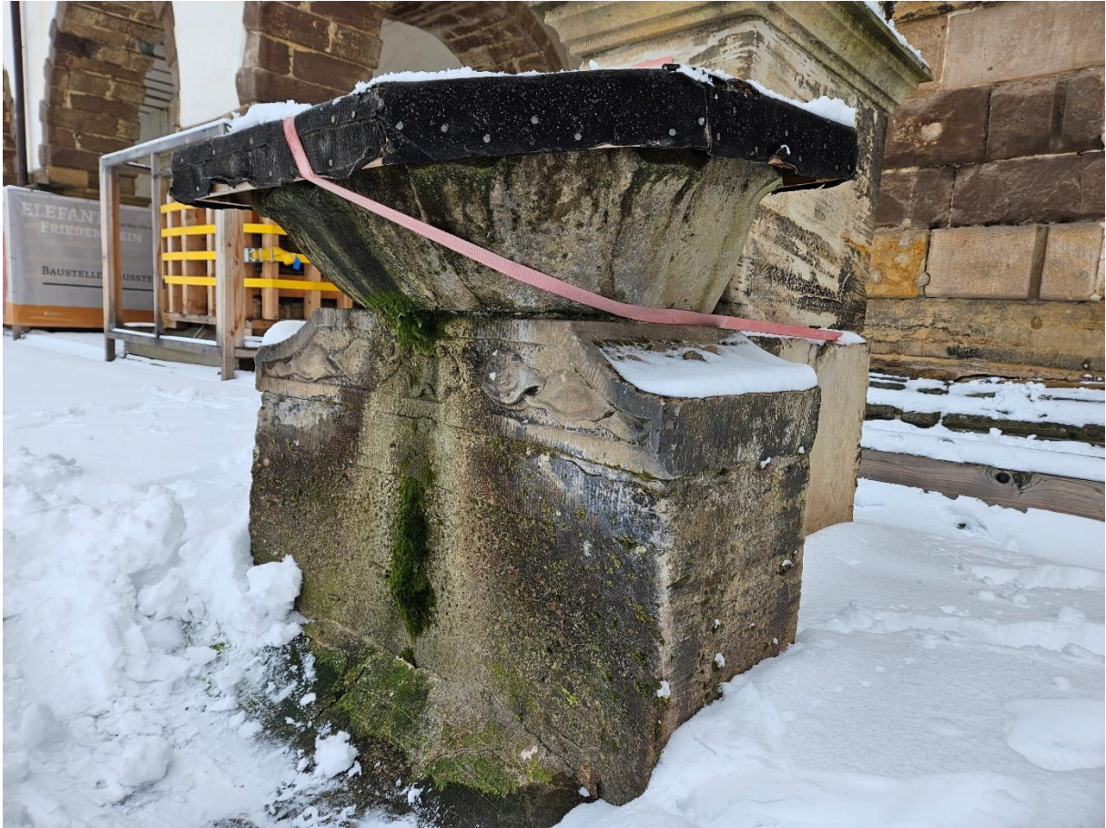
Abbildung 23: Detail Becken.