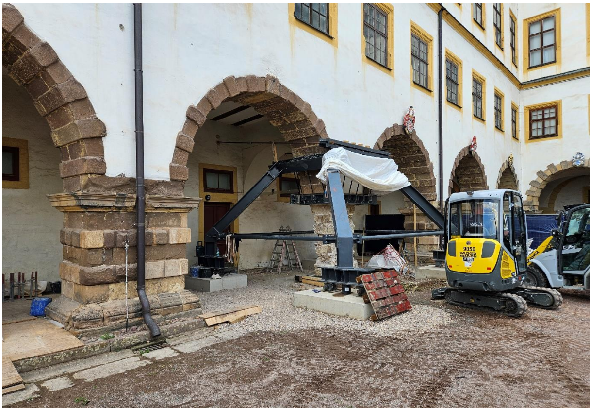
Abbildung 6: Statische Instandsetzung Musterpfeiler W14. Abfangung mit Fundamentierung.