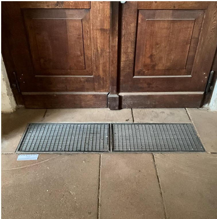
Abbildung 15: Schmutzfanggitter, die Gitterelemente sind schadensfrei auszubauen, einzulagern und bei Einbau wieder entsprechend einzusetzen.