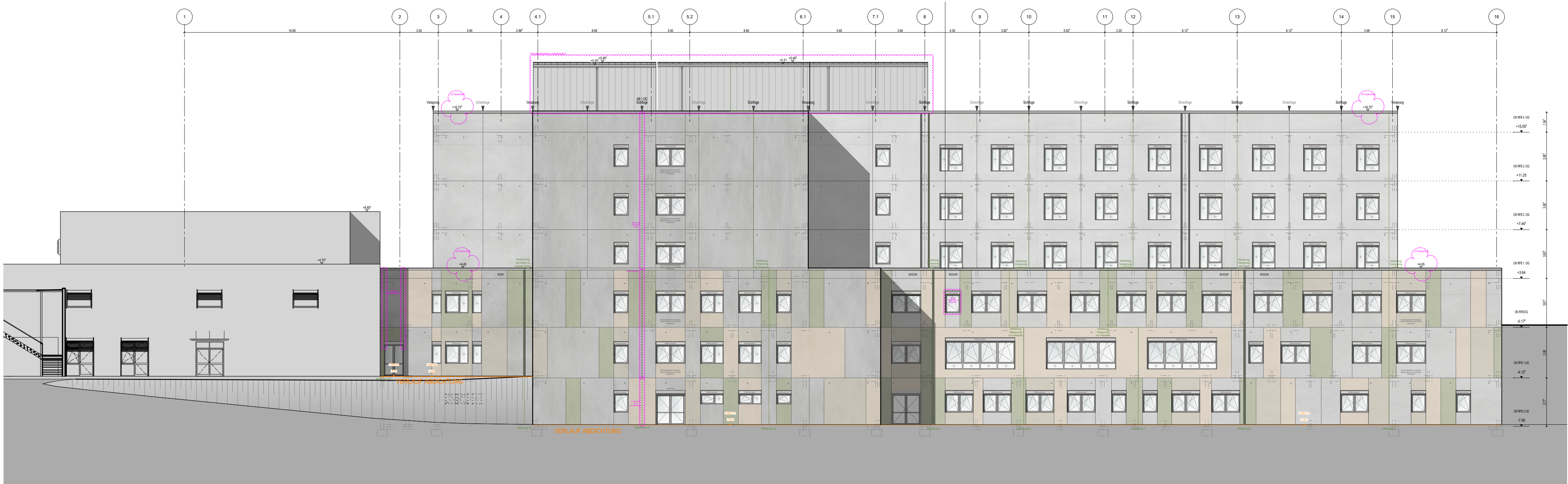
SÜDANSICHT M 1:200