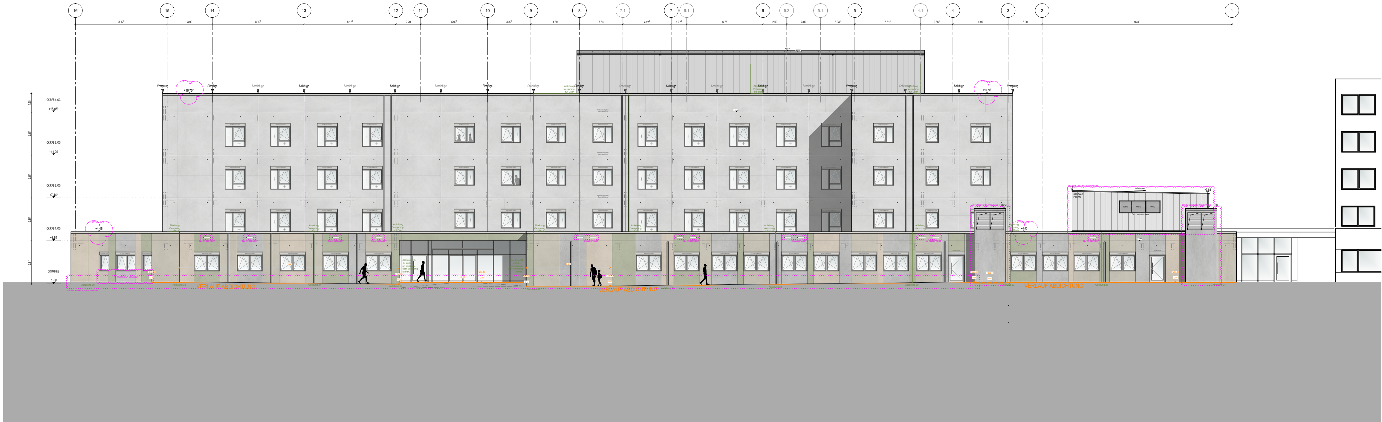
NORDANSICHT M 1:200