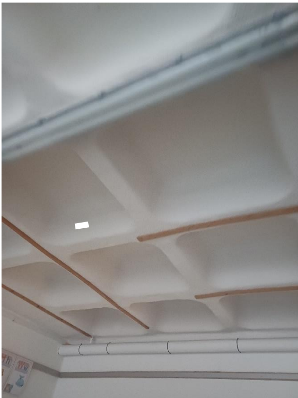
Bild 2: Deckenöffnung DÖ0.05 (keine Abhangdecke) Betonkassettendecke Raum 0.05