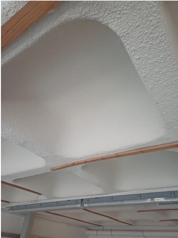
Bild 1: Deckenöffnung DÖ0.05 (keine Abhangdecke) Betonkassettendecke Raum 0.05