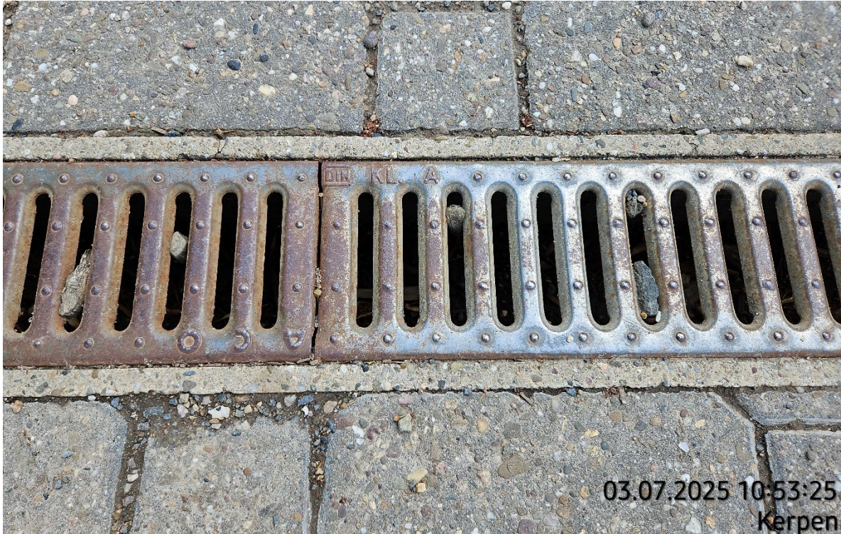
Entwässerungsrinne aufnehmen – Pos. 02.11