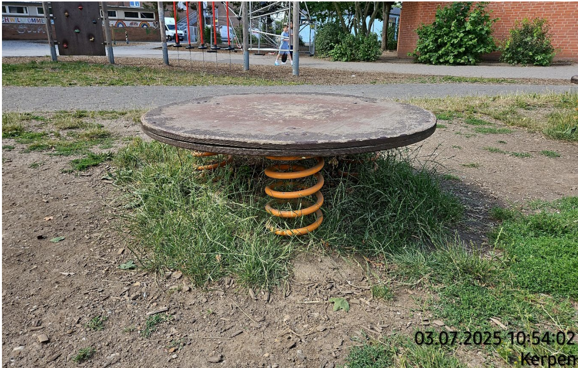
Hüpfplatte seitlich lagern – Pos. 02.27