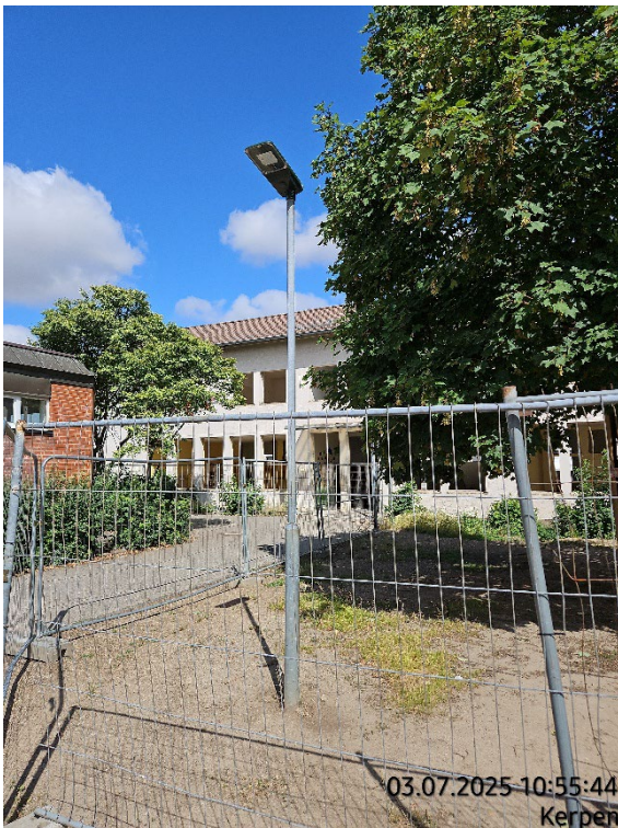
Mastleuchten aufnehmen – Pos. 02.31