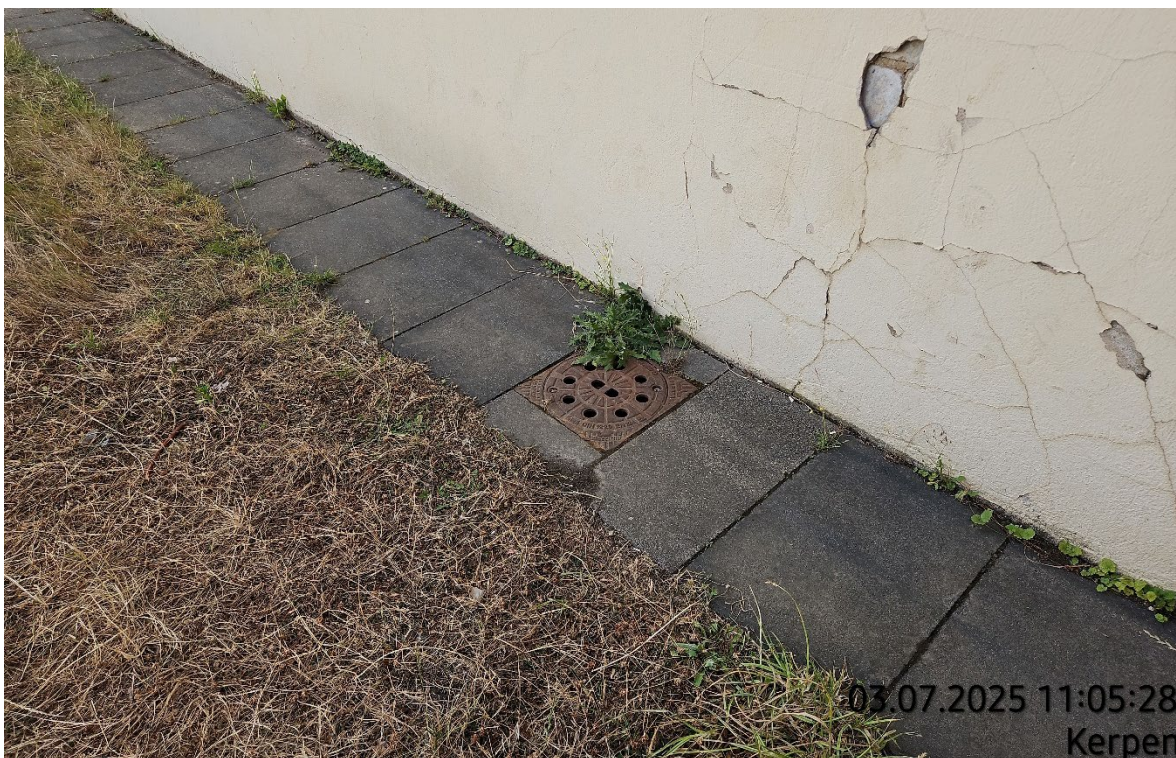
Betonsteinplatten aufnehmen – Pos. 02.05