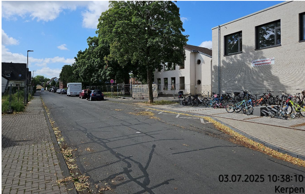
Hegelstraße (Einbahnstraße) – Blick auf Neubau (rechts) und Altbau (links, bereits abgerissen)