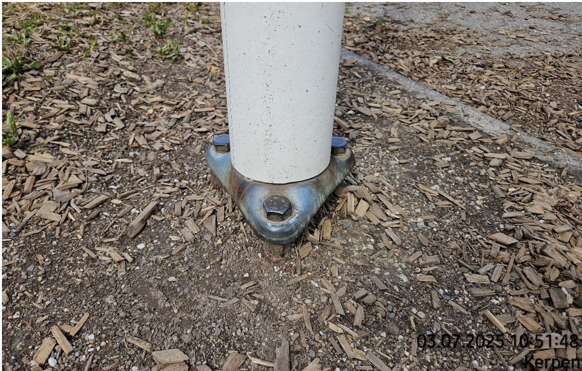
Fahnenmast seitlich lagern – Pos. 02.26