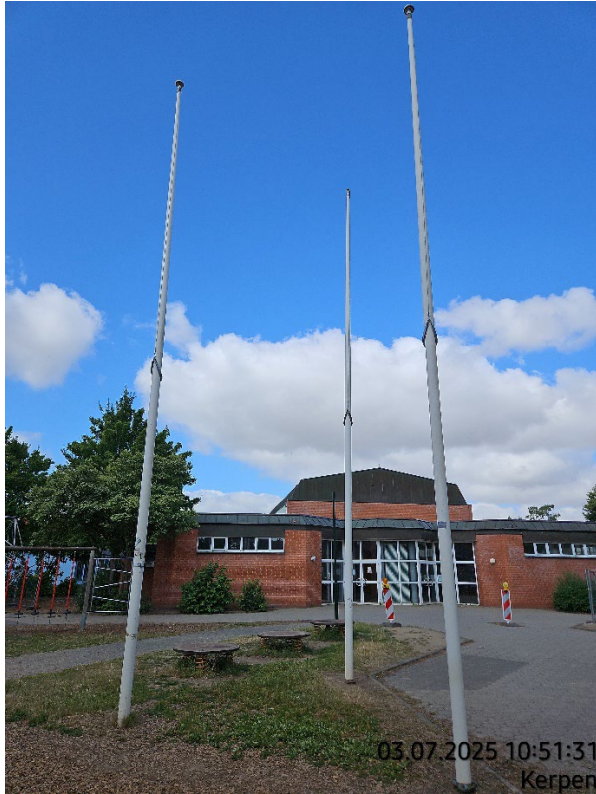
Fahnenmast seitlich lagern – Pos. 02.26