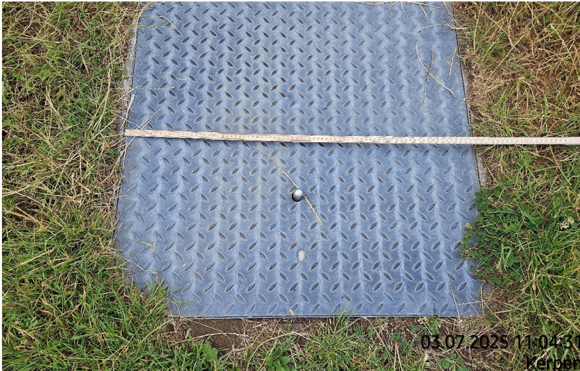
Schachtbauwerk aufnehmen – Pos. 02.13