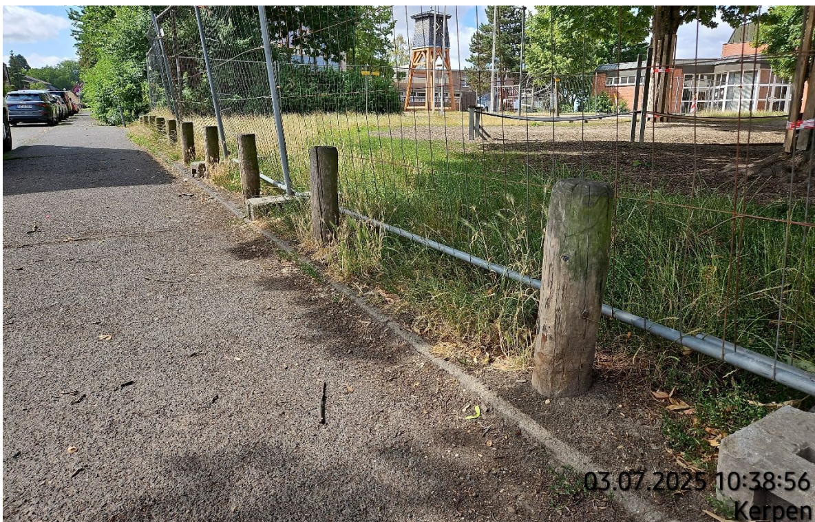
Absperrpoller aus Holz aufnehmen – Pos. 02.22