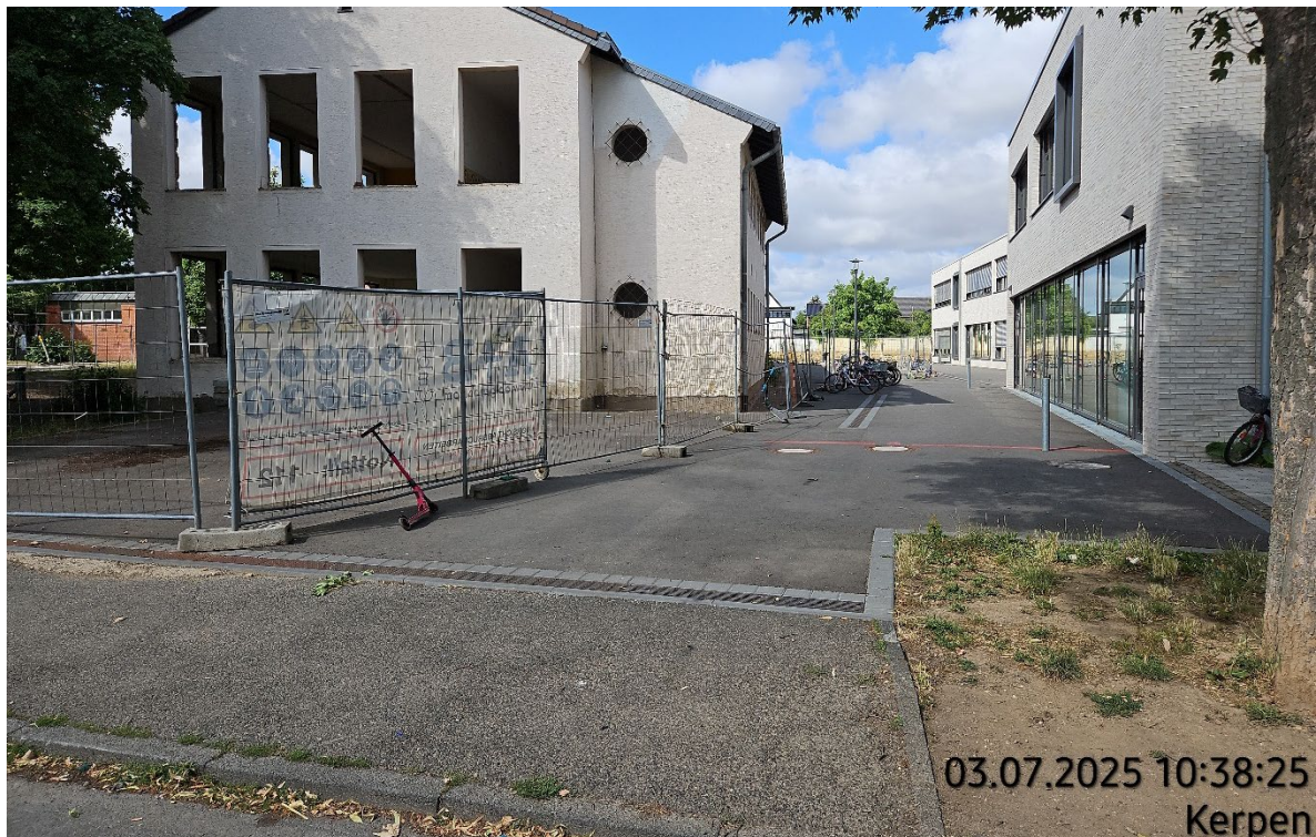
Provisorischer Schulhof + Altbau (bereits abgerissen)