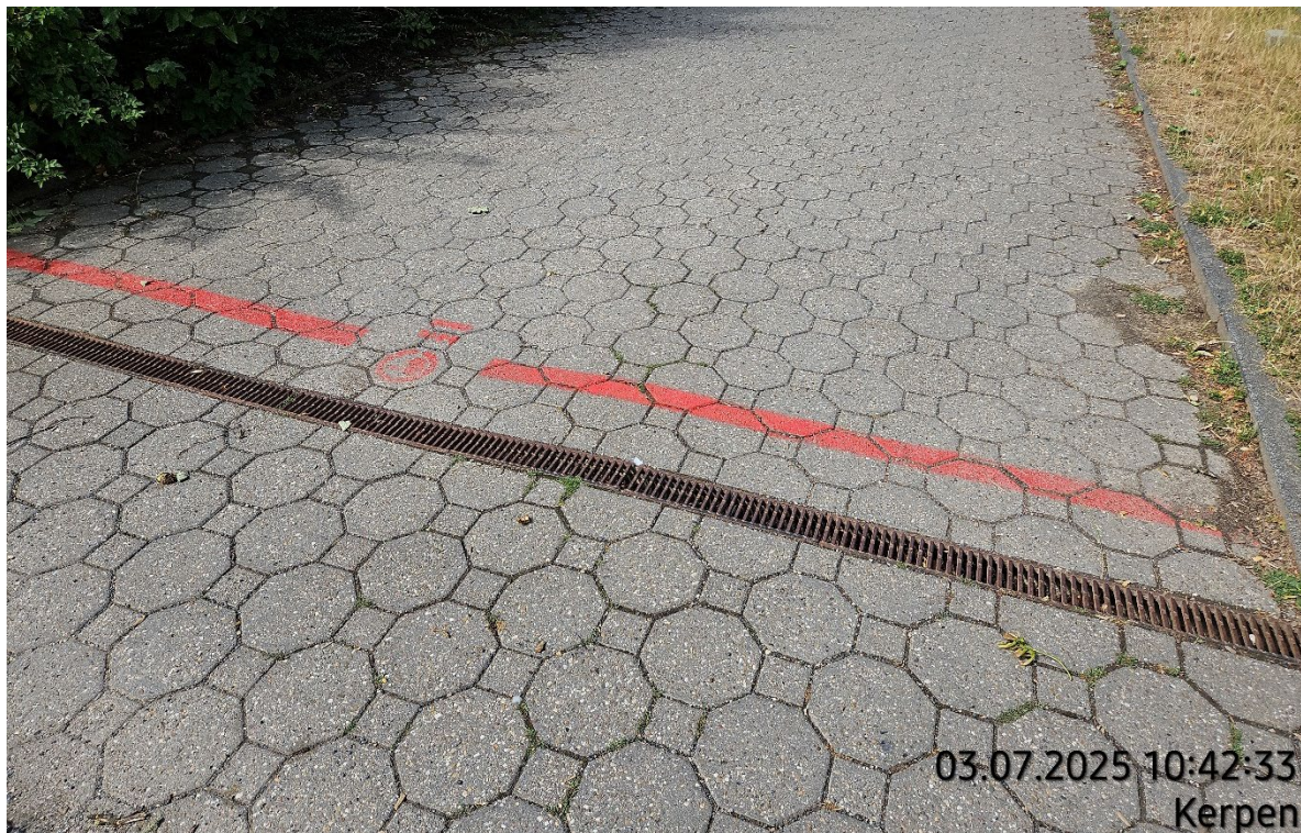
Kantenstein aufnehmen – Pos. 02.01 | Betonverbundsteinpflaster aufnehmen – Pos. 02.04