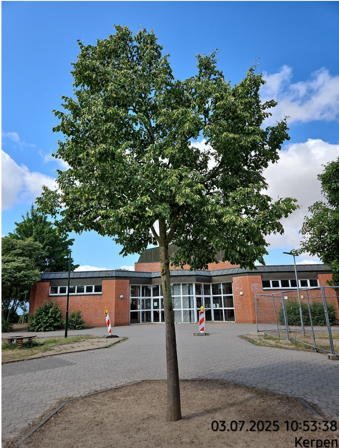
Baum roden – Pos. 02.38