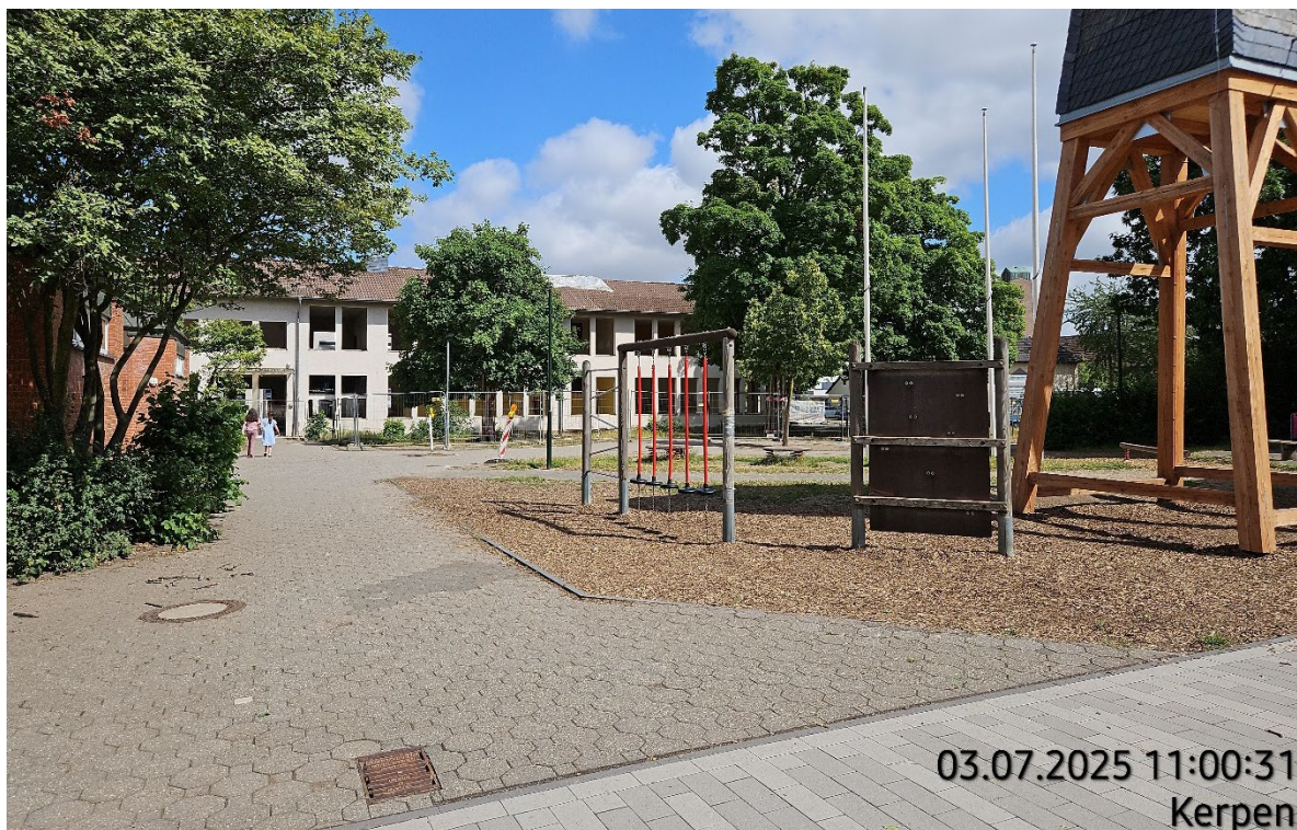
Kantenstein aufnehmen – Pos. 02.01 | Betonverbundsteinpflaster aufnehmen – Pos. 02.04