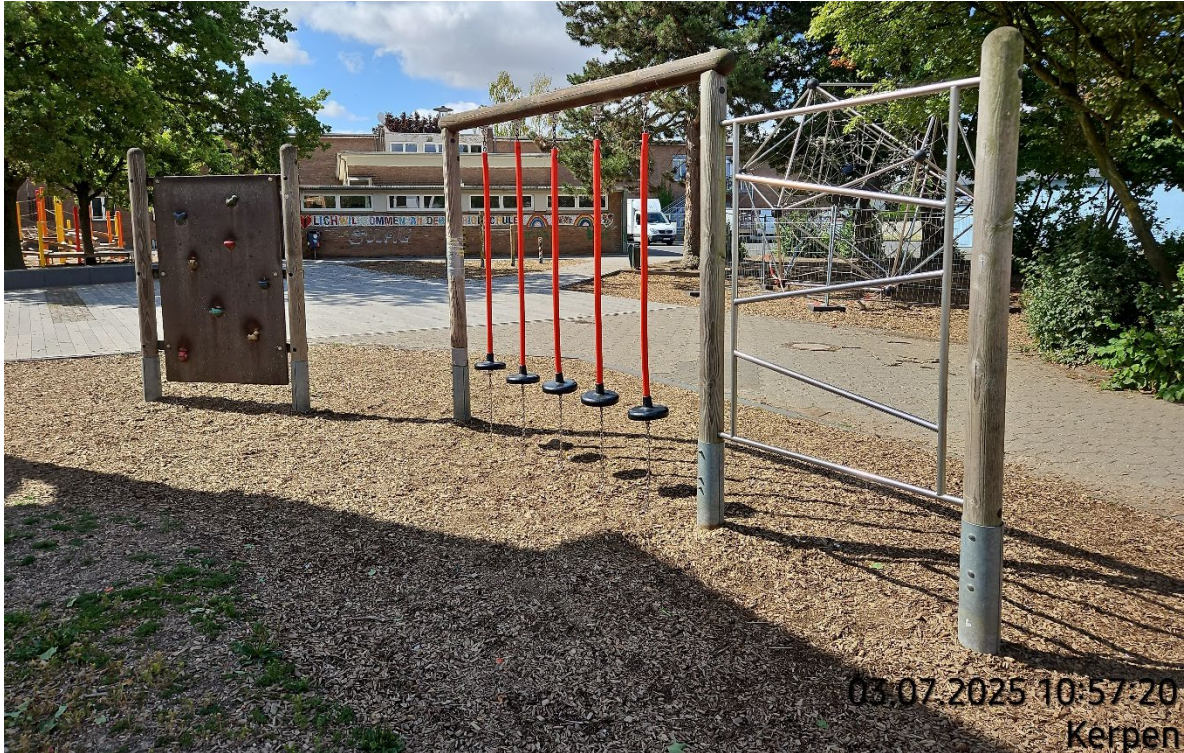
Spielkombination aufnehmen – Pos. 02.29