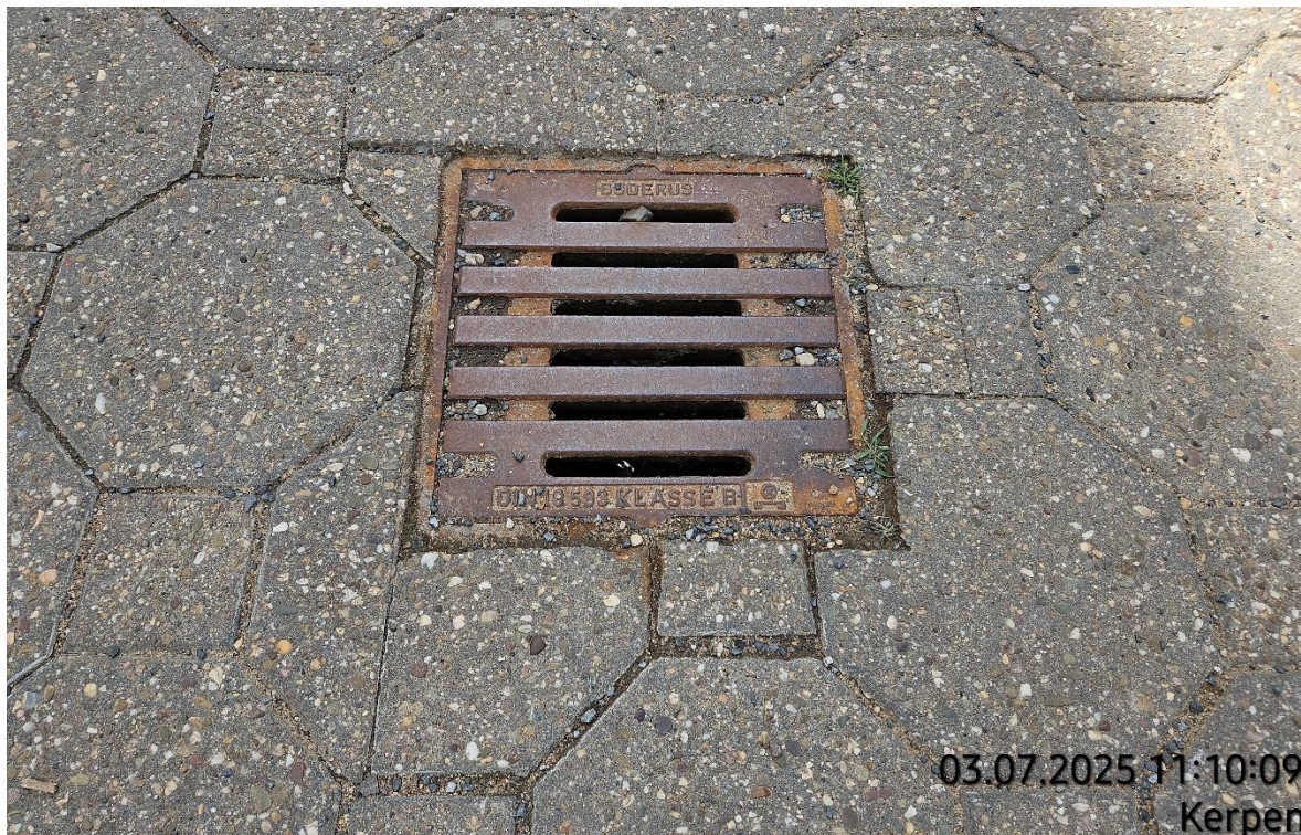
Hof- / Straßenablauf aufnehmen – Pos. 02.10