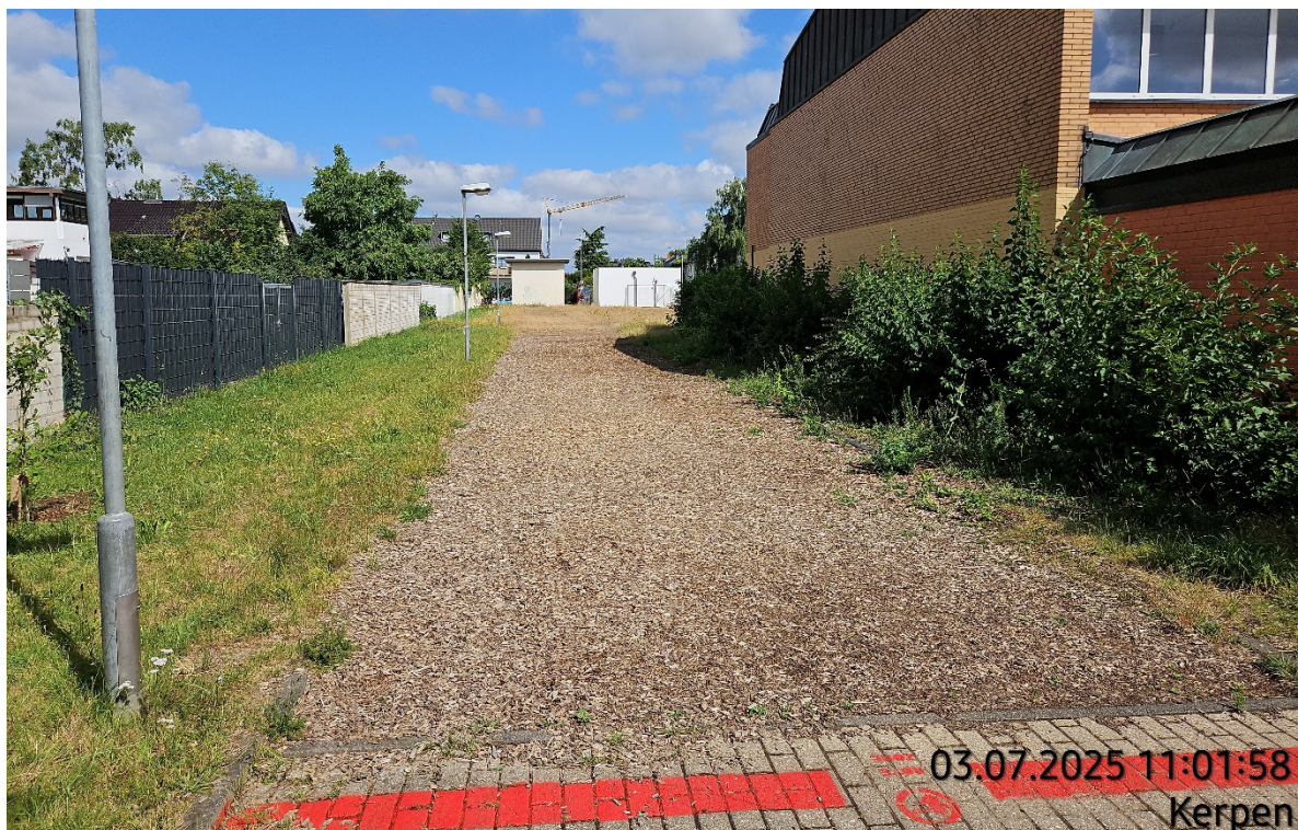
Holzackschnitzel und darunter liegender Tennenbelag aufnehmen – Pos. 02.08 und 02.09