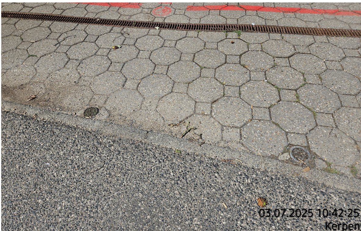
Bodenhülsen aufnehmen – Pos. 02.24