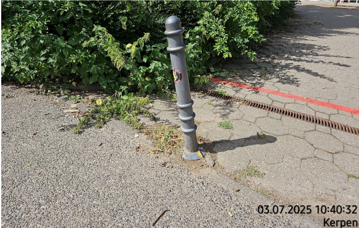
Absperrpoller aus Stahl – Pos. 02.23