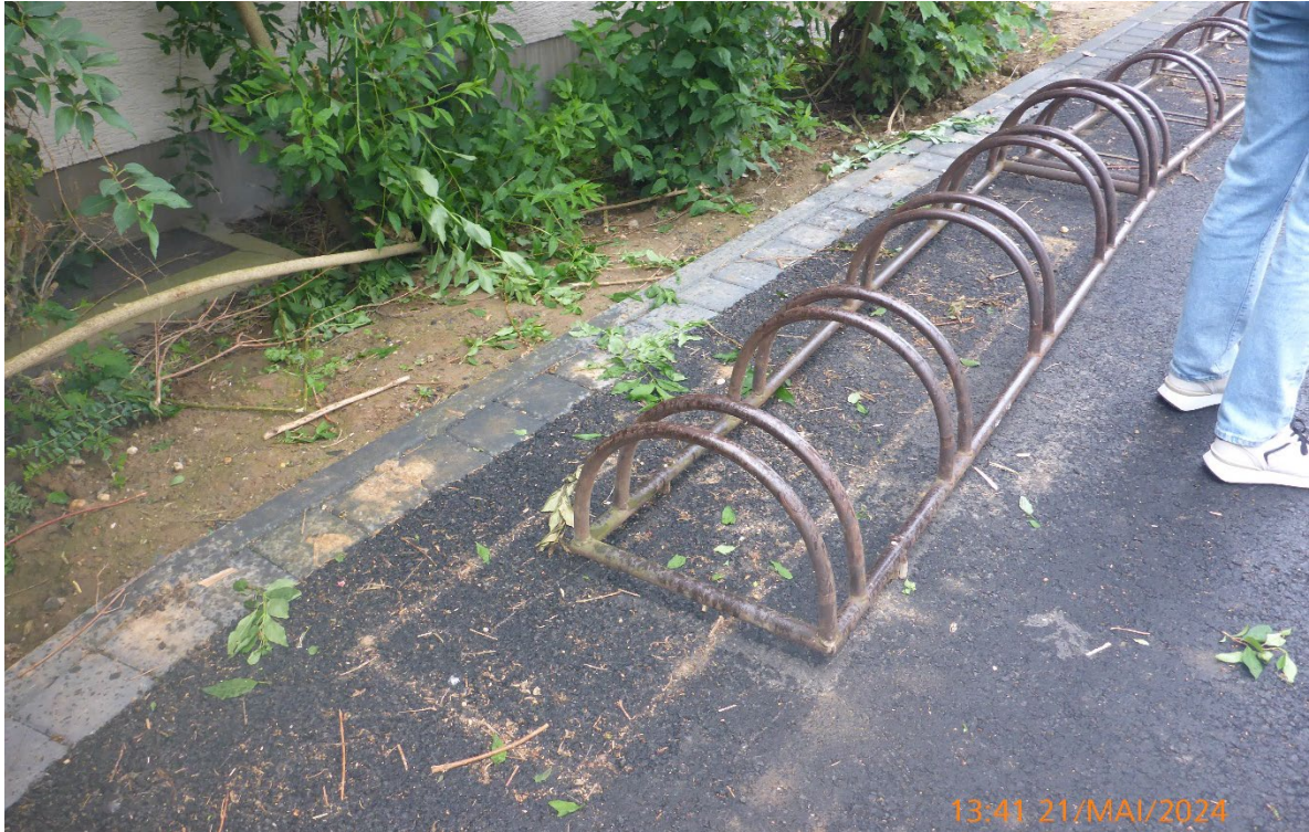
Fahrradparker aufnehmen – Pos. 02.19