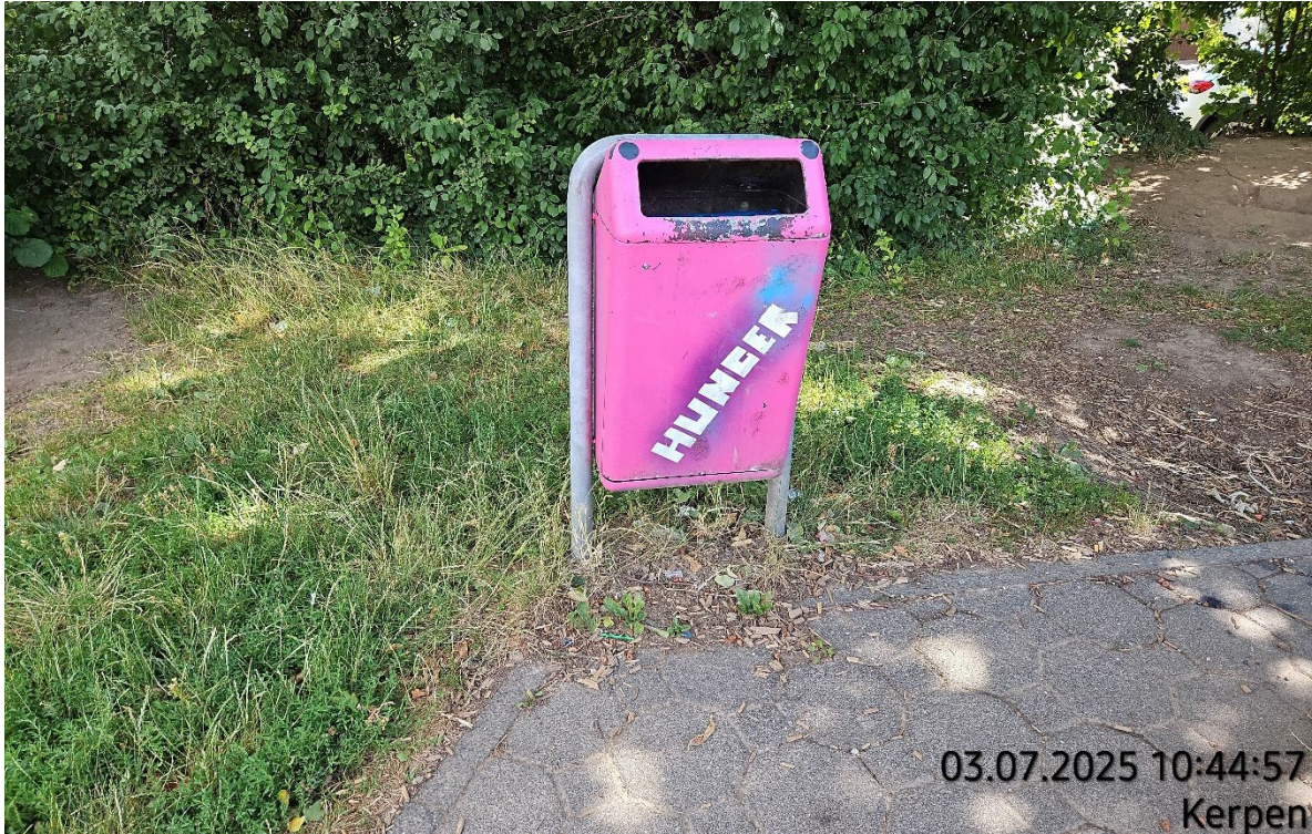
Abfallbehälter seitlich lagern – Pos. 02.17