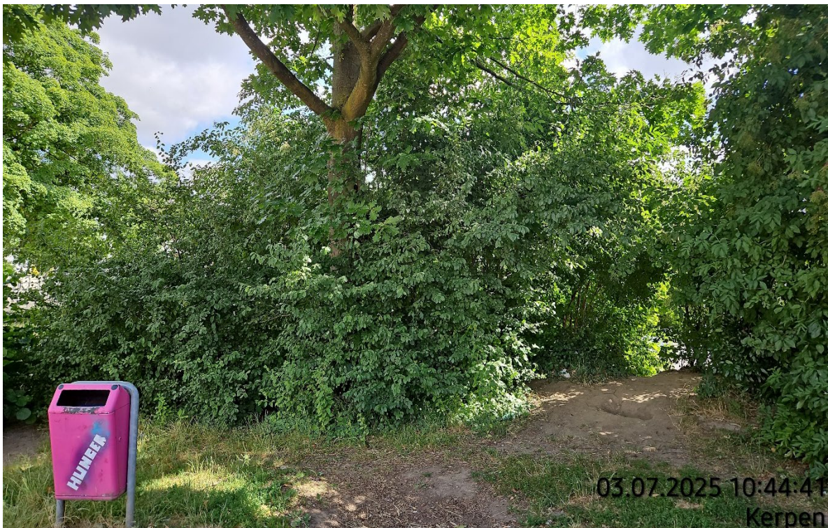
Gehölzfläche und Einzelgehölze roden – Pos. 02.34 bis 02.37