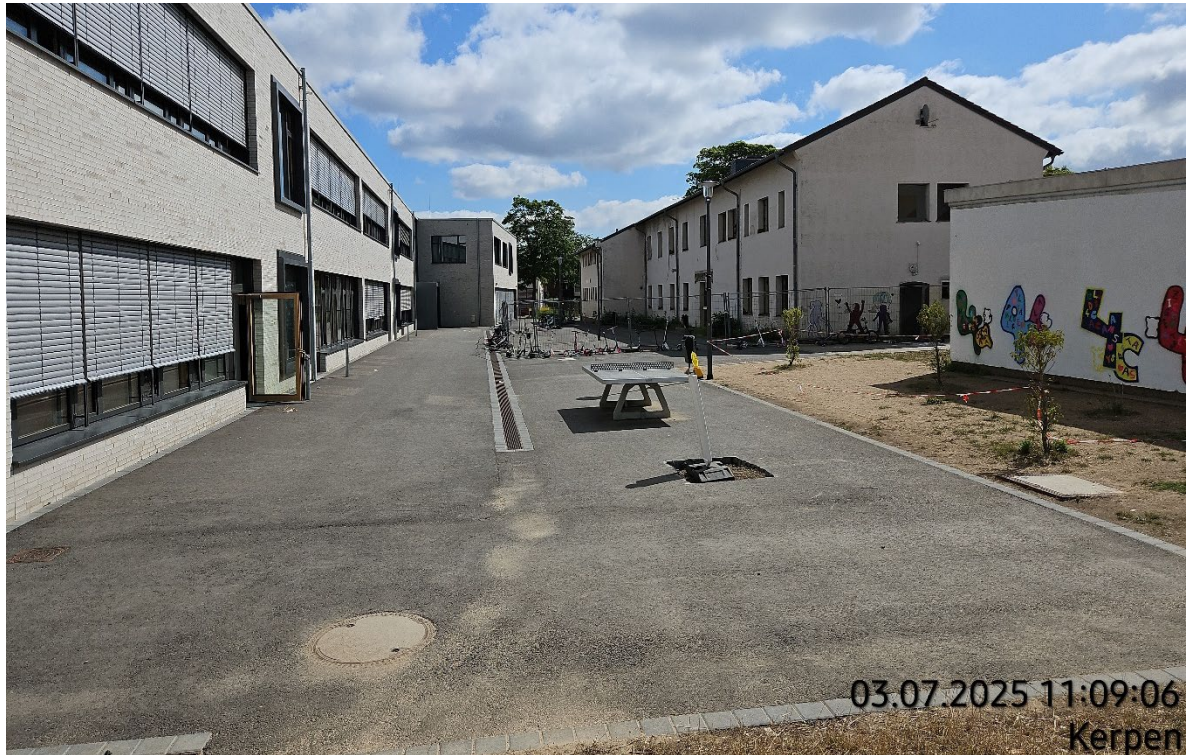
Basamentstein aufnehmen – Pos. 02.02 | Asphaltbelag aufnehmen – Pos. 02.07