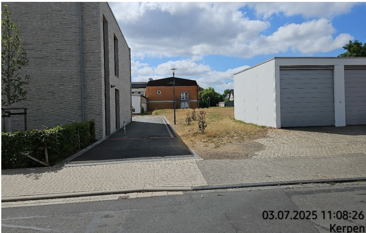
Zugang Schulhof Fuchsiusstraße