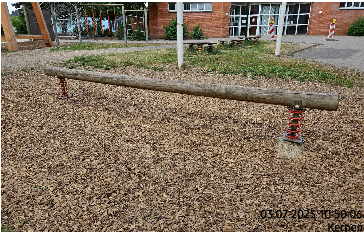
Balancierbalken aufnehmen – Pos. 02.28