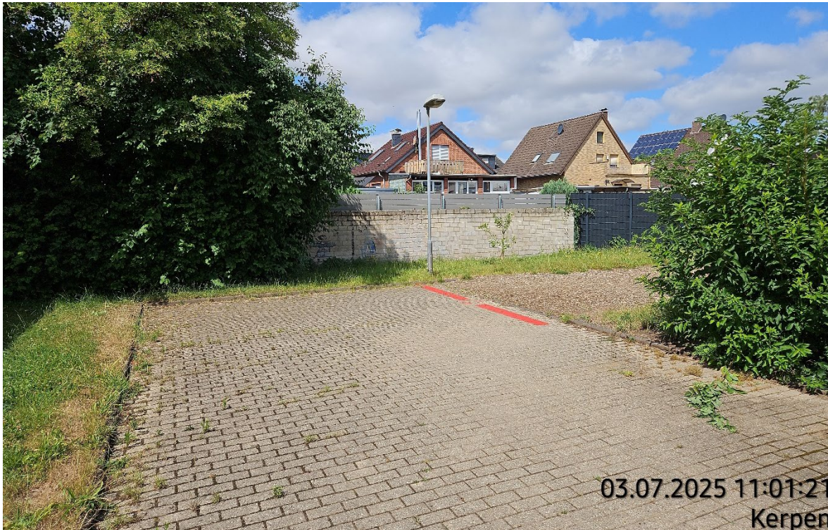
Betonsteinpflaster aufnehmen – Pos. 02.03