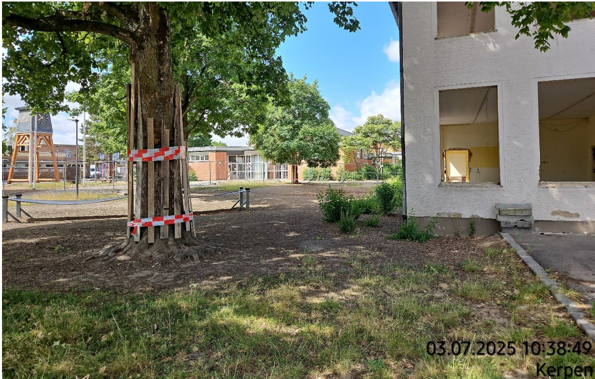
Blick auf großen Schulhof + Mehrzweckhalle (mitte, hinten)