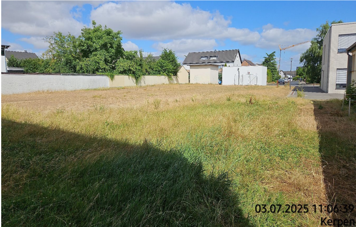
Gras- / Ruderalflur mähen – Pos. 02.32