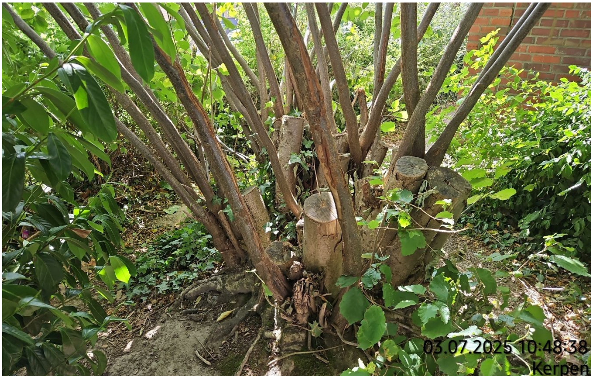
Einzelgehölze roden – Pos. 02.35 bis 02.37