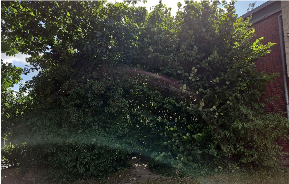
Einzelgehölze roden – Pos. 02.35 bis 02.37