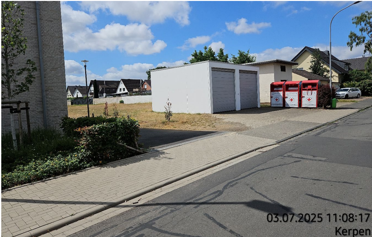
Zugang Schulhof Fuchsiusstraße