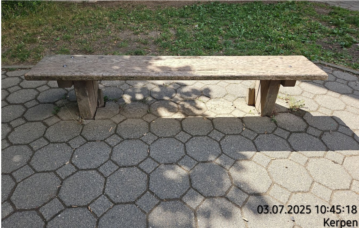
Holzbank aufnehmen – Pos. 02.21