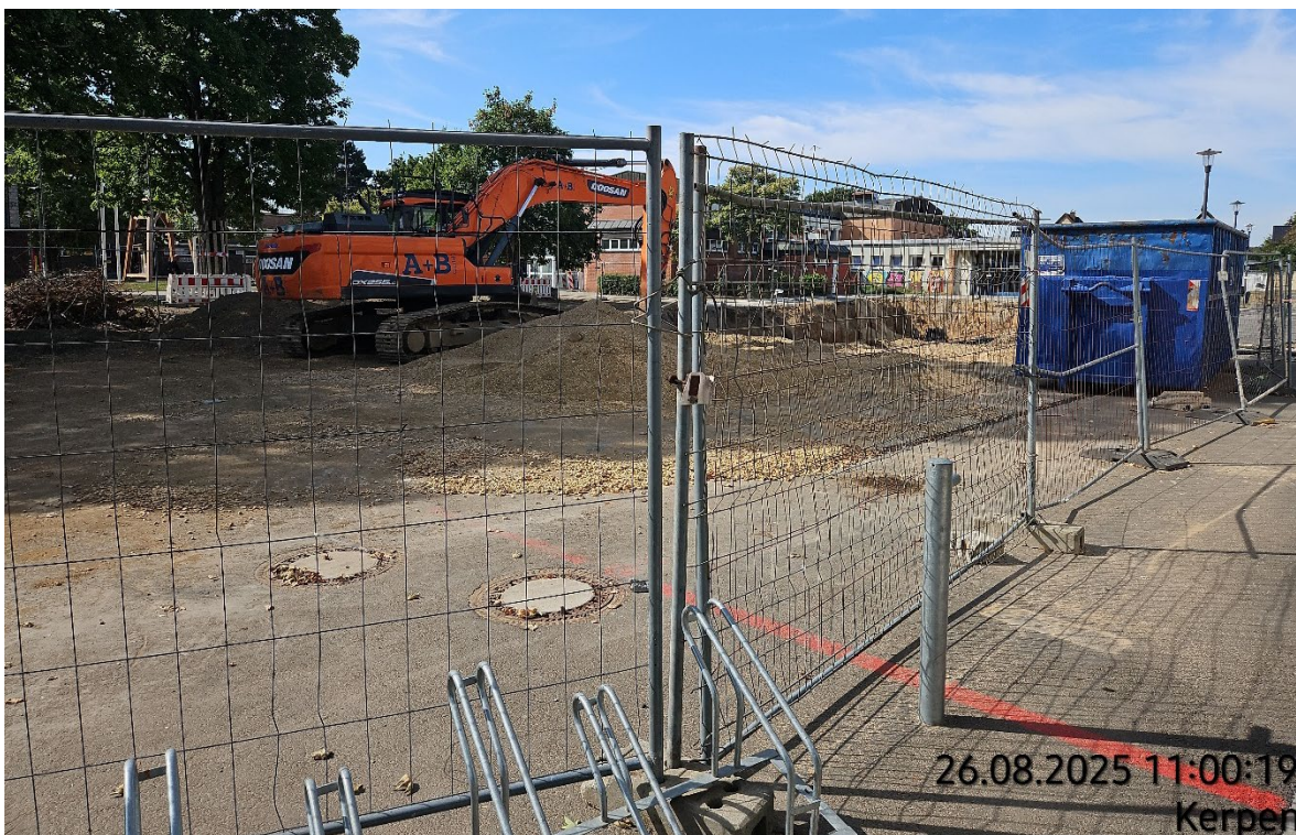
Schacht DN 1000 aufnehmen – Pos. 02.14 (Altbau bereits abgerissen)