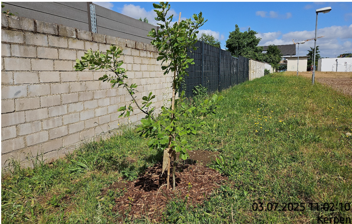
Grasnarbe abtragen – Pos. 02.33 | Baum umsetzen – Pos. 02.39