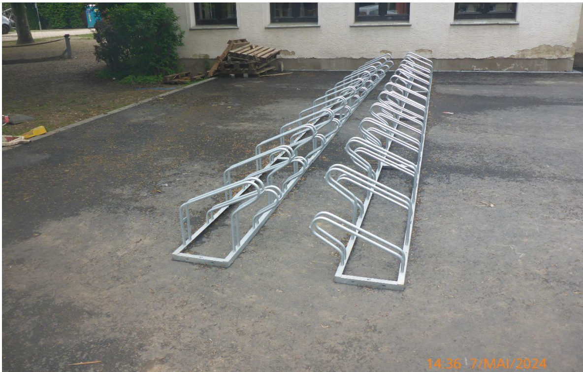
Fahrradparker seitlich lagern – Pos. 02.18