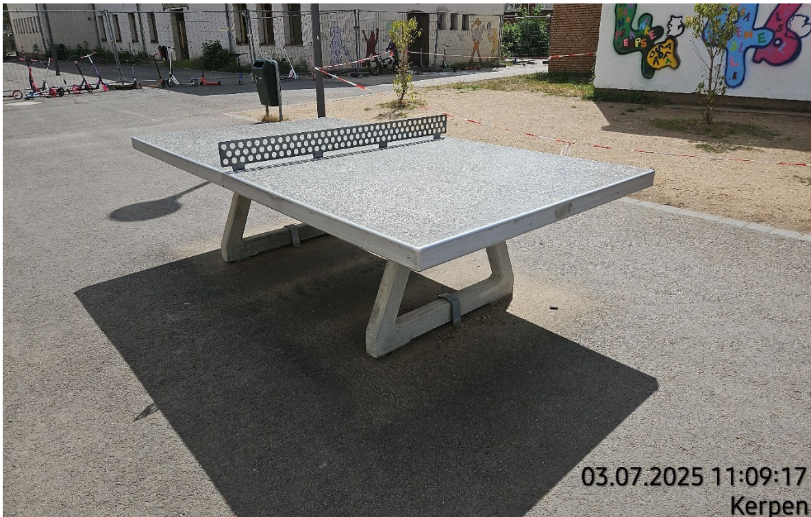
Tischtennisplatte seitlich lagern – Pos. 02.20