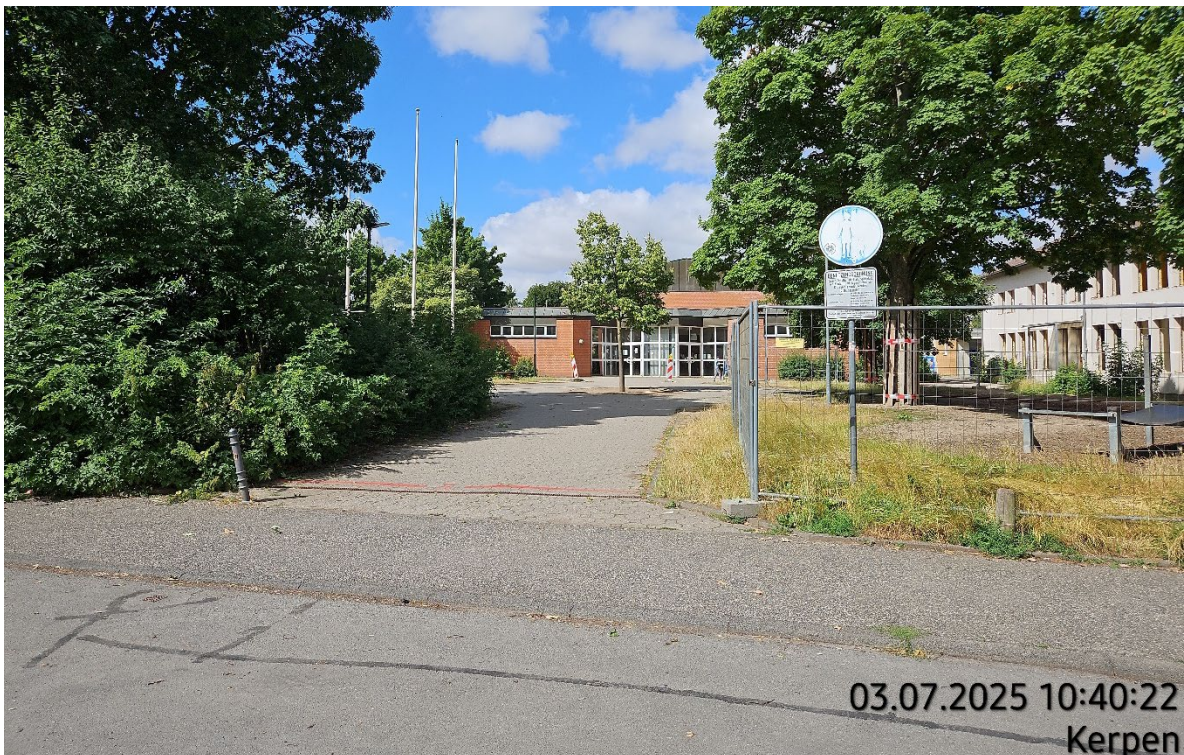
Hauptzugang Schulhof + Mehrzweckhalle