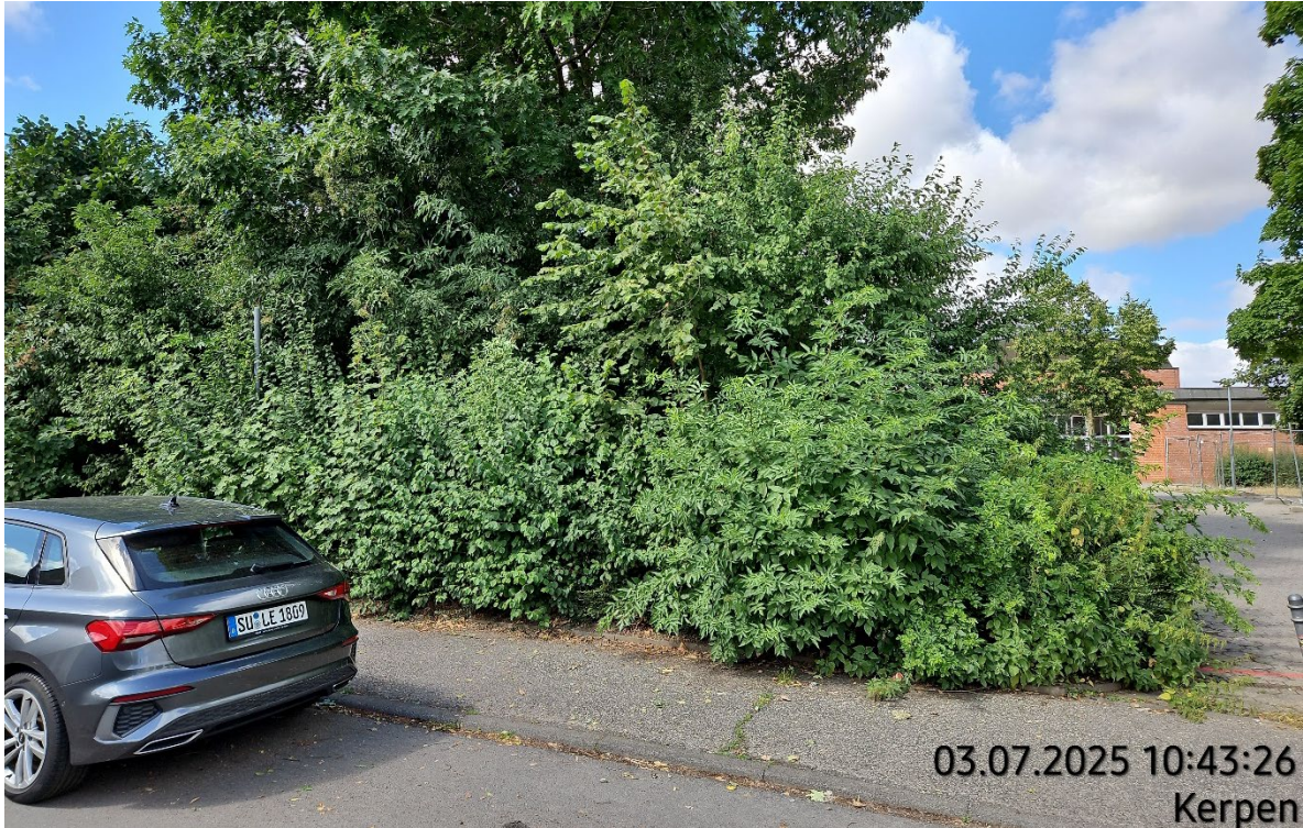
Gehölzfläche und Einzelgehölze roden – Pos. 02.34 bis 02.37