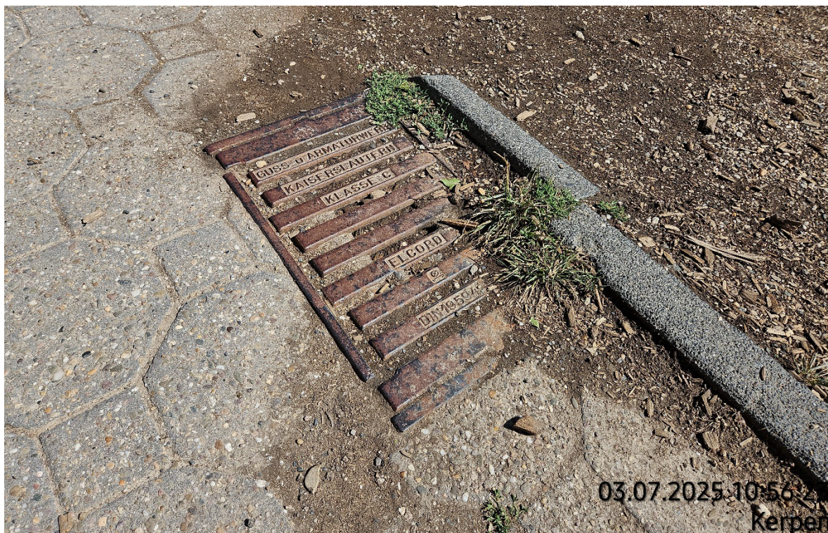
Hof- / Straßenablauf aufnehmen – Pos. 02.10