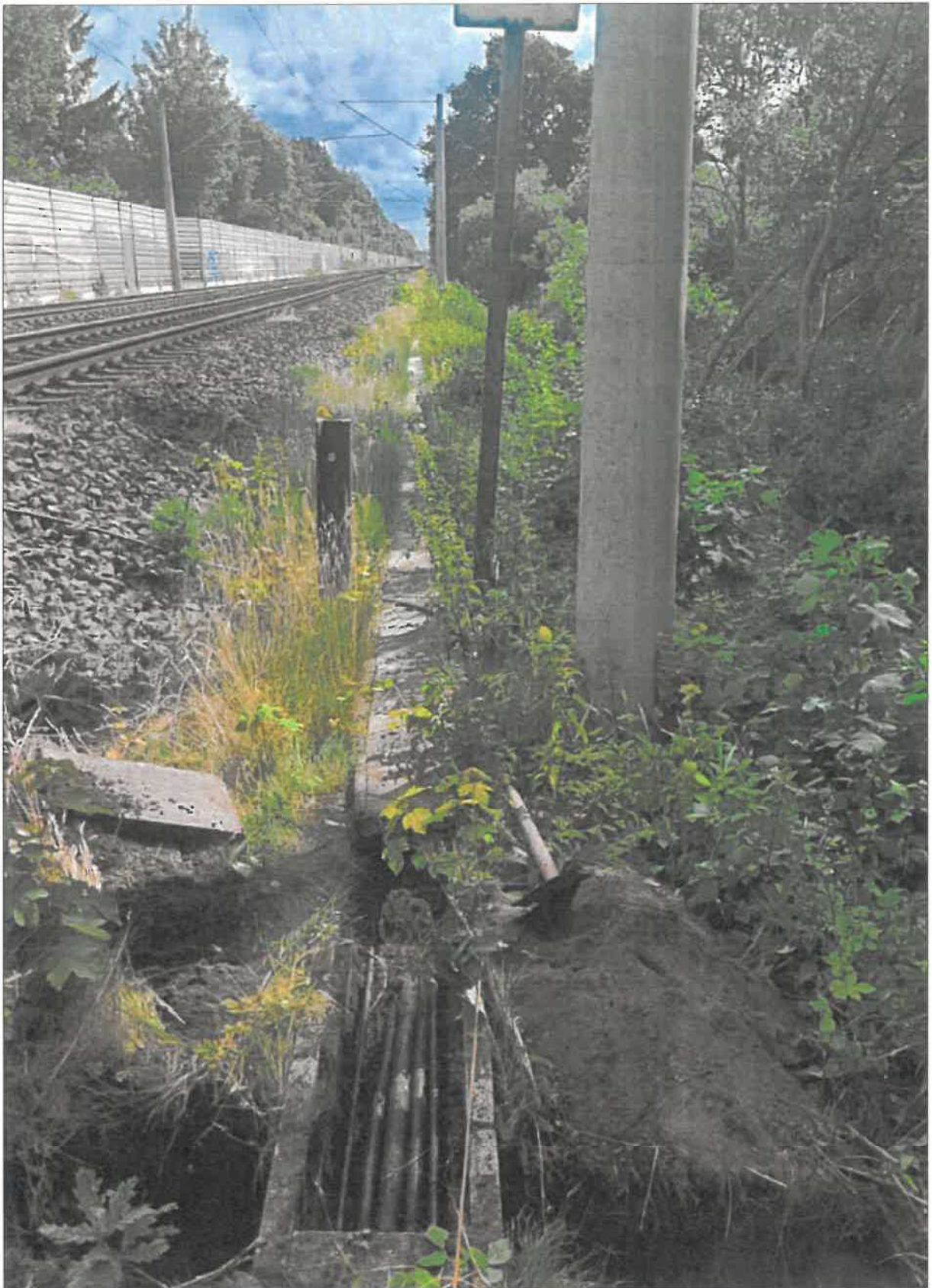
Bkm 7,203 bahnlinks Signalkabel 3,10m von Gleismitte 1,0m von Kante