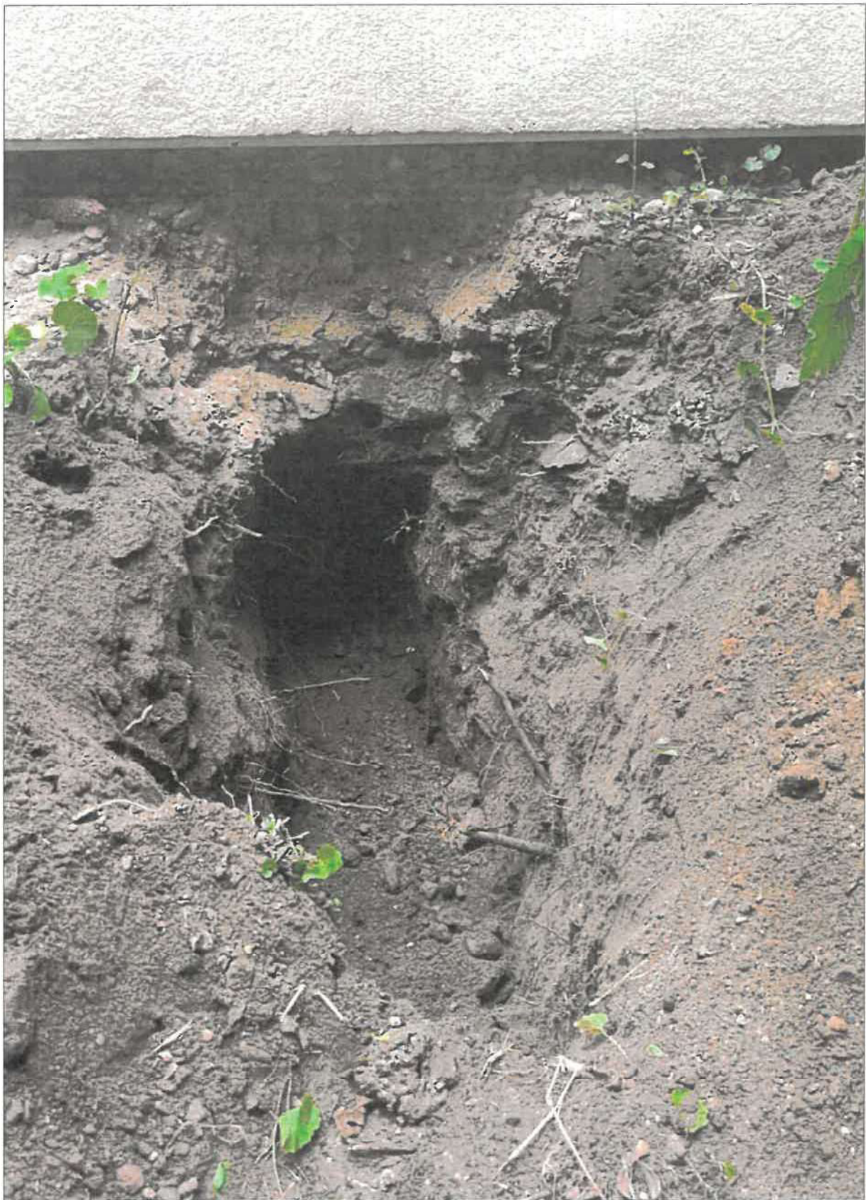
Bkm 7,203 hinter SSW Suchschachtung 1,10m x 0,50m x 1,00m – kein Kabel