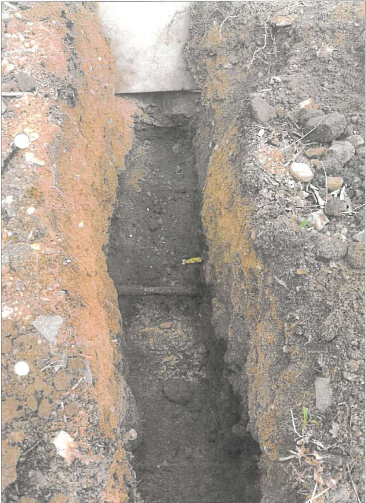
Bkm 7,203 bahnrechts 1 Kabel 3,70m von Gleismitte und 1,20m von OK Schwelle, 0,4m breit