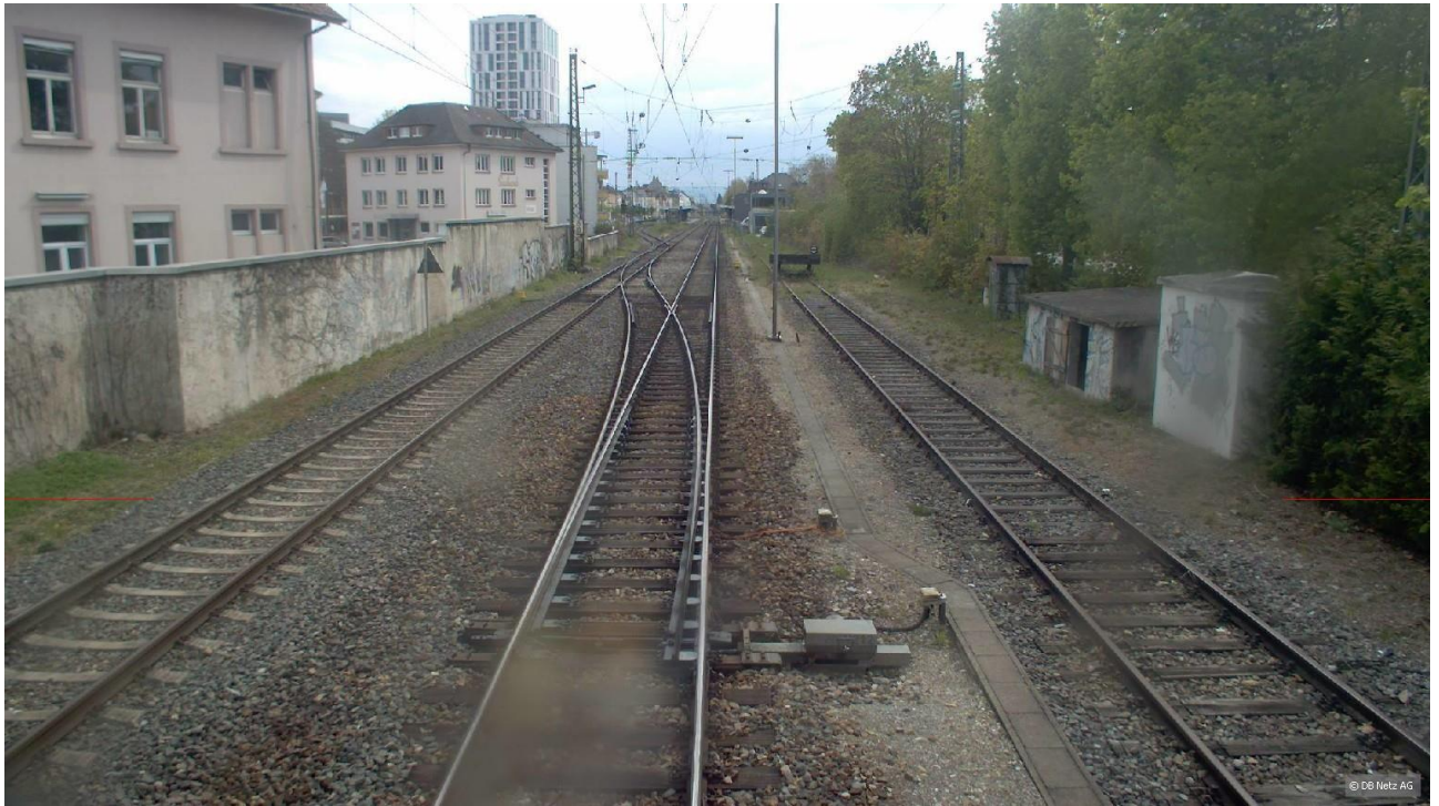
Bild 1: [km 6,831 (Blickrichtung gegen km, Aufnahmedatum 2021).jpg]