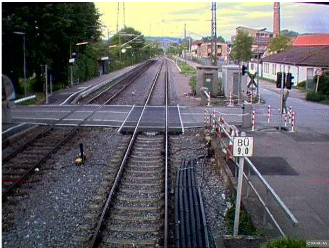
Bild 6: [km 9,085 (Aufnahmedatum 2005, inzwischen Bahnsteig links entfernt).jpg]