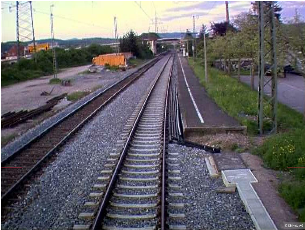
Bild 5: [km 8,900 (Aufnahmedatum 2005, inzwischen auch Bahnsteig links).jpg]