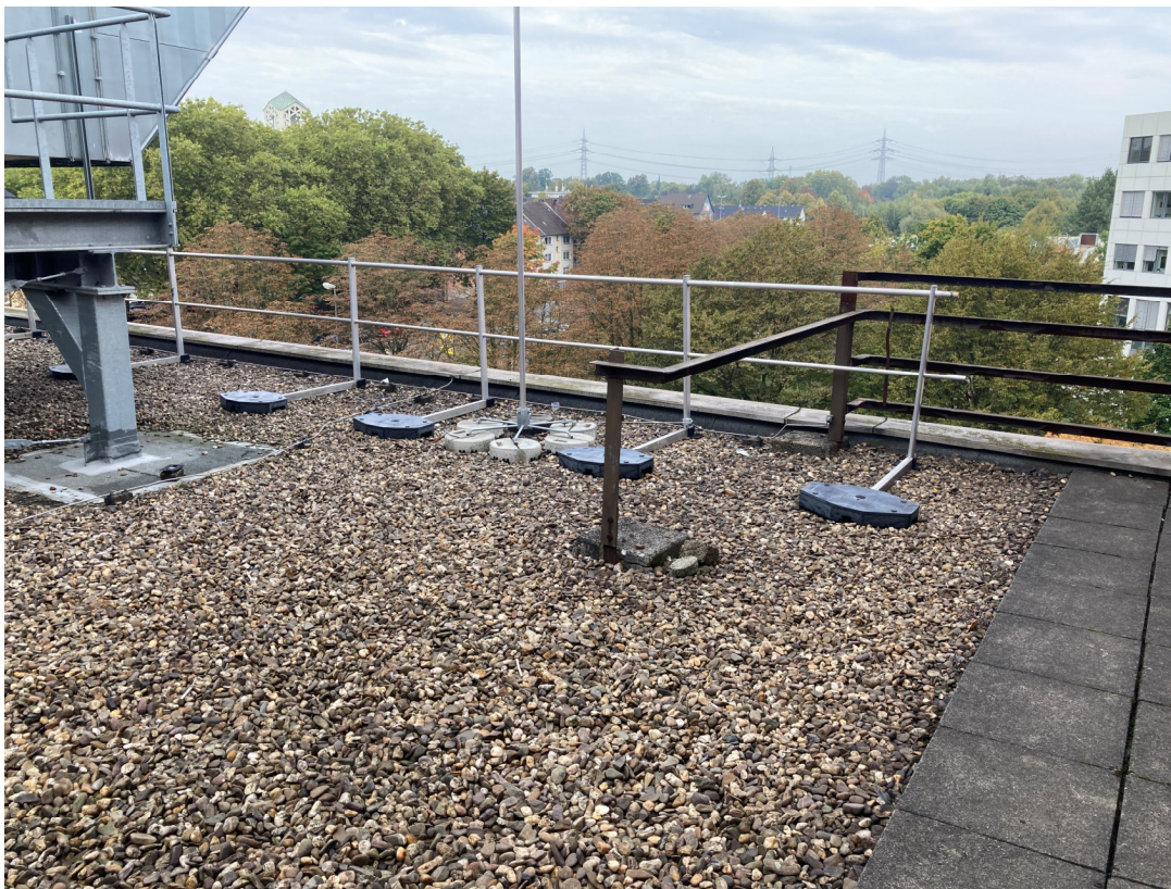
Geb. T01 (Dachfläche West): vorh. Absturzsicherung, nordwestliche Blickrichtung