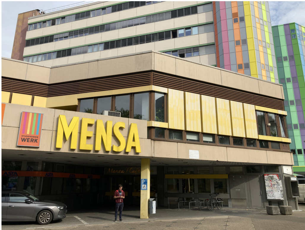
Ansicht Geb. T01 (Dachfläche Ost): Süd-Ost-Fassade