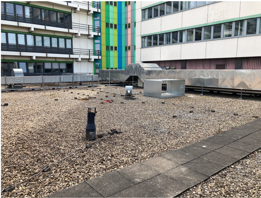
Geb. T01 (Dachfläche West): vorh. Lüftungsanlage, südöstliche Blickrichtung