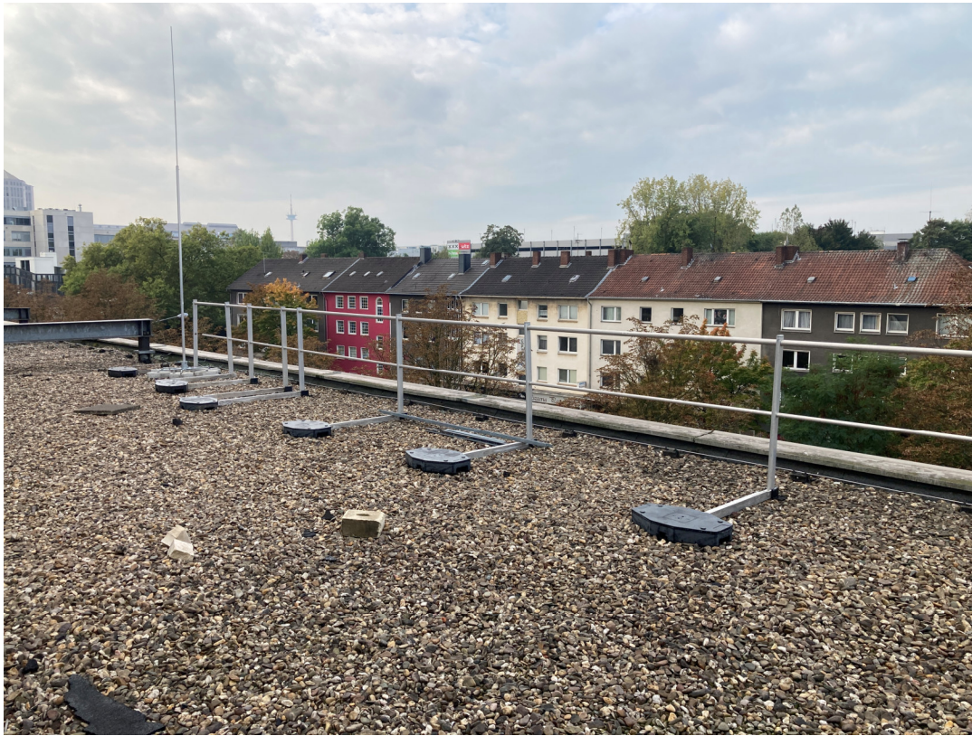
Geb. T01 (Dachfläche West): vorh. Absturzsicherung, parallel zur Segerothstrasse