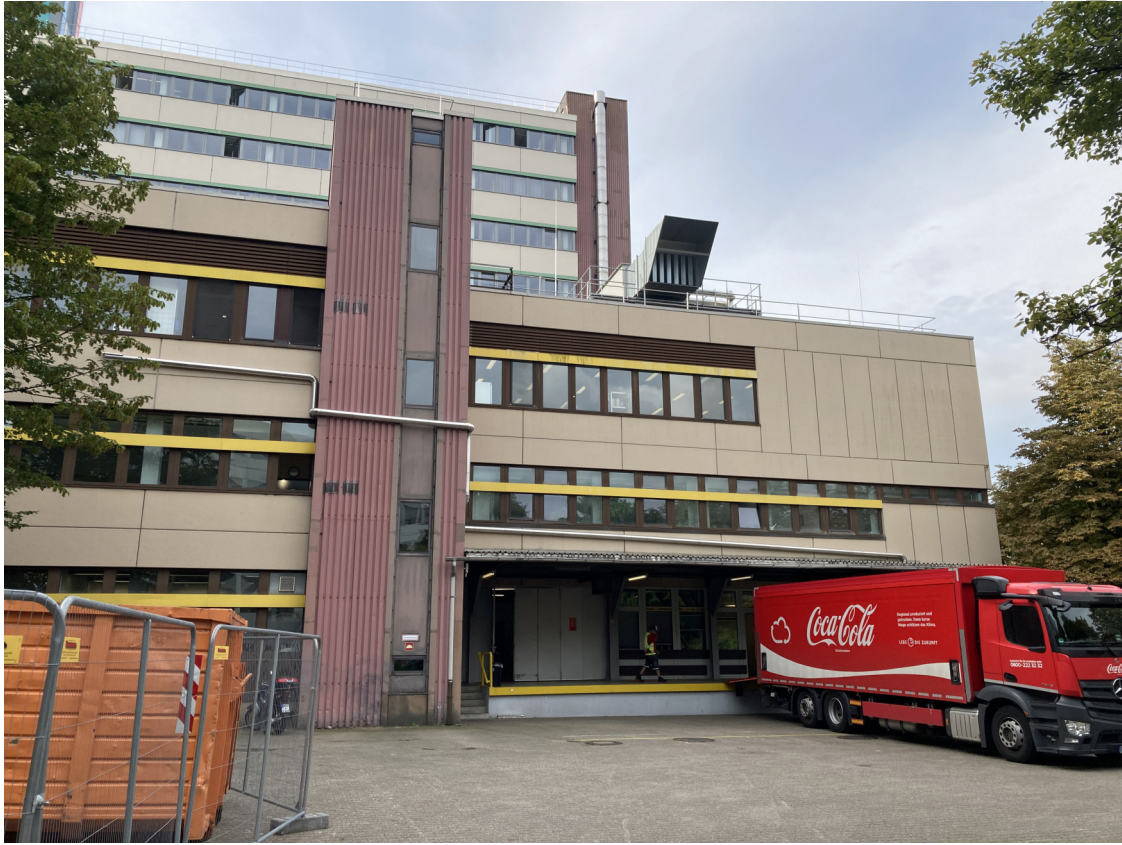
Ansicht Geb. T01: (Dachfläche West), nördliche Fassade