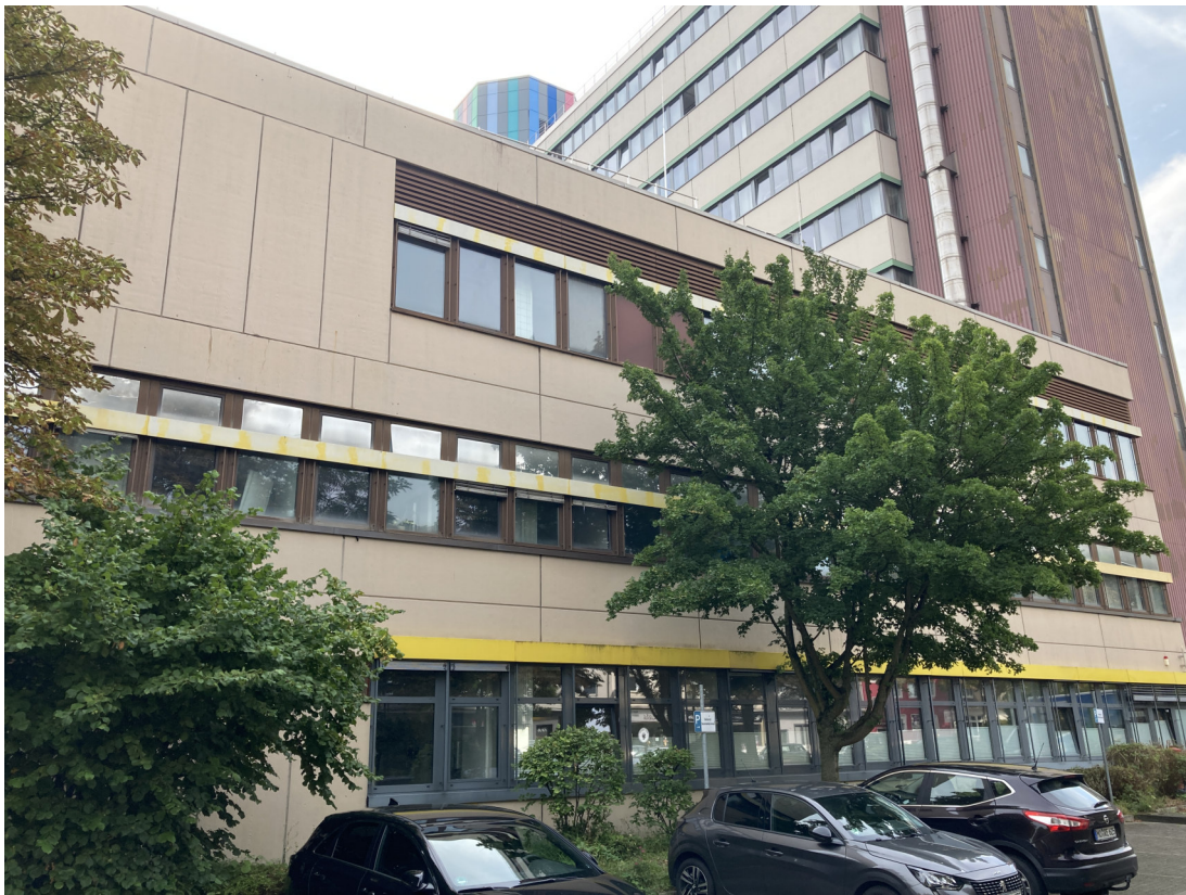
Ansicht Geb. T01: (Dachfläche West), westliche Fassade