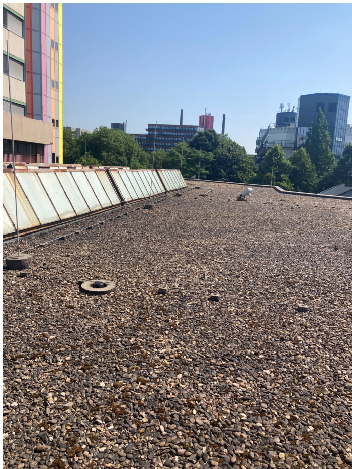
Dachfläche Ost: vorh. Sheddächern; Blickrichtung Ost