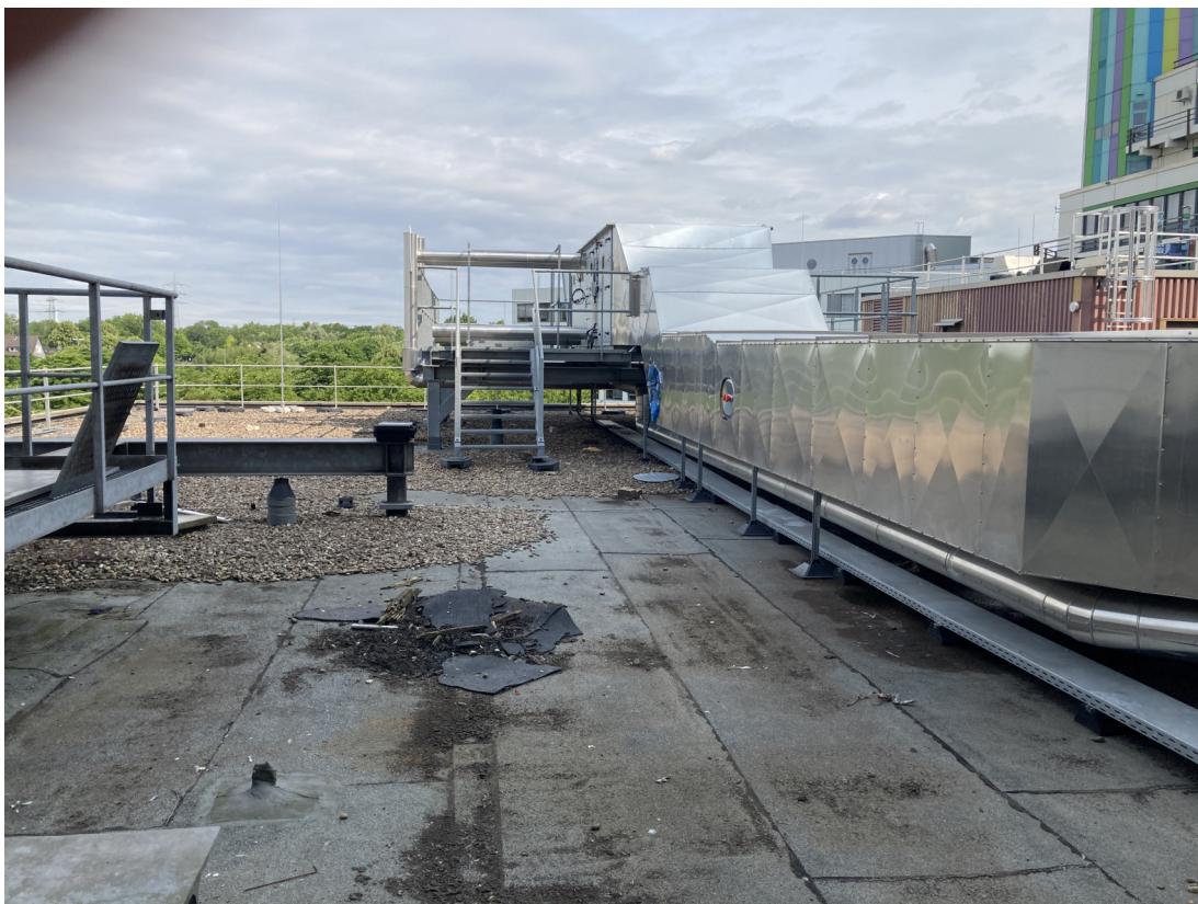
Geb. T01 (Dachfläche West): vorh. Lüftungsanlage, nördliche Blickrichtung