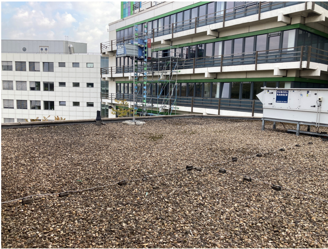
Geb. T01 (Dachfläche West): nördliche Blickrichtung auf Geb. T03