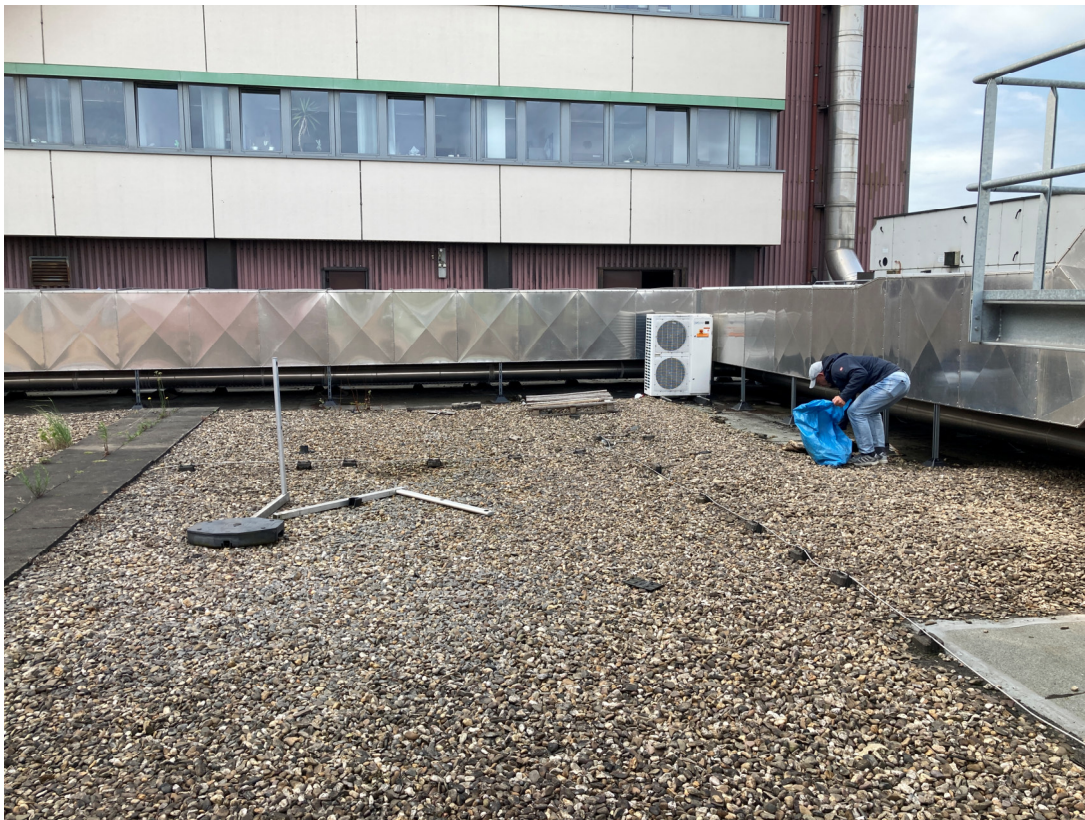
Geb. T01 (Dachfläche West): vorh. Lüftungsanlage, südliche Blickrichtung auf Geb. T02