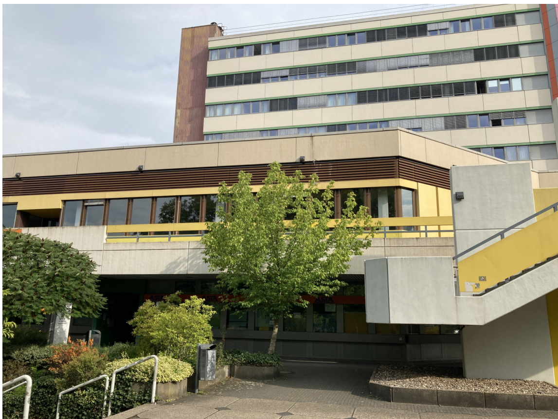
Ansicht Geb. T01 (Dachfläche Ost): Südfassade