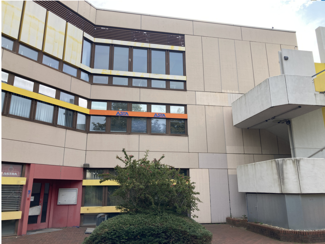
Ansicht Geb. T01 (Dachfläche Ost): westl. Fassade