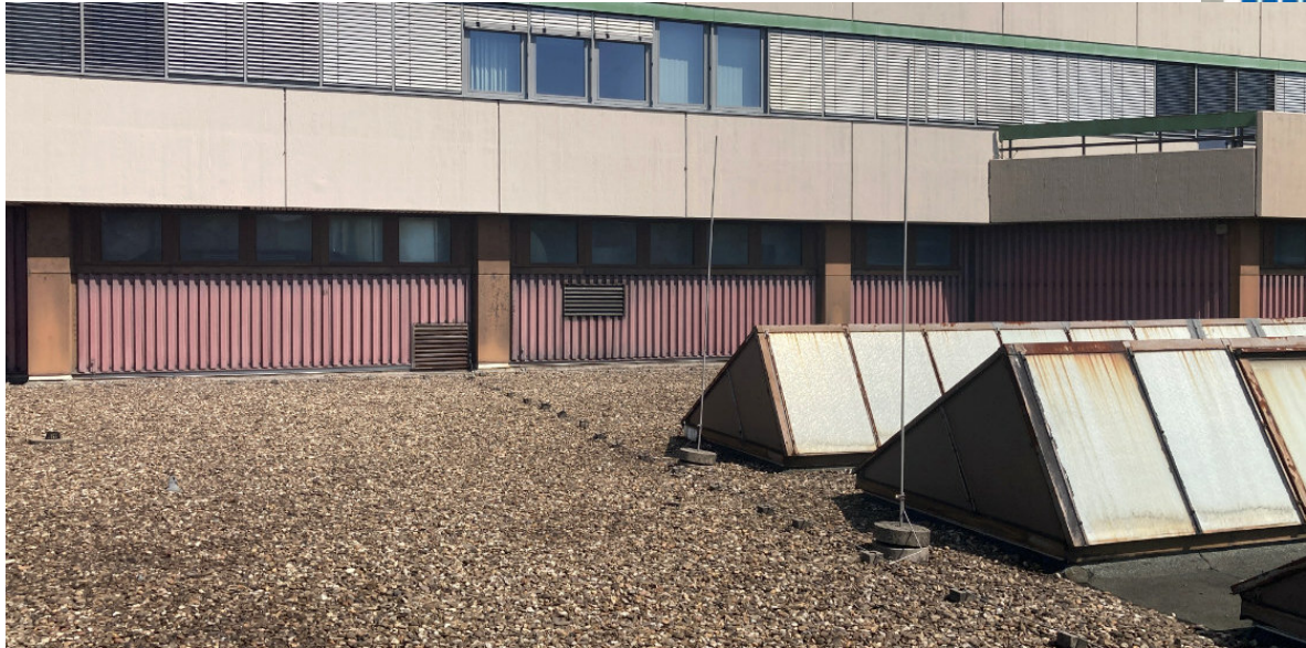
Dachfläche Ost: Ansicht Südfassade, Geb. T02 mit vorh. Sheddächern