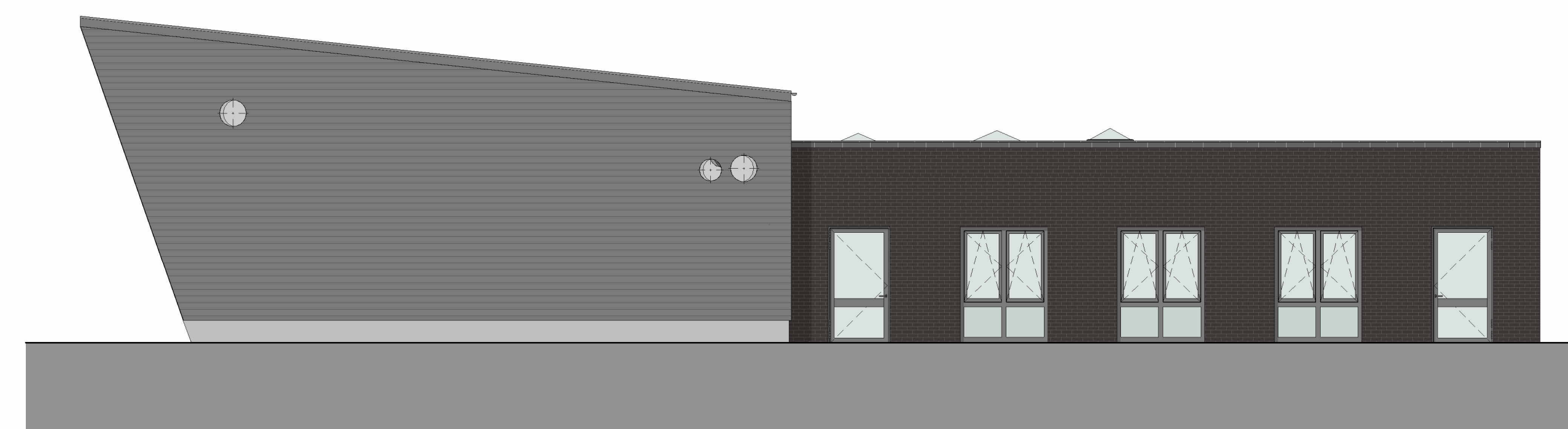
Ansicht Südwest 1:100