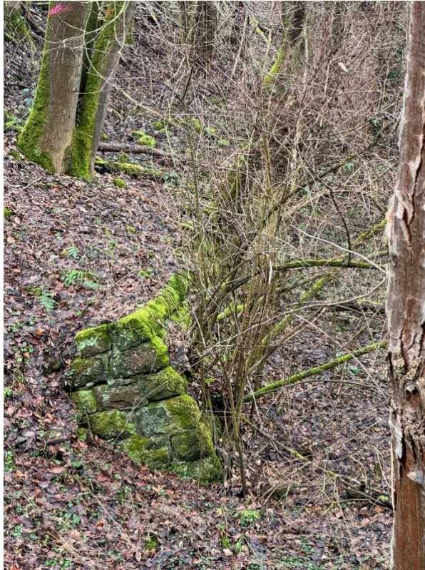
Bild 24 Laubach nördlicher Auslauf