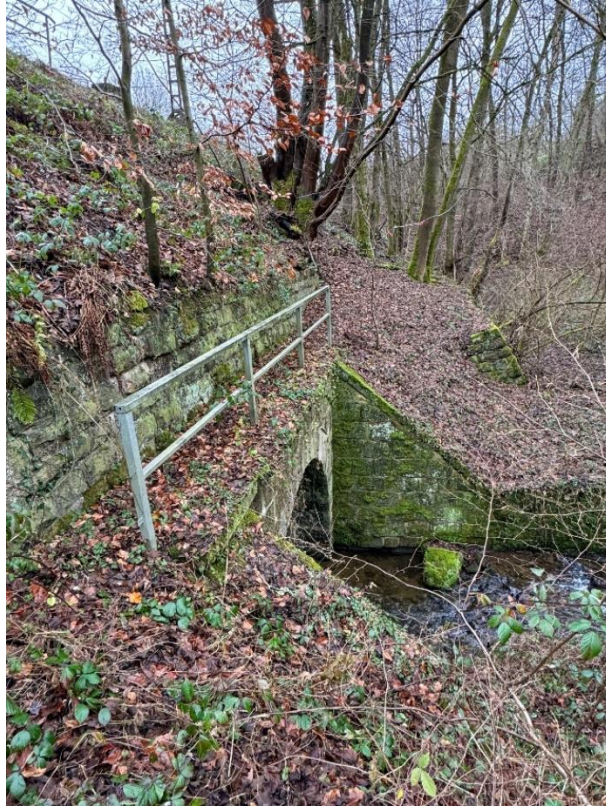
Bild 22 Laubach südlicher Auslauf mit anschließender Stützwand und Rohrauslauf