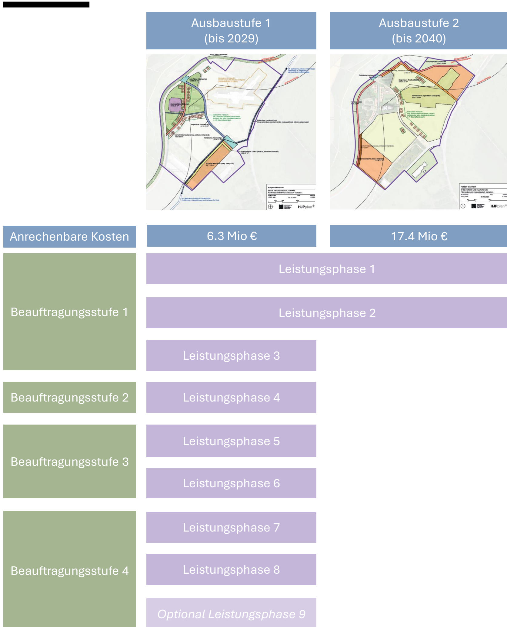
Ausbaustufe 1 (bis 2029)