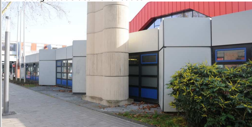
Umkleidegebäude des Hallenbades

Bei nicht genormten Stoffen und Bauteilen sind, soweit erforderlich, die bauaufsichtlichen Zulassungen der Bauleitung zu übergeben