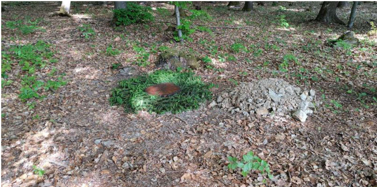
Bild 2: Wald und Holz NRW: Mit Abdeckplatte (Baumscheibe) versehenes fertiges Urnengrab