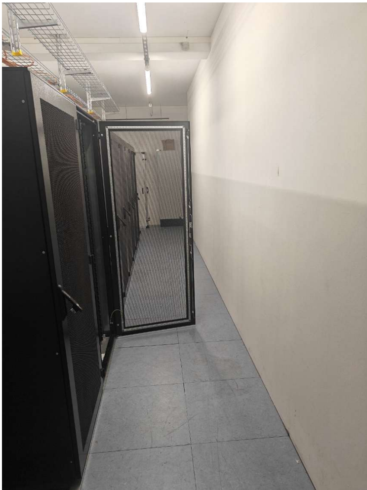
Abbildung 5 Serverraum