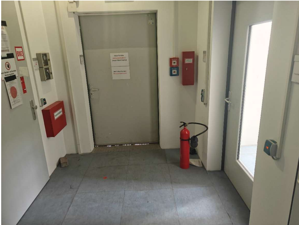
Abbildung 2 Flur im Erdgeschoss, Rechts Tür zum Treppenhaus