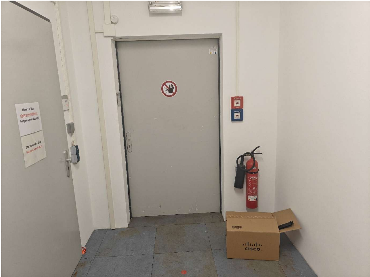
Abbildung 6 Flur 1. Etage Außentür

Die Anlieferung über die Außentür der 1. Etage (Abbildung 4 & 6) führt zum Flur der 1 Etage (Abbildung 4) und dann zum Serverraum (Abbildung 5)