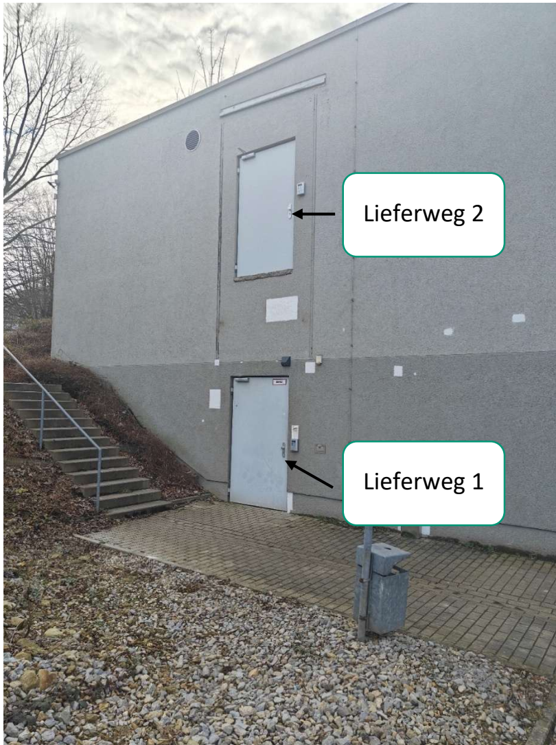
Abbildung 1 Eingang Gebäude MH DC Süd

Die für den Transport zum Bestimmungsort erforderlichen Geräte müssen vom Lieferanten mitgebracht werden. Es ist kein Fahrstuhl oder Lastenaufzug vorhanden.