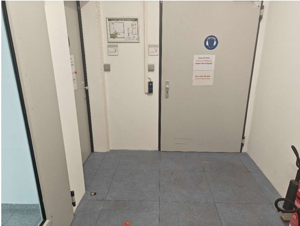
Abbildung 4 Flur 1. Etage, erste Tür links Serverraum, zweite Tür Links Treppenhaus